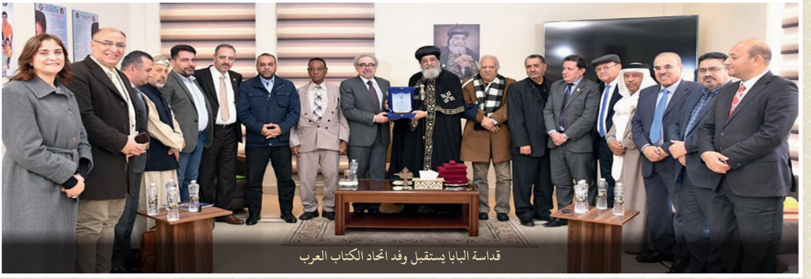
قداسة البابا يستقبل وفد اتحاد الكتاب العرب