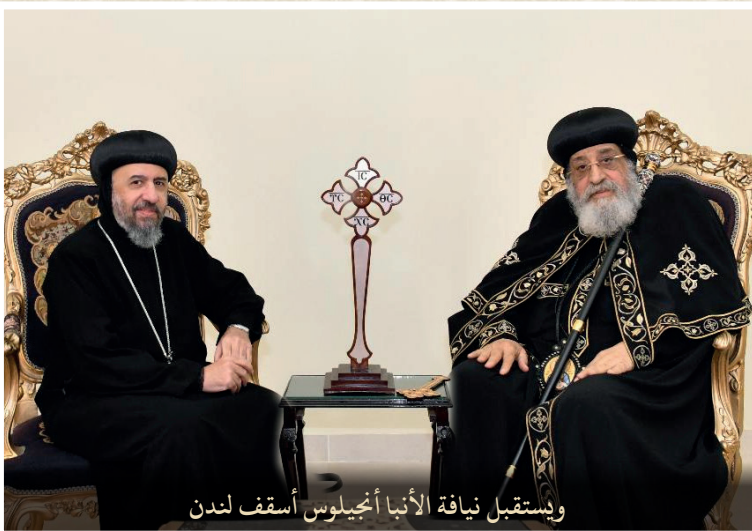
وإستقبل نيافة الأنبا أنجيلوس أسقف لندن