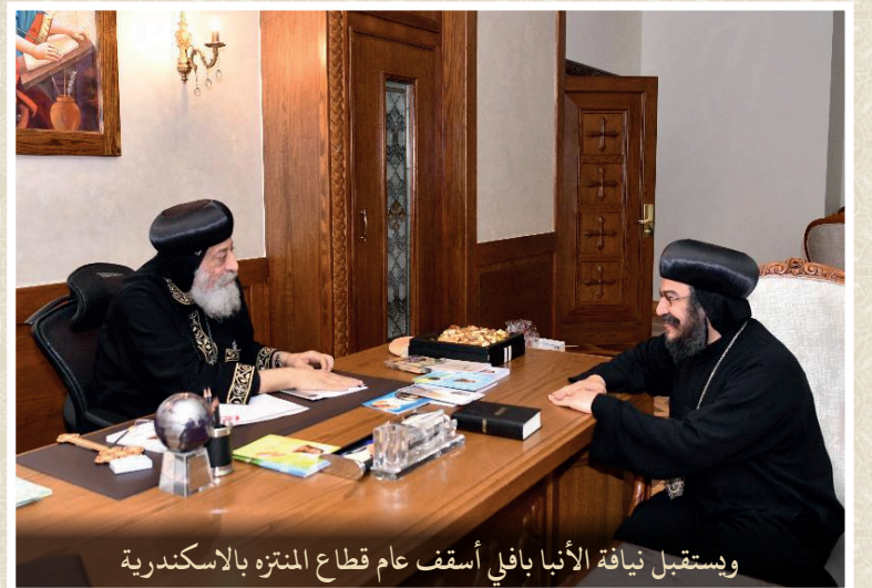
وإستقبل نيافة الأنبا بافلي أسقف عام قطاع المنتزه بالاسكندرية