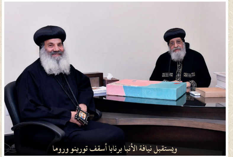
وإستقبل نيافة الأنبا برنابا أسقف تورينو وروما