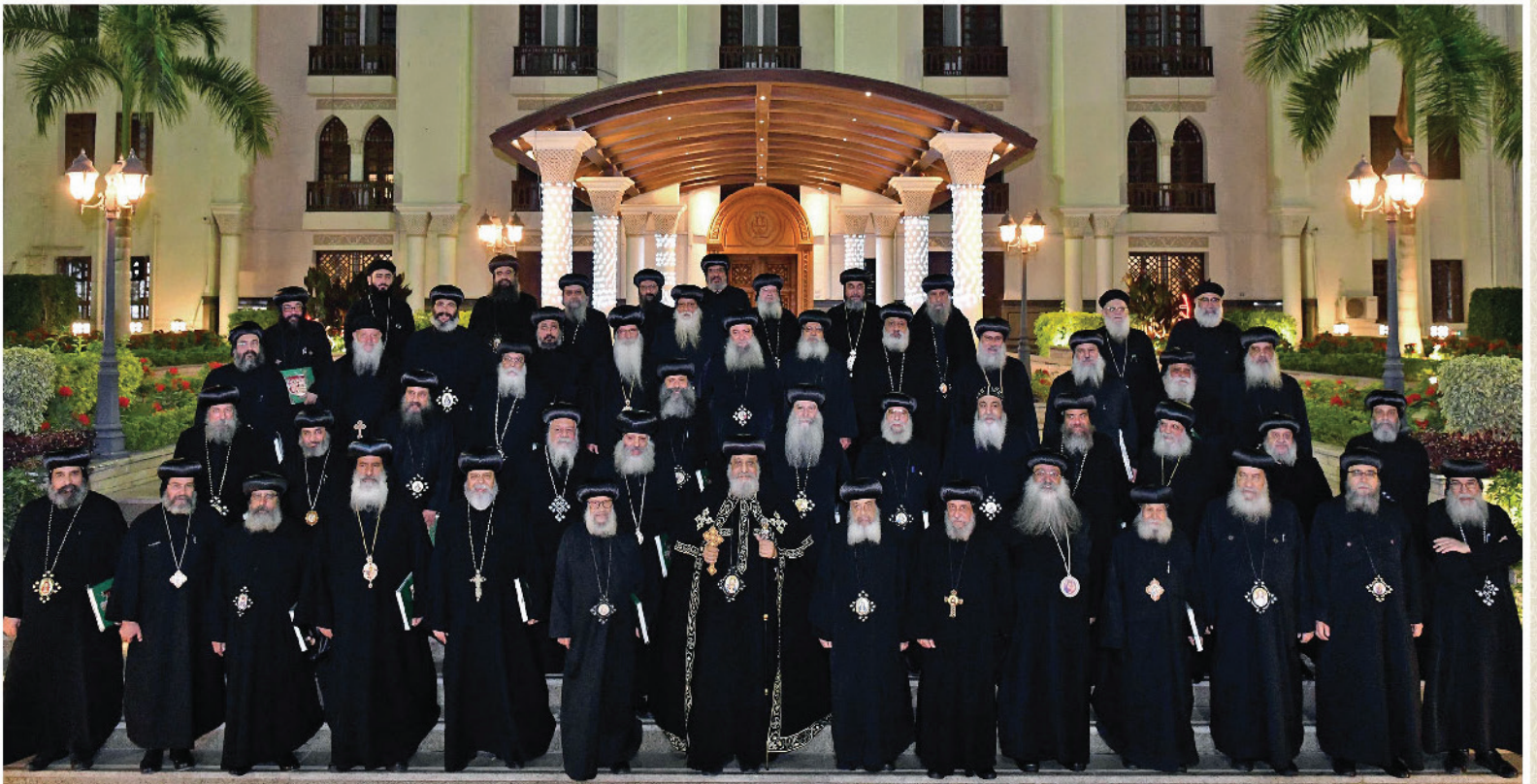
قداسة البابا يسقبل الآباء المطارنة والأساقفة أعضاء المجمع المقدس في المقر البابوي بالكاتدرائية المرقسية بالأقنوس بالقاهرة