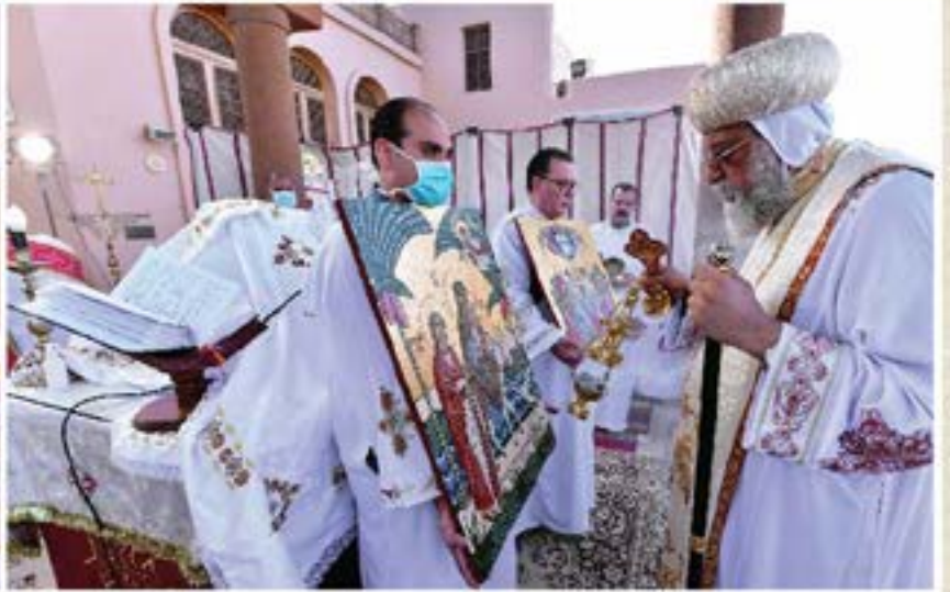
ويصلي قداس عيد دخول السيد المسيح والعائلة المقدسة أرض مصر بكنيسة السيدة العذراء بالمعادي