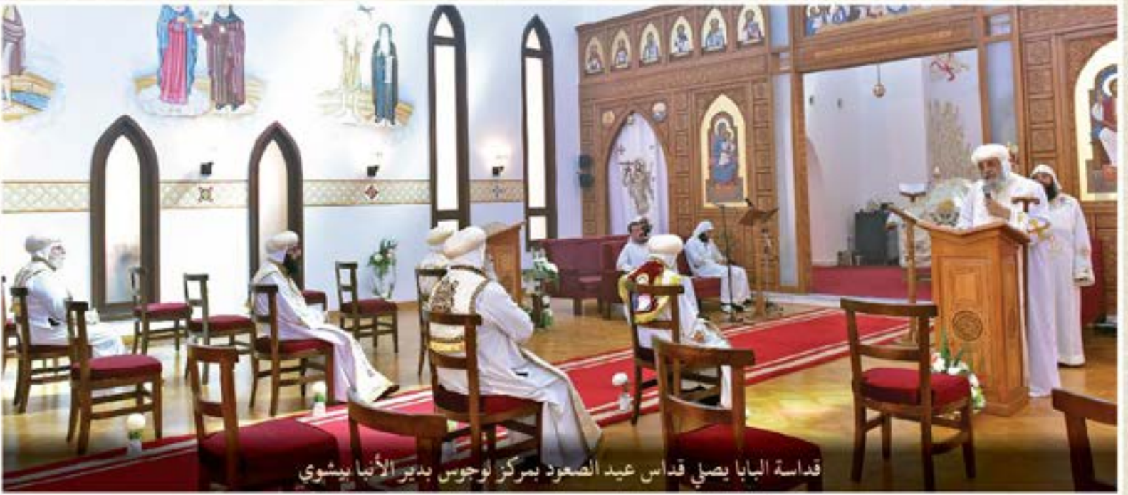
قداسة البابا يصلي قداس عيد الصعود بمركز لوجوس بدير الأنبا بيشوي

وتحتفل الكنيسة القبطية - وفقاً لتقليدها - بعيد صعود السيد المسيح إلى السماء بعد أربعين يوماً من عيد القيامة. طبقاً لما ذكره القديس لوقا الرسول في مستهل سفر أعمال الرسل: الكَلَامُ الْأَوَّلُ أَنشَأَهُ يَا تَارْقِيْلُسُ، عَن جَمِيعِ مَا ابْتَدَأَ يَسُوعُ يَفْعَلُهُ وَيُعَلِّمُهُ، إِلَى الْيَوْمِ الَّذِي ارْتَفَعَ فِيهِ، بَعْدَ مَا أَوْصَى بِالرُّوحِ الْقُدُّوسِ الرُّسُلَ الَّذِينَ اخْتَارَهُمْ. الَّذِينَ أَرَاهُمْ أَيْضاً نَفْسَهُ حَيًّا بِرَأْيَيْنِ كَثِيرَةٍ، بَعْدَ مَا نَأَلَمَ، وَهُوَ يَظْهَرُ لَهُمْ أَرْبَعِينَ يَوْمًا، وَيَتَكَلَّمُ عَنِ الْأُمُورِ الْمُخْتَصَّةِ بِمَلَكُوتِ اللَّهِ. (أع ١٤: ٣). وقد ألقى قداسة البابا عظمة القداس عن تأملات فيما قبل صعود السيد المسيح ووقت ويعد الصعود المجيد.