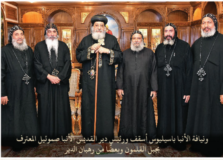
ويناية الأنبا باسيليوس أسقف ورئيس دير القديس الأنبا صموئيل المعترف جبل القلمون وبعضاً من رهبان الدير