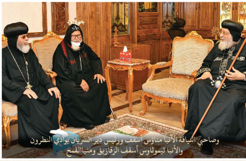
وصاحبي النياقة الأنبا متاؤس أسقف ورئيس دير السريان بوادي النظرون والأنبا تيموثاوس أسقف الزقازيق ومنيا القمح