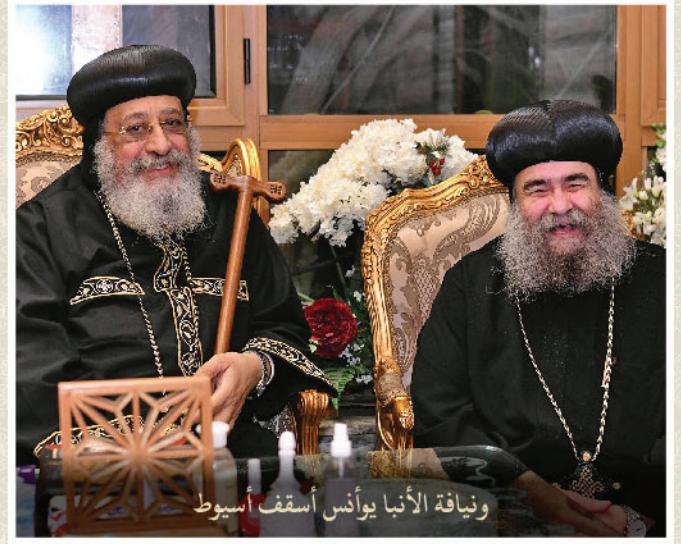
ويناية الأنبا يوانس أسقف أسيوط