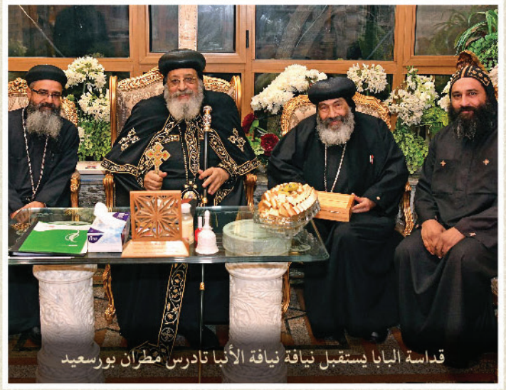
قداسة البابا يستقبل نياقة الأنبا تادرس مطران بورسعيد