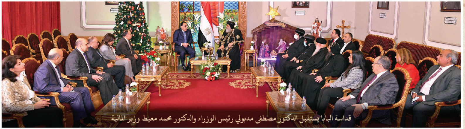
قداسة البابا يستقبل الدكتور مصطفى مدبولي رئيس الوزراء والدكتور محمد معيط وزير المالية