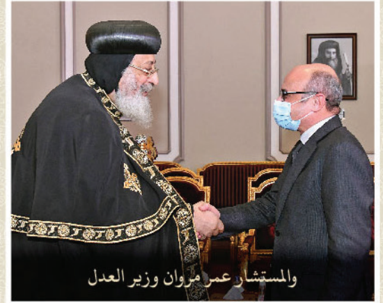
والمستشار عمر مروان وزير العدل