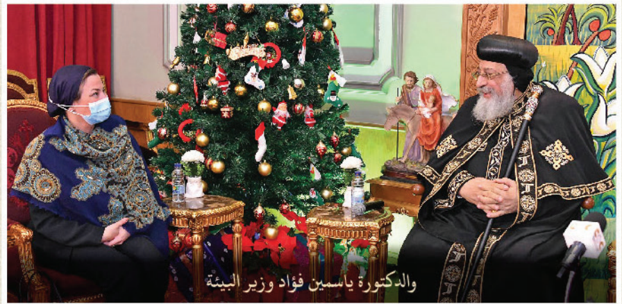
والدكتورة ياسمين فؤاد وزير البيئة