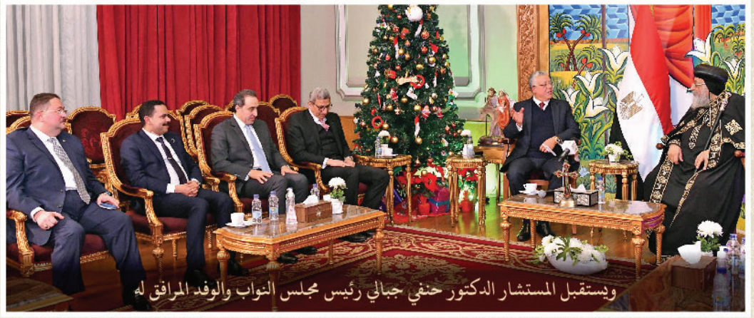
ويستقبل المستشار الدكتور حنفي جبالي رئيس مجلس النواب والوفد المرافق له