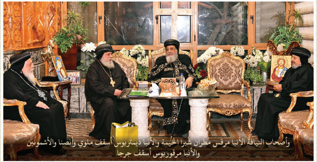
وأصحاب النياقة الأنبا مرقس مطران شبرا الخيمة والأنبا ديمتريوس أسقف ملوي وأنصنا والأشمونيين والأنبا مرقوريوس أسقف حرجا