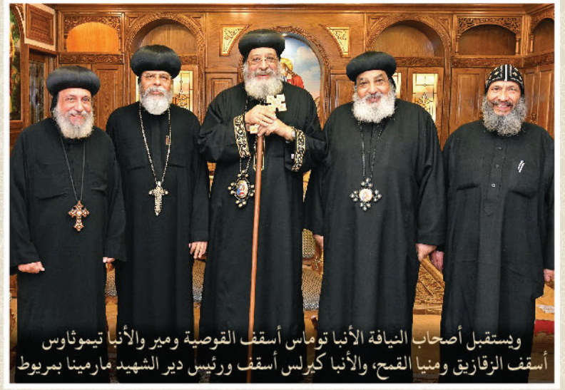
ويستقبل أصحاب النيافة الأنبا توماس أسقف القوصية ومير والأنبا تيموثاوس أسقف الزقازيق ومنيا القمح، والأنبا كيرلس أسقف ورئيس دير الشهيد مارمينا بربوط