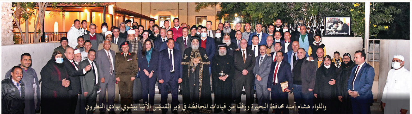
واللواء هشام أمينة محافظ البحيرة ووفداً من قيادات المحافظة في دير القديس الأبنا بيشوي بوادي النطرون