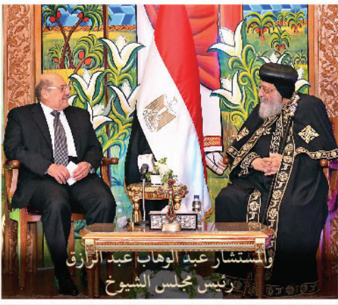
المستشار عبد الوهاب عبد الرزق رئيس مجلس الشيوخ