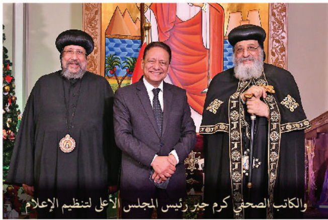
والكاتب الصحفي كرم جبر رئيس المجلس الأعلى لتنظيم الإعلام