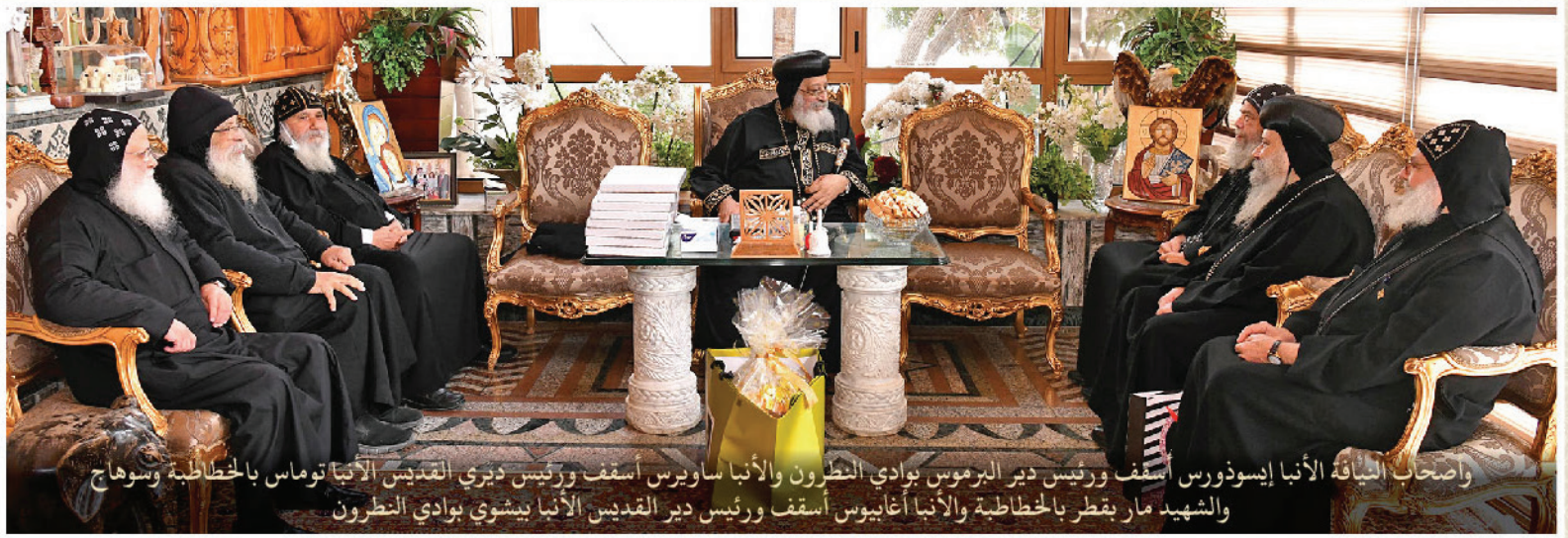
وأصحاب النياقة الأنبا إيسودورس أسقف ورئيس دير البرموس بوادي النظرون والأنبا ساويرس أسقف ورئيس دير القديس الأنبا توماس بالخطاطبة وسوماح والشهيد مار بقطر بالخطاطبة والأنبا أغايوس أسقف ورئيس دير القديس الأنبا يمشوي بوادي النظرون