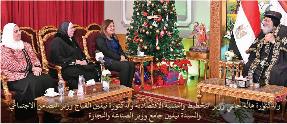
والدكتورة هالة حلي وزير التخطيط والتنمية الاقتصادية والدكتورة نيفين القباج وزير التضامن الاجتماعي والسيدة نيفين جامع وزير الصناعة والتجارة