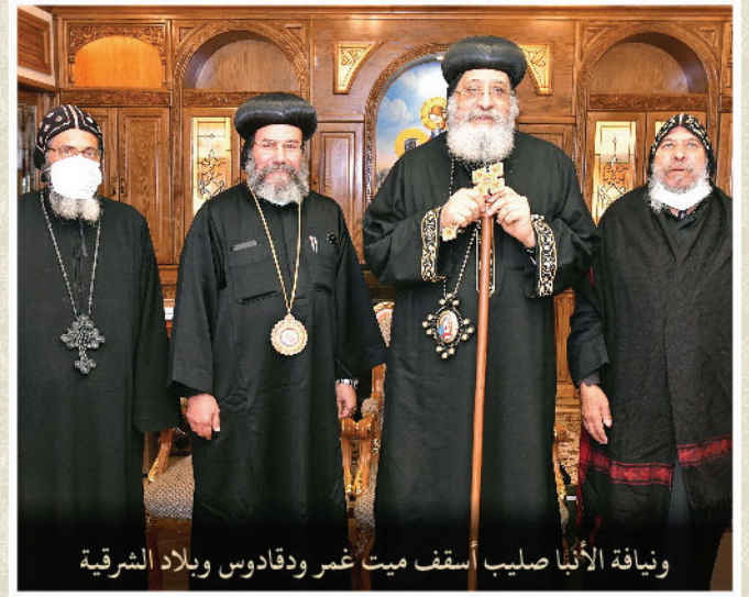
ويناية الأنبا صليب أسقف ميت غمر ودقادوس وبلاد الشرقية