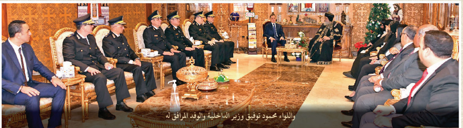
واللواء محمود توفيق وزير الداخلية والوفد المرافق له