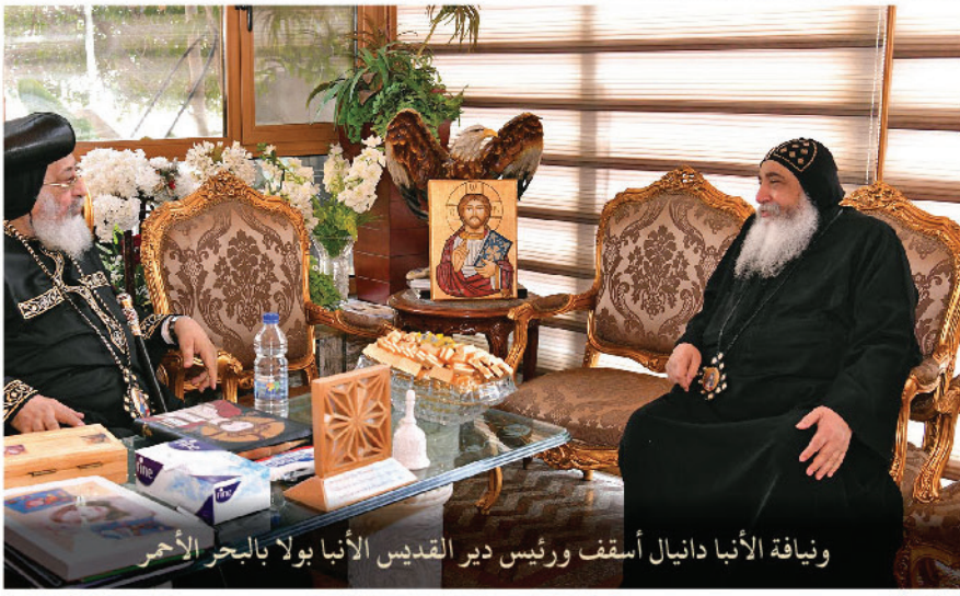
ويناية الأنبا دانيال أسقف ورئيس دير القديس الأنبا بولا بالبحر الأحمر