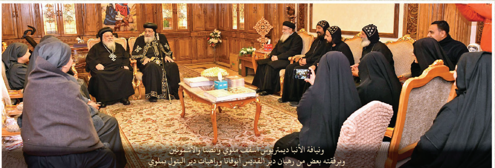
ونياقة الأنبا ديمتريوس أسقف ملوي وأنصنا والأشمونيين وبرفقتة بعض من رهبان دير القديس أبوفانا وراهبات دير البتول بملوي