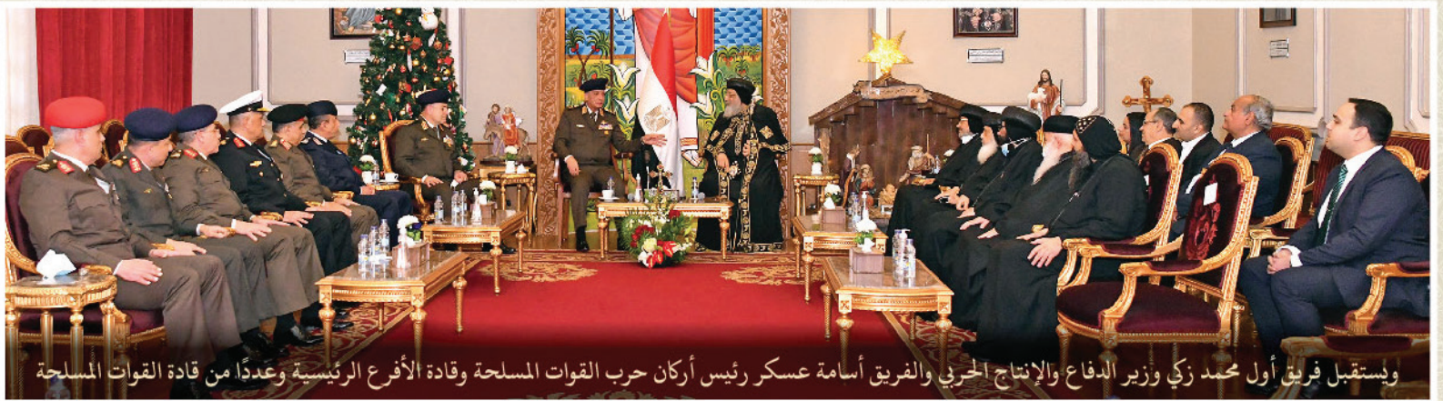
ويستقبل فريق أول محمد زكي وزير الدفاع والإنتاج الحربي والفريق أسامة عسكر رئيس أركان حرب القوات المسلحة وقادة الأفرع الرئيسية وعددًا من قادة القوات المسلحة