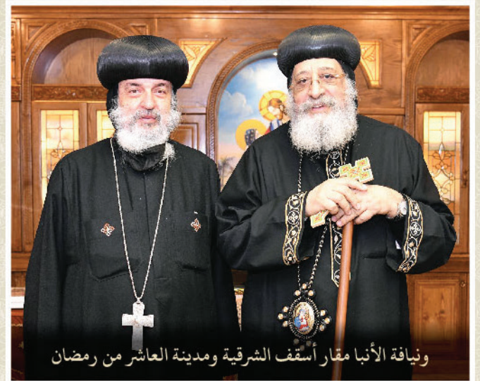
ويناية الأنبا مقار أسقف الشرقية ومدينة العاشر من رمضان