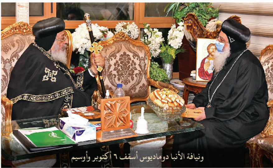
ويناية الأنبا دوماديوس أسقف ٦ أكتوبر وأوسيم