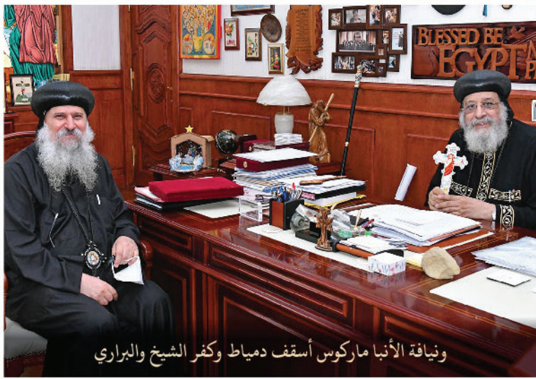
وفياة الأنبا ماركوس أسقف دمياط وكفر الشيخ والبراري