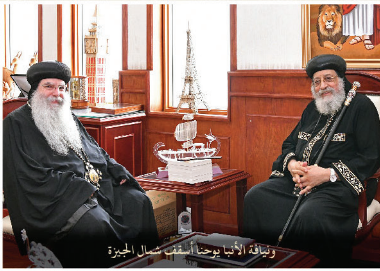
وفياة الأنبا يوحنا أسقف شمال الجيزة