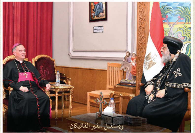
ويستقبل سفير الفاتيكان