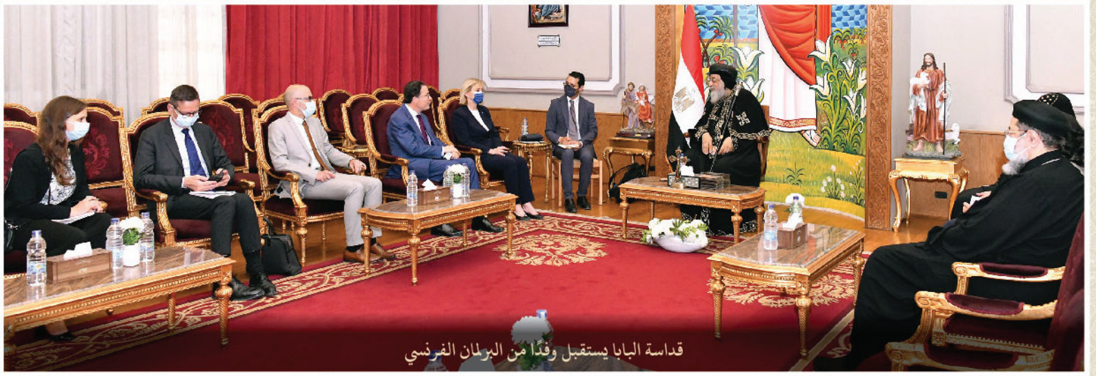
قداسة البابا يستقبل وفدًا من البرلمان الفرنسي