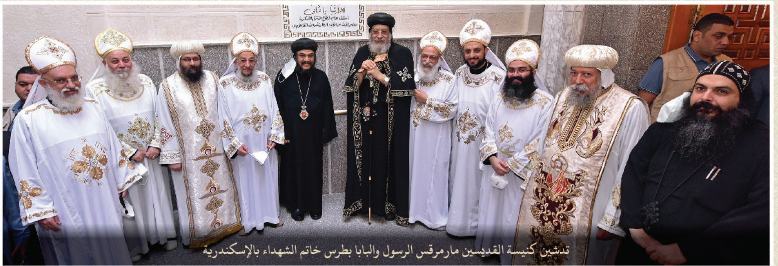
تدشين كنيسة القديسين مارمرقس الرسول والبابا بطرس خاتم الشهداء بالإسكندرية