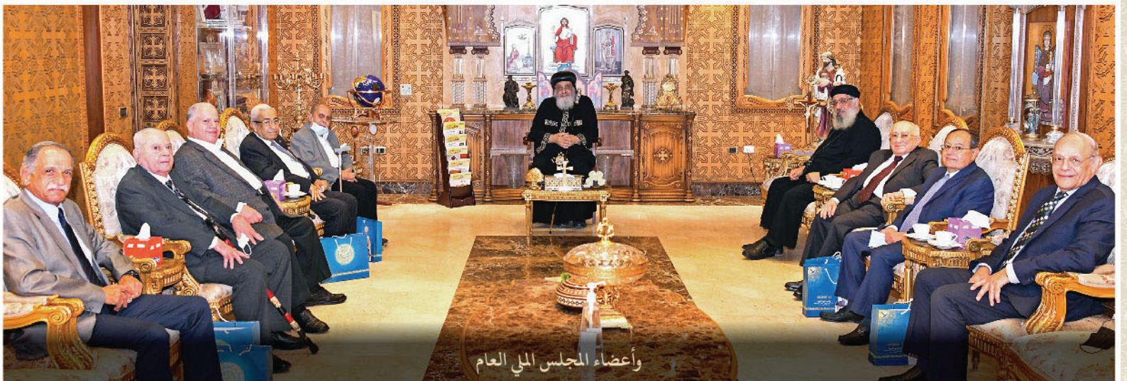
وأعضاء المجلس الملي العام