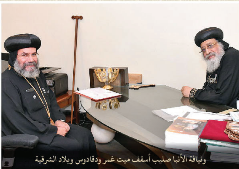
ونيافة الأنبا صليب أسقف ميت غمر ودقادوس وبلاد الشرقية