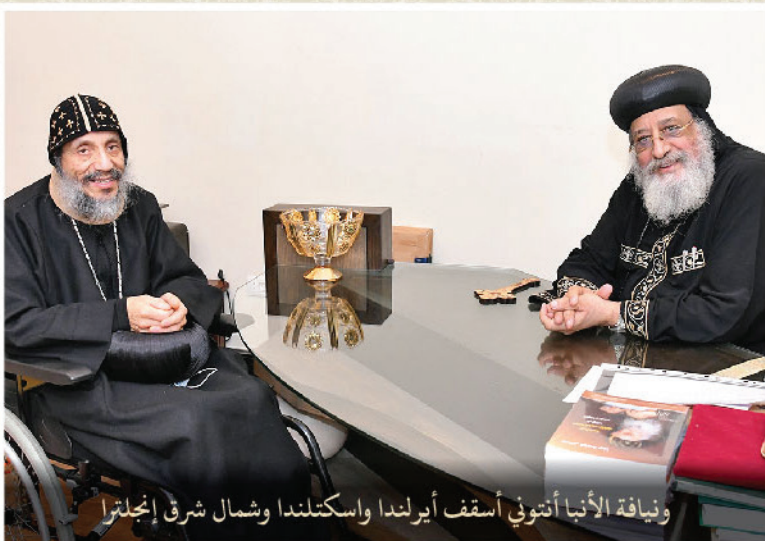
ويناقة الأنبا أنتوني أسقف أيرلندا واسكتلندا وشمال شرق إنجلترا