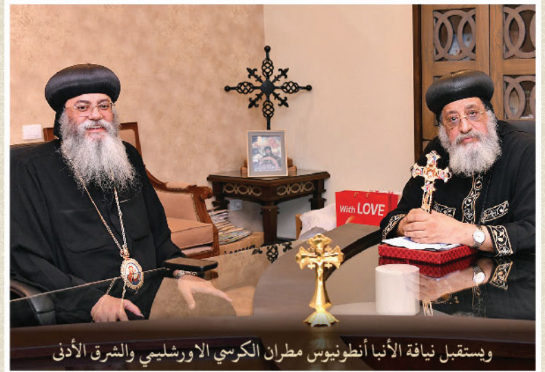
ويستقبل يناقة الأنبا أنطونيوس مطران الكرسي الاورشليمي والشرق الأدنى