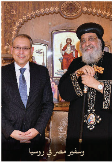
وسفير مصر في روسيا