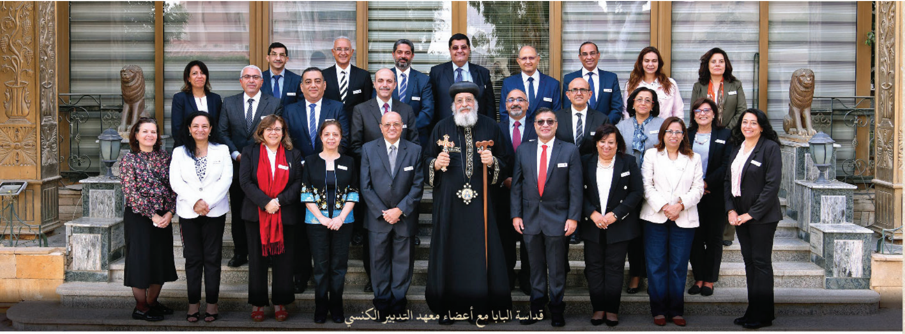
قداسة البابا مع أعضاء معهد التدبير الكنسي