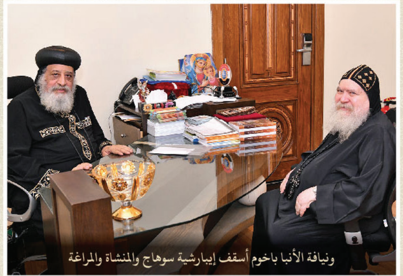
ويناقة الأنبا باخوم أسقف إبارشية سوهاج والمنشأة والمراغة