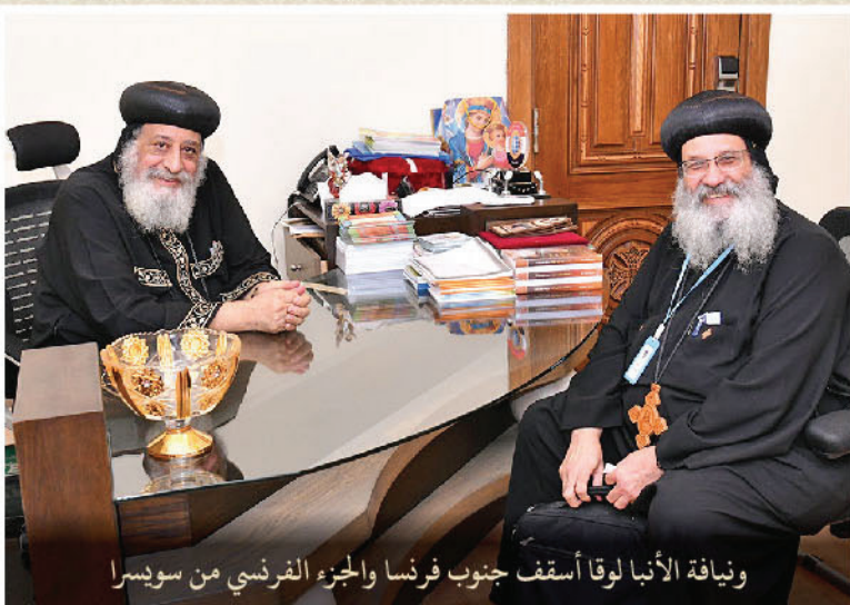
ونيافة الأنبا لوقا أسقف جنوب فرنسا والجزء الفرنسي من سويسرا