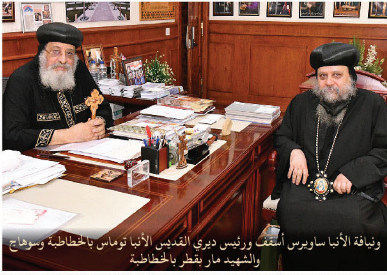
ونيافة الأنبا ساويرس أسقف ورئيس دوري القديس الأنبا توماس بالخطاطبة وسوهاج والشهيد مار بقطر بالخطاطبة