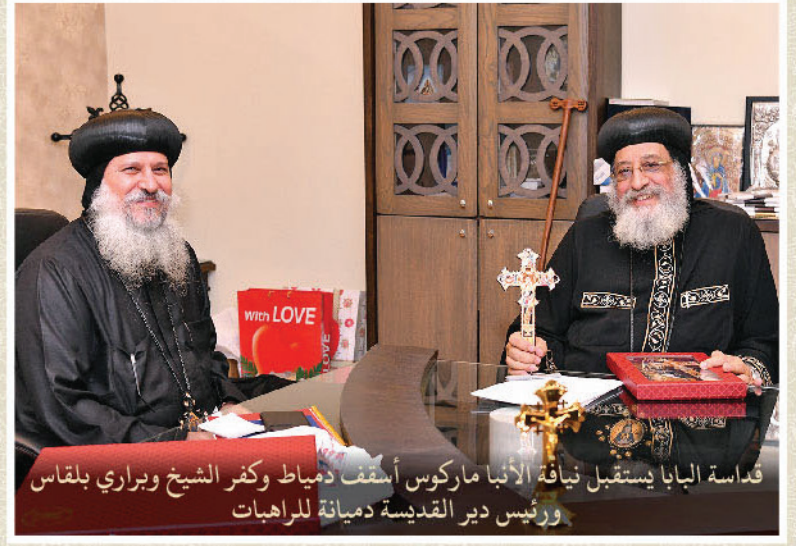
قداسة البابا يستقبل نيافة الأنبا ماركوس أسقف دمياط وكفر الشيخ وبراري بلقاس ورئيس دير القديسة دميانة للراهبات