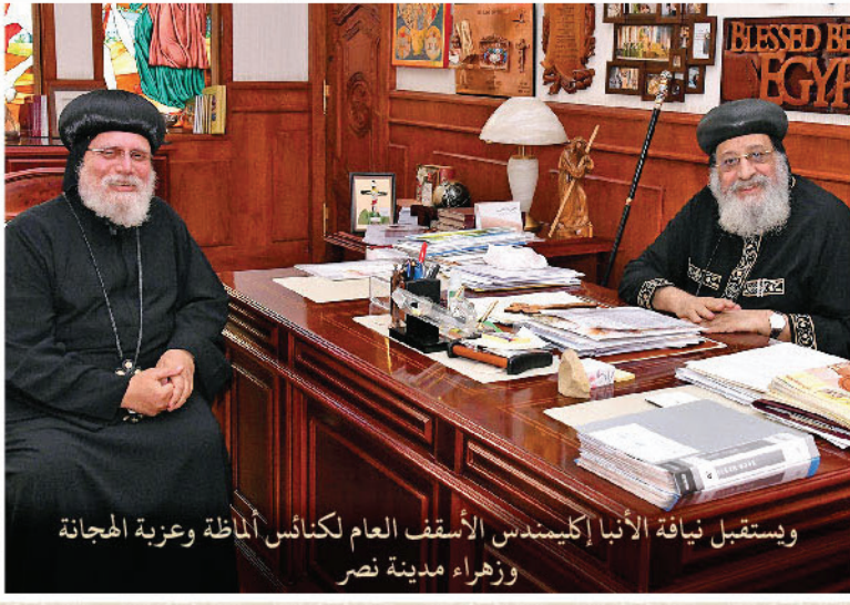
ويستقبل نيافة الأنبا إكليمندس الأسقف العام لكنائس المازة وعزبة الهجانة وزهراء مدينة نصر