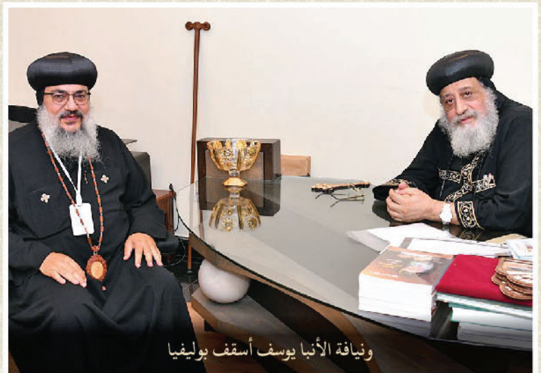
ونيافة الأنبا يوسف أسقف بوليفيا