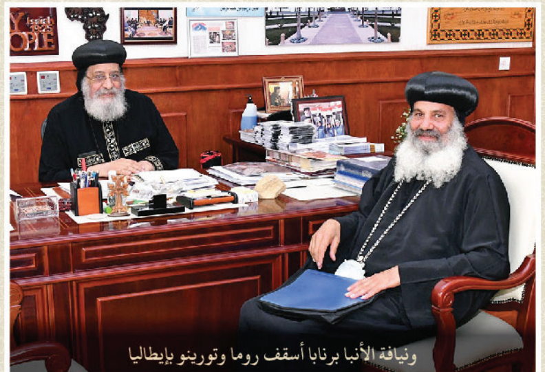
ويناقة الأنبا برنابا أسقف روما وتورينو بإيطاليا