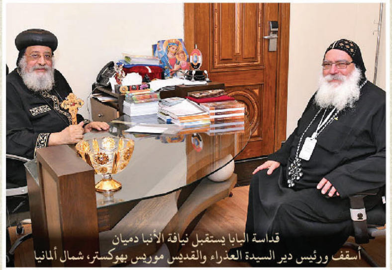
قداسة ابابا يستقبل نيافة الأنبا دميان أسقف ورئيس دير السيدة العذراء والقديس موريس بهوكستر، شمال ألمانيا