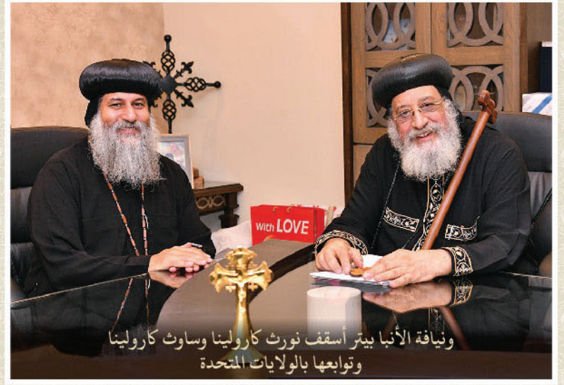
ونيافة الأنبا بيتر أسقف نورث كارولينا وساوث كارولينا وتوايها بالولايات المتحدة