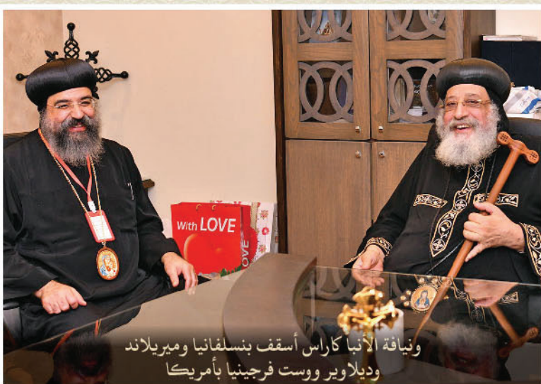
ونيافة الأنبا كاراس أسقف بنسلفانيا وميريلاند وديلوير ووست فرجينيا بأمريكا