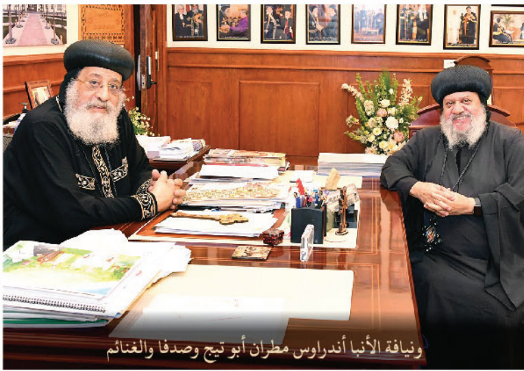
ويناقة الأنبا أندراوس مطران أبو تيج وصدفا والغنائم