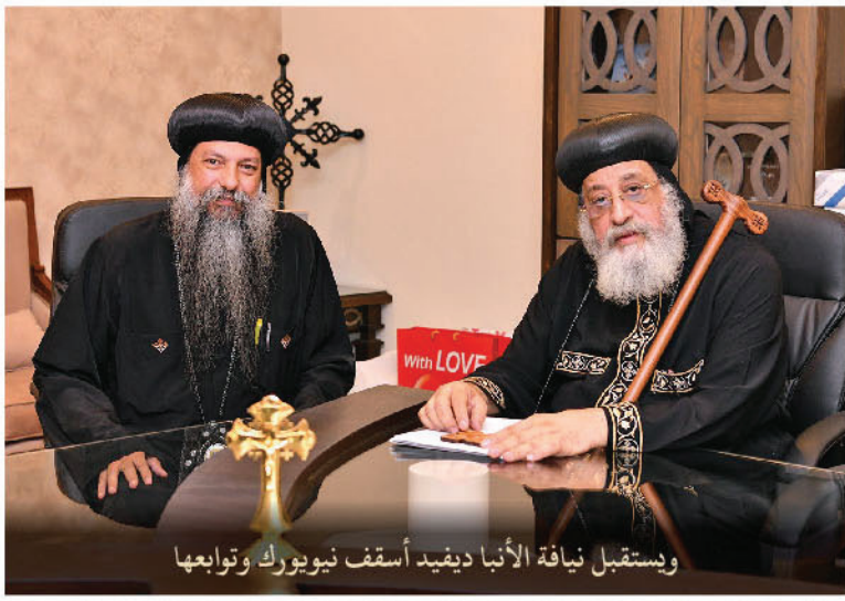
ويستقبل نيافة الأنبا ديفيد أسقف نيويورك وتوابعها