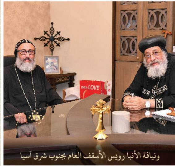
ونيافة الأنبا رويس الأسقف العام بجنوب شرق آسيا