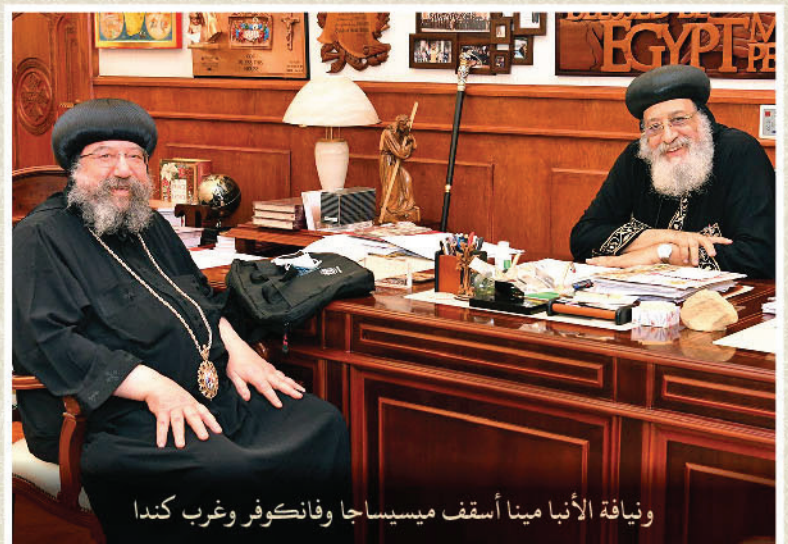
ونيافة الأنبا مينا أسقف ميسيساجا وفانكوفر وغرب كندا