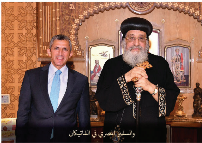
والسفير المصري في الفاتيكان