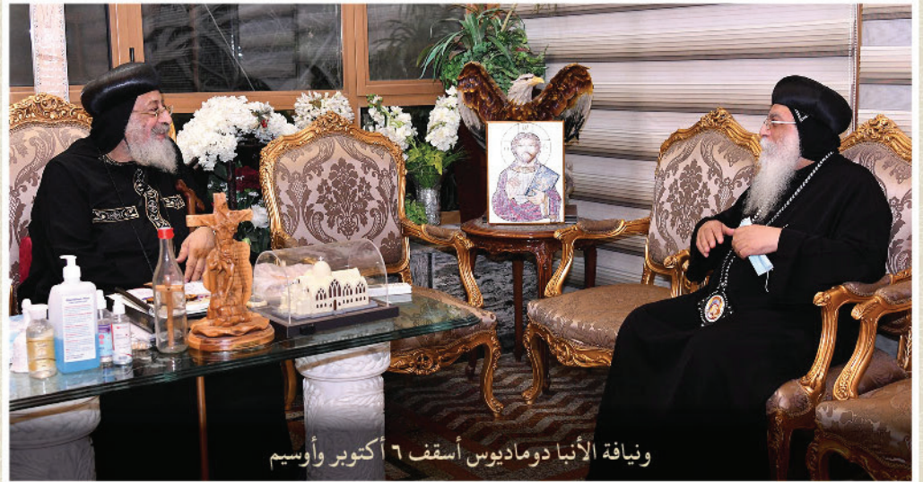
و نيافة الأنا درمادوس أسقف ٦ أكتوبر وأوسيم