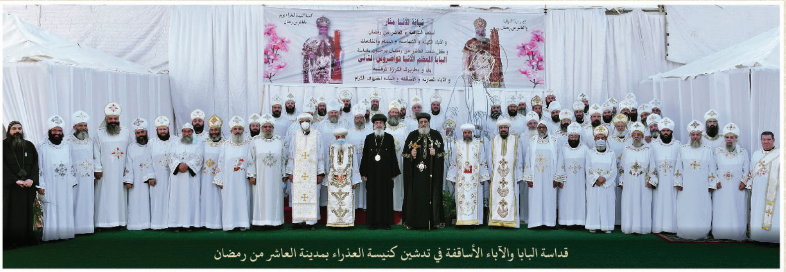
قداسة البابا والآباء الأساقفة في تدشين كنيسة العذراء بمدينة العاشر من رمضان