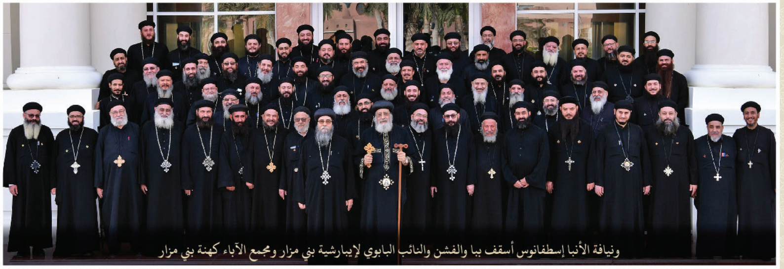
و نيافة الأنا إسطفانوس أسقف ببا والفشن والنائب البابوي لإبارشية بني مزار ومجمع الآباء كهنة بني مزار