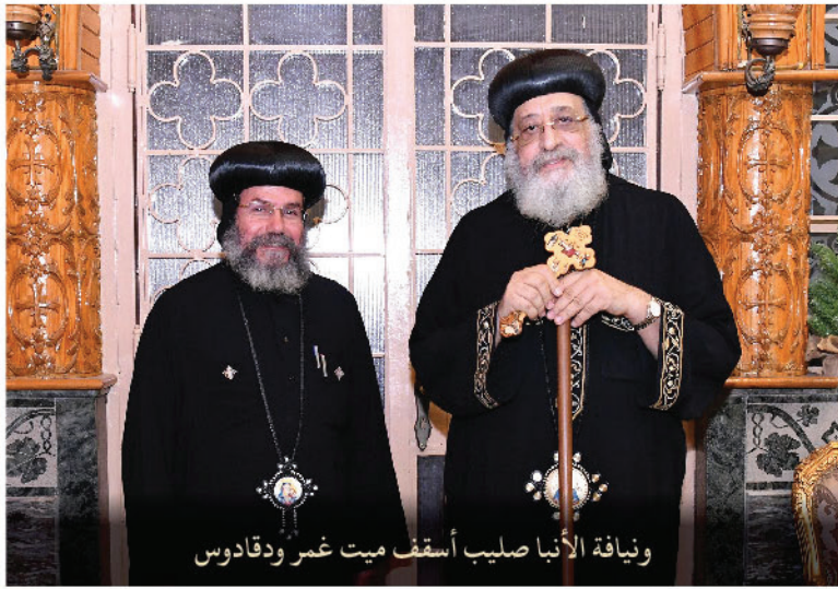
و نيافة الأنا صليب أسقف ميت غمر ودقادوس