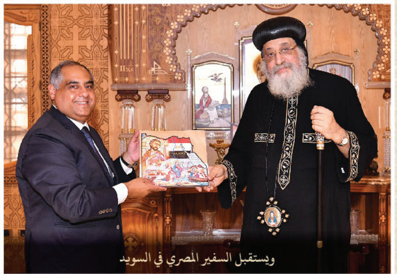
ويستقبل السفير المصري في السويد