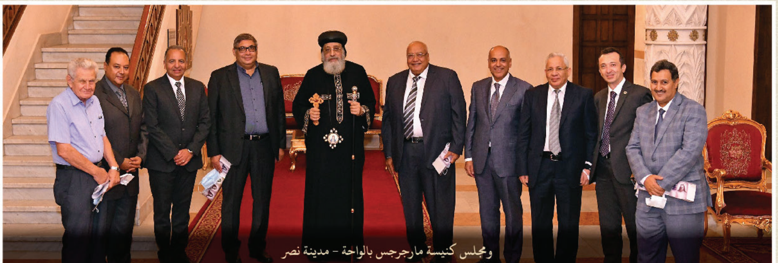
ومجلس كنيسة مارجرس بالواحة - مدينة نصر