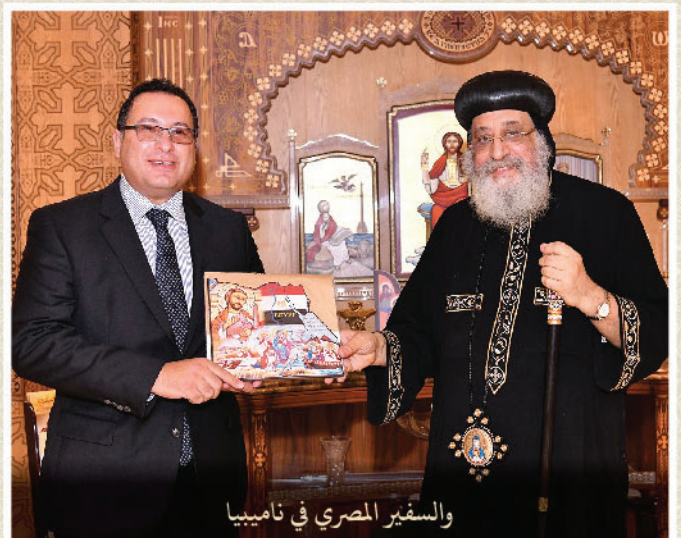
والسفير المصري في ناميبيا