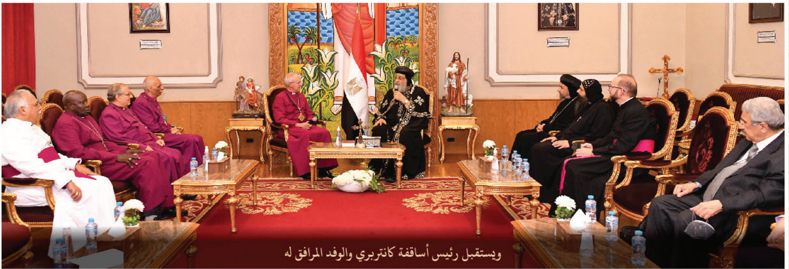
ويستقبل رئيس أساقفة كاتدريري والوفد المرافق له