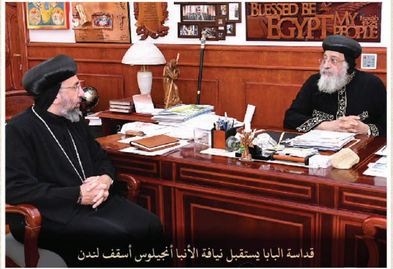
قداسة البابا يستقبل نيافة الأنا أنجيلوس أسقف لندن