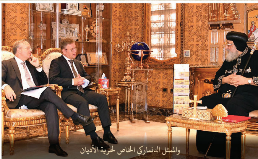
والممثل الدنماركي الخاص لحرية الأديان