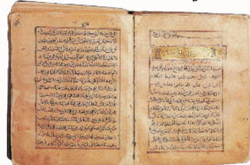
شكل رقم (٤)، مخطوطة «الكتاب المقدس»، مكتبة البطريكية، سنة ١٢٣٤م.

نجد «سفر الخروج» في هذه المخطوطة يبدأ ببسمة «بسم الله الحي الأزلي»، وهي مطابقة لمعنى ومضمون السفر، سفر العبور، عبور بني إسرائيل من الموت للحياة لذا بدأ الناسخ سفر الخروج بـ«بسم الله الحي».