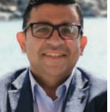
ساح لملت بلازم بأستيفان إسكيب

في التعليم بالتربوية الكنسية، لا بد للخادم أن يدرس صفات