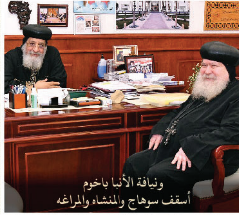
ويناقة الأنبا باخوم أسقف سوهاج والمنشاه والمراغه