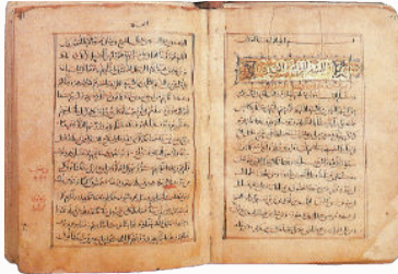
شكل رقم (٥)، مخطوطة «الكتاب المقدس»، مكتبة البطريكية، سنة ١٢٣٤م.

أيضاً في نفس المخطوطة «سفر العدد» تبدأ البسمة بـ«بسم الله الواحد رب القوات»، حيث يبرز هذا السفر عناية الله بشعبه في البرية، يظلمهم كسحابة، وينير لهم ليلاً، ويهتهم بأكلهم وشربهم وراحتهم؛ فهو عرض عمل الله وقوته مع الإنسان كدلالة بسمة بداية السفر «بسم الله الواحد رب القوات».