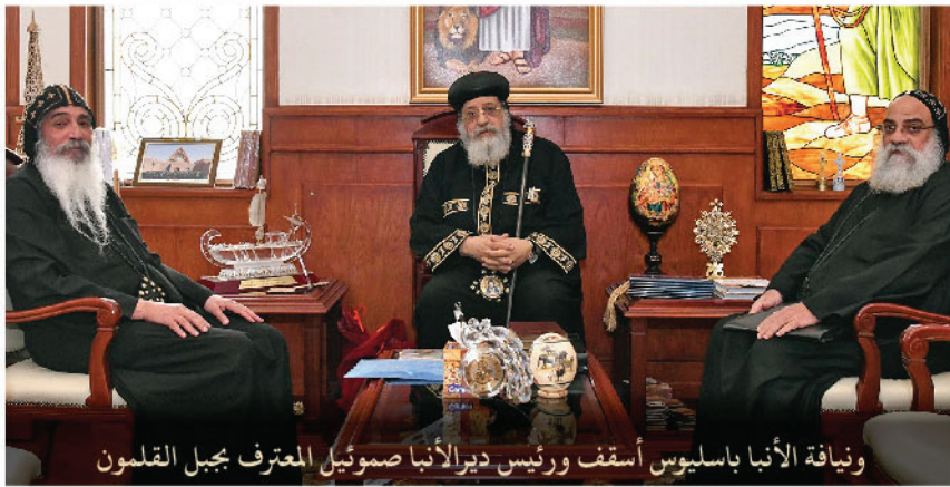
ويناقة الأنبا باسليوس أسقف ورئيس دير الأنبا صموئيل المعترف بجبل القلمون