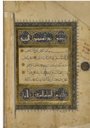
شكل رقم (٢)، مخطوطة «الكتاب المقدس»، المكتبة الوطنية بباريس، قسم المخطوطات الشرقية، رقم ١٢ عربي، سنة ١٠٦٩م، ١٣٥٣م، القرن ١٤.

«بسم الله الخالق الحي الناطق» لقد استوقفتني هذه البسمة لعلاقتها وارتباطها الشديد بالنص، نجدها في مخطوطة الكتاب المقدس مع بداية سفر التكوين الأصحاح الأول، نرى دلالة هذه البسمة تعبر عن مضمون النص الكتابي: «في البدء خلق الله السماء والأرض» (تك ١: ١)، الخالق الله الأب يقابلها في البسمة: «بسم الله الخالق». «وروح الله يهب على المياه» (تك ١: ٢) أي الروح القدس لذا قال «بسم الله الحي»، «وقال الله ليكن نور» (تك ١: ٣) وقال الله دلالة على الله الكلمة يسوع المسيح النور الذي أشرق في الظلمة، دلالتها في البسمة «بسم الله الناطق». فعبر الناسخ عن الثالوث القدوس في عبارة موجزة معبرة أن الله خالق بقدرته، حي بروحه، وناطق بكلمته في ابنه يسوع المسيح، شكل رقم (٢).