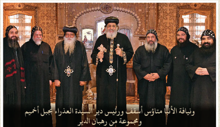
ويناقة الأنبا متاؤس أسقف ورئيس دير السيدة العذراء بجبل أحميم ومجموعة من رهبان الدير