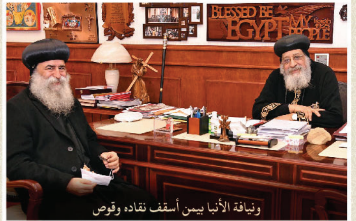
ويناقة الأنبا ييمن أسقف نقاده وقوص