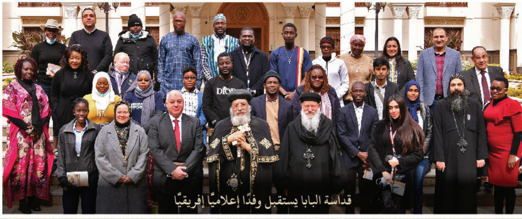
قداسة البابا يستقبل وفدًا إعلاميًا إفريقيًا