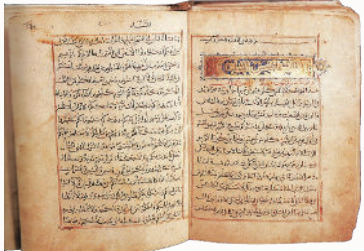
شكل رقم (٦)، مخطوطة «الكتاب المقدس»، مكتبة البطريكية، سنة ١٢٣٤م.

كما نلاحظ في نفس المخطوطة سفر المثناة أي «التثنية»، وهو سفر العهد والحب الإلهي، محور السفر الله خليلي يعطيني وصيته، فهو سفر تذكرة دائمة لوصايا الله. لذلك بدأ الناسخ سفر التثنية بـ«بسم الله الواحد ذي القدرة والجبروت».