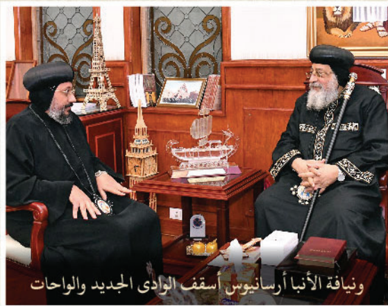
ويناقة الأنبا أرسانيوس أسقف الوادي الجديد والواحات