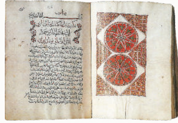
شكل رقم (٣)، مخطوطة «الكتاب المقدس»، المكتبة البطريكية القبطية، سنة ١٤٤٤م، ١٧٢٨م، القرن ١٨م.

إله رؤوف ورحيم بطيء الغضب وكثير الرحمة، ونادم على الشر» (يون ٤: ٢)، شكل رقم (٣).