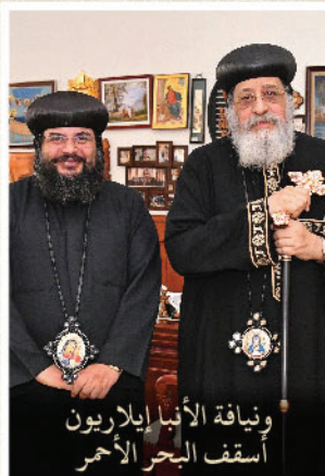
ويناقة الأنبا إيلاريون أسقف البحر الأحمر