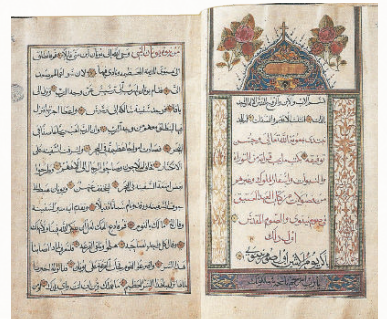
شكل رقم (١)، مخطوطة «دروس من الأنبياء» القبطية، المكتبة البطريكية، سنة ١٥١٧م، القرن ١٨م.

لم يكن الناسخ منفصلاً عن عقيدته، فقد شرح البسمة حتى أثناء كتابة البسمة نفسها، كما هو واضح في نموذج هذه المخطوطة، مخطوطة «دروس من الأنبياء»، شكل رقم (١).