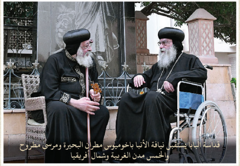
قداسة البابا يستقبل نيافة الأنبا باخوميوس مطران البحيرة ومرسى مطروح والخمس مدن الغربية وشمال أفريقيا