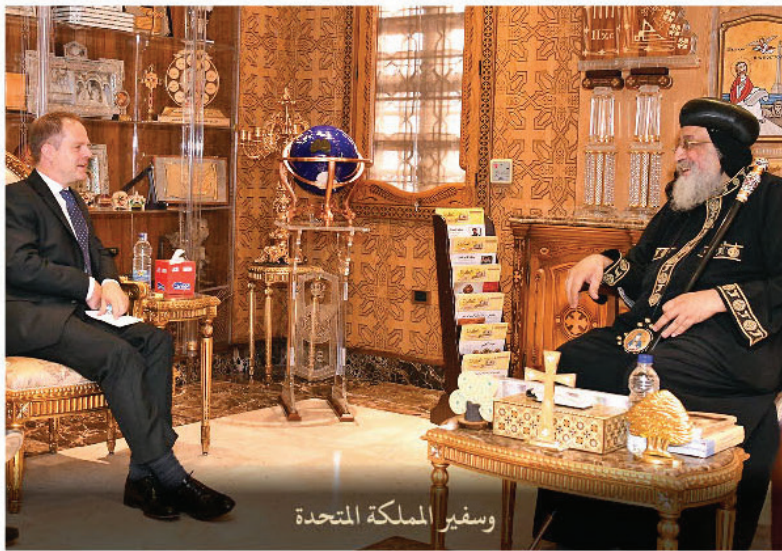
وسفير المملكة المتحدة