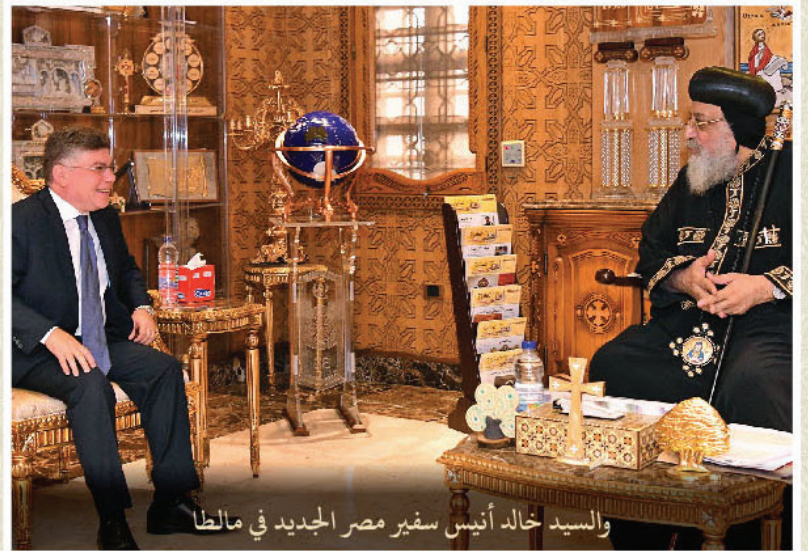
والسيد خالد أنيس سفير مصر الجديد في مالطا