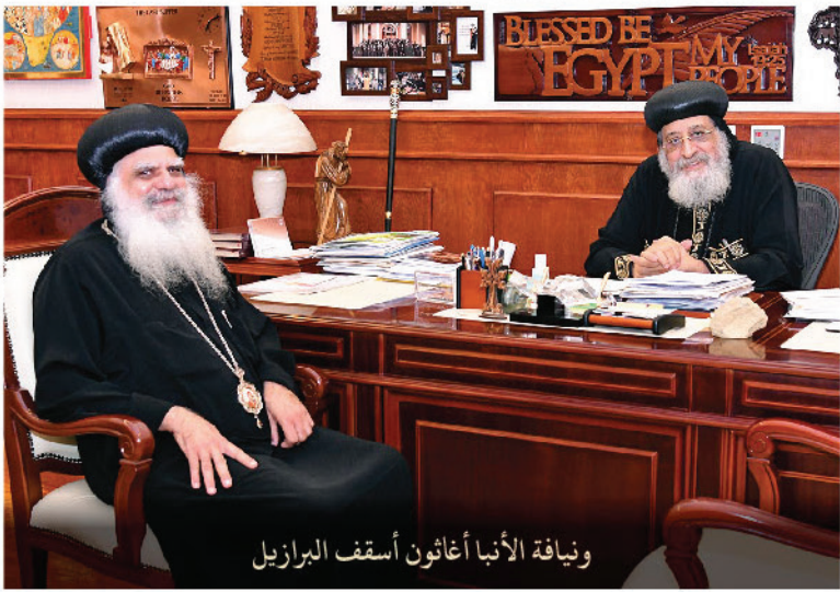
ونيافة الأنبا أغاثون أسقف البرازيل