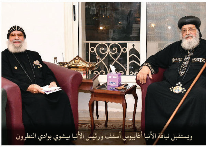
وإستقبل نيافة الأنبا أغابوس أسقف ورئيس الأنبا بيشوي بوادي النطرون