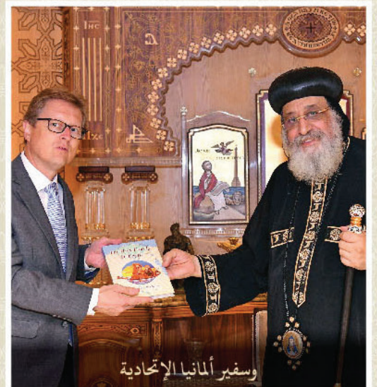
وسفير ألمانيا الاتحادية