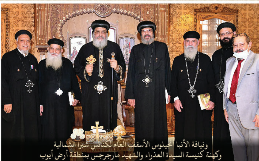
ونيافة الأنبا جيلوس الأسقف العام لكنائس شرقا الشمالية وكنيسة السيدة العذراء والشهيد مارجرجس بمنطقة أرض أيوب