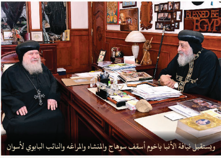
ويستقبل نيافة الأنبا باخوم أسقف سوهاج والمنشا والمراغه والنائب البابوي لأسوان