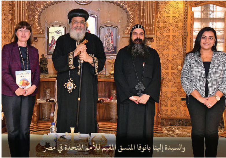
والسيدة إينا بانوفا المنسق المقيم للأمم المتحدة في مصر