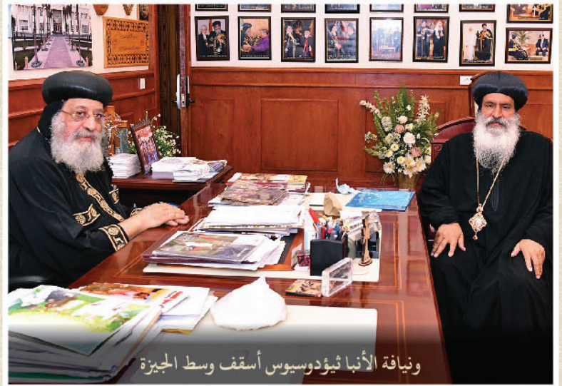
ونيافة الأنبا ثيودوسيوس أسقف وسط الجيزة