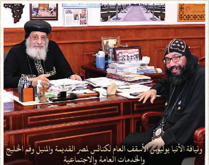
ونيافة الأنبا يوليوس الأسقف العام لكنائس مصر القديمة والمنيل وفم الخليج والخدمات العامة والاجتماعية