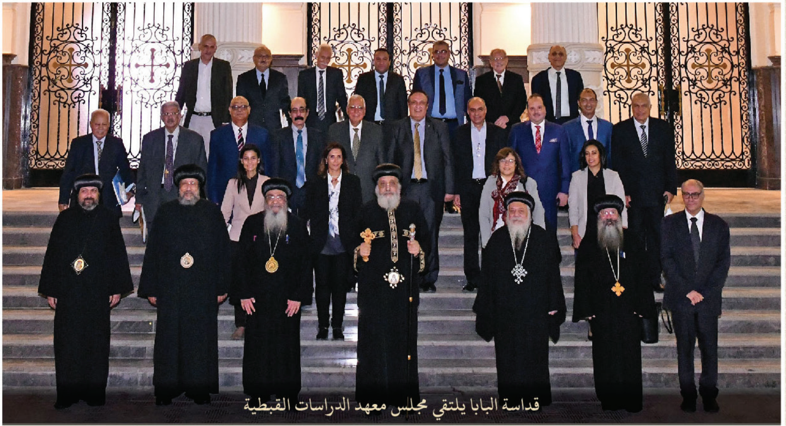
قداسة البابا يلتقي مجلس معهد الدراسات القبطية