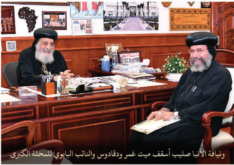
ونيافة الأنبا صليب أسقف ميت غمر ودقادوس والنائب البابوي للمحلة الكبرى