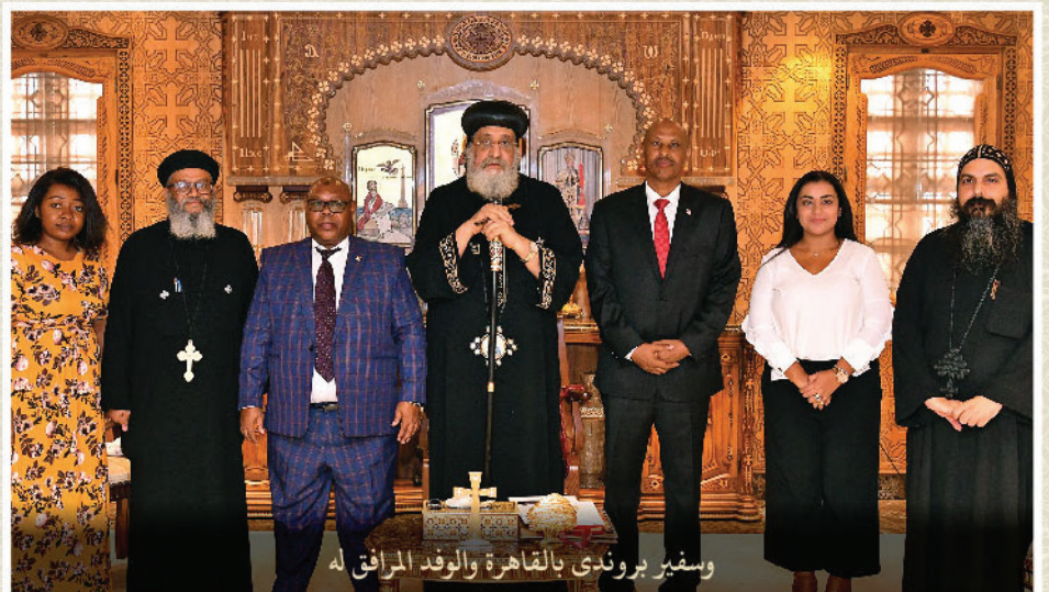
وسفير بروندي بالقاهرة والوفد المرافق له