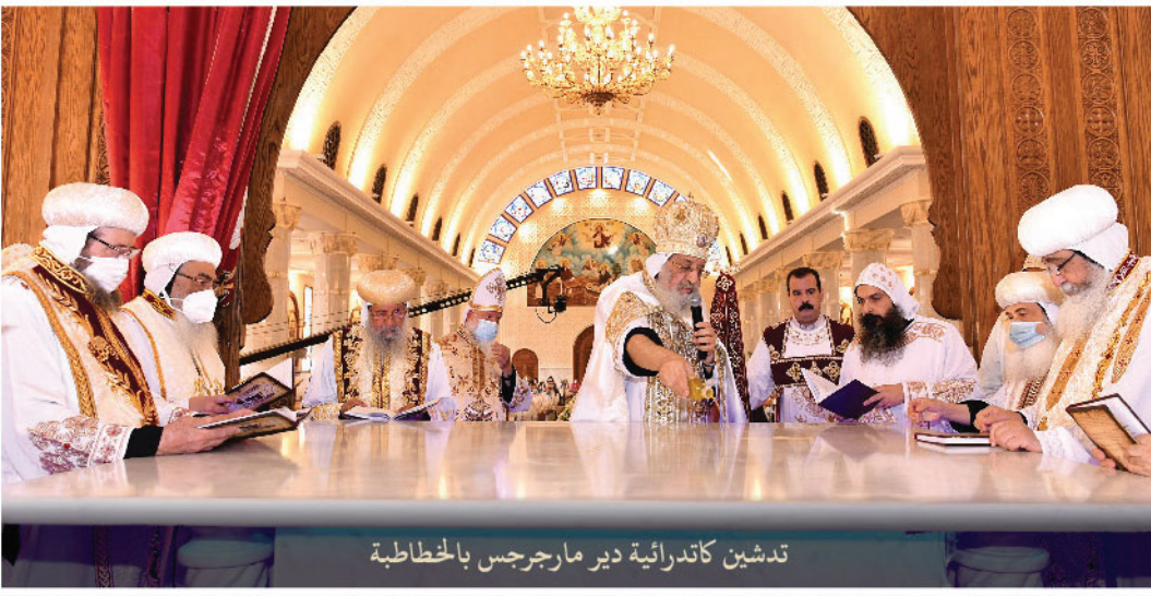
تدشين كاتدرائية دير مارجرس بالخطاطبة