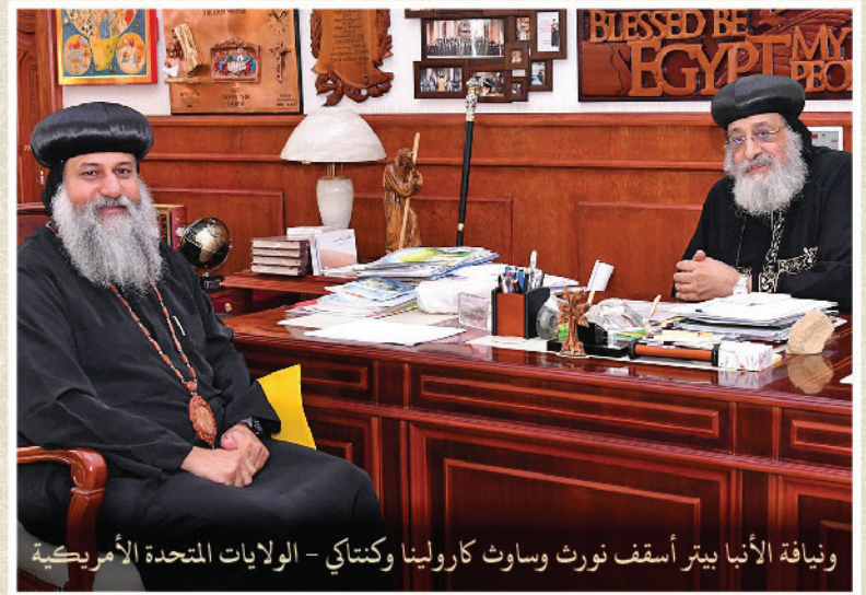
ونيافة الأنبا بيتر أسقف نورث وساوث كارولينا وكنتاكي - الولايات المتحدة الأمريكية