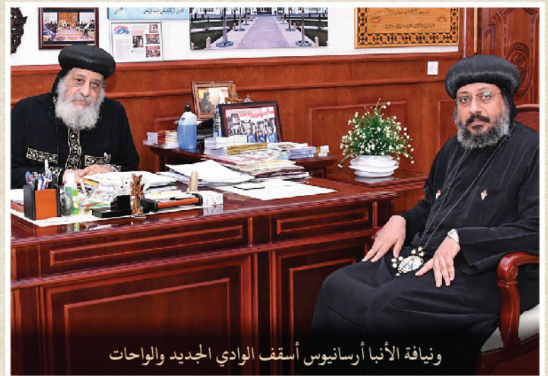
ونيافة الأنبا أرسانيوس أسقف الوادي الجديد والواحات