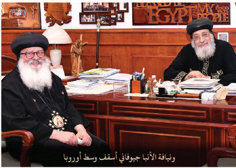
ونيافة الأنبا جيوفاني أسقف وسط أوروبا