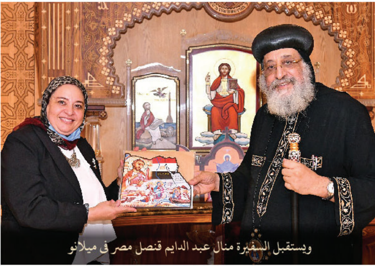
وإستقبال السفارة منال عبد الدايم قنصل مصر في ميلانو