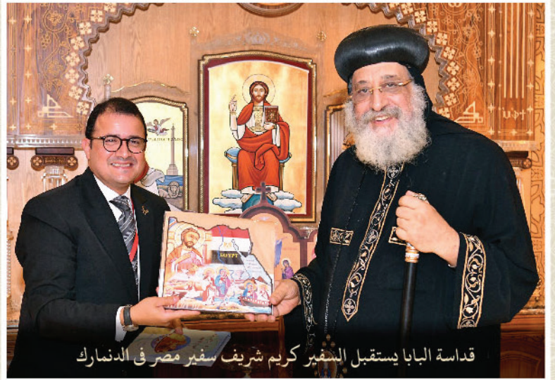
قداسة البابا إستقبال السفير كريم شريف سفير مصر في الدنمارك