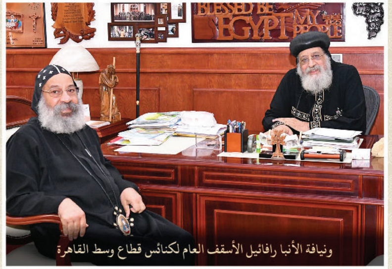
ونيافة الأنبا رافائيل الأسقف العام لكنائس قطاع وسط القاهرة