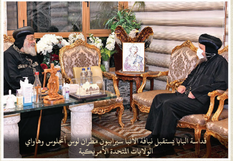
قداسة البابا إستقبل نيافة الأنبا سيرايبون مطران لوس أنجلوس وهاواي الولايات المتحدة الأمريكية