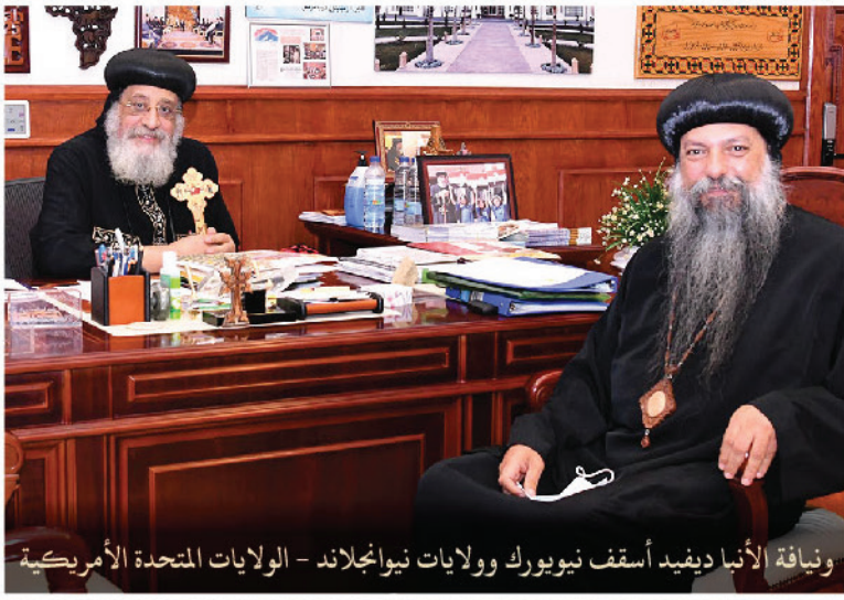
ونيافة الأنبا ديفيد أسقف نيويورك وولايات نيوانجلاند - الولايات المتحدة الأمريكية