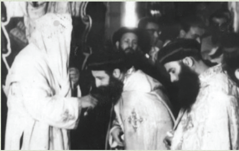
سيامة الأنبا صموئيل بيد البابا كيرلس السادس

ومن الجدير بالذكر أن أسقفية الخدمات تأسست بيد القديس البابا كيرلس السادس، الذي سام أول أسقف لها وهو الممتيح نيافة الأنبا صموئيل في ٣٠ سبتمبر ١٩٦٢، والذي تتيح في ٦ أكتوبر ١٩٨١