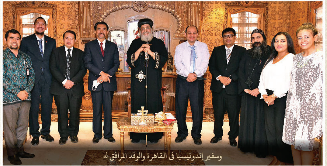
وسفير إندونيسيا في القاهرة والوفد المرافق له