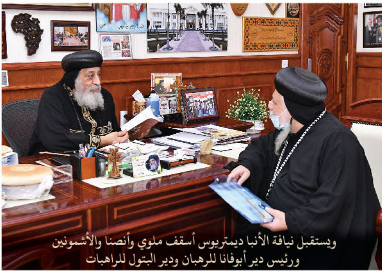
وإستقبل نيافة الأنبا ديمتريوس أسقف ملوي وأنصنا والأشمونين ورئيس دير أبوفانا للرهبان ودير البتول للراهبات