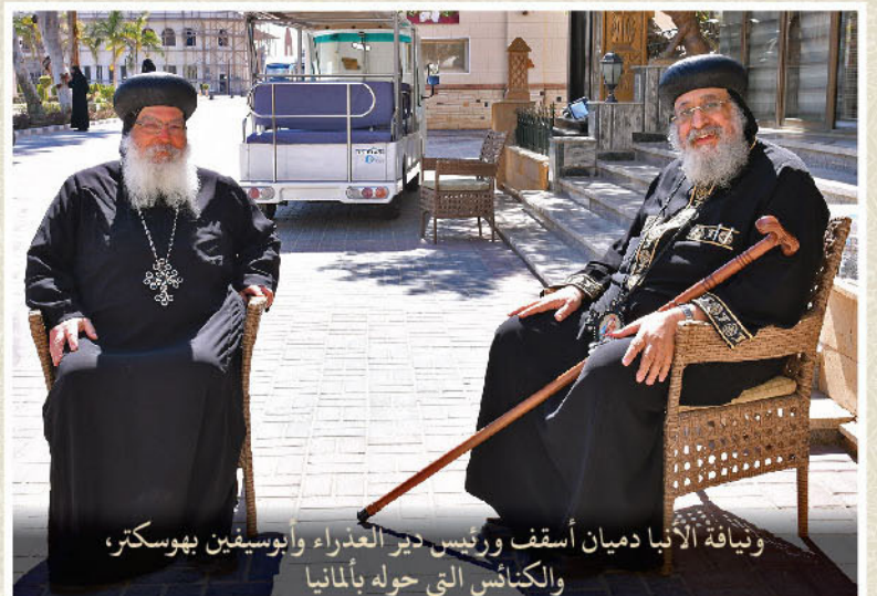
ونيافة الأنبا دميان أسقف ورئيس دير العذراء وأبوسيفين بهوسكتر، والكنائس التي حوله بألمانيا