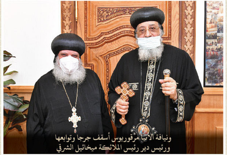
ويناية الأنبا مرقوريوس أسقف جرجا وتوابعها ورئيس دير رئيس الملائكة ميخائيل الشرقي