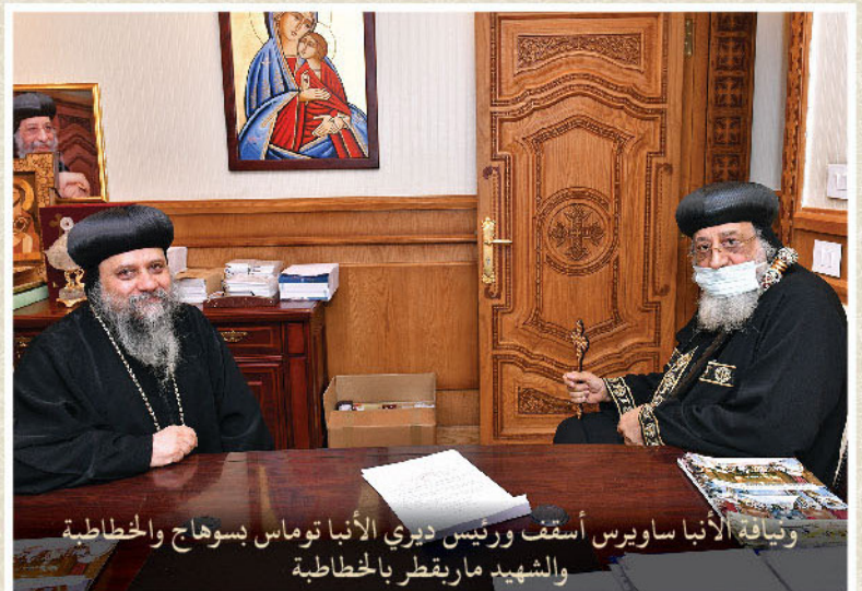
ويناية الأنبا ساويرس أسقف ورئيس ديرى الأنبا توماس بسوهاج والخطاطبة والشهيد ماريقتر بالخطاطبة