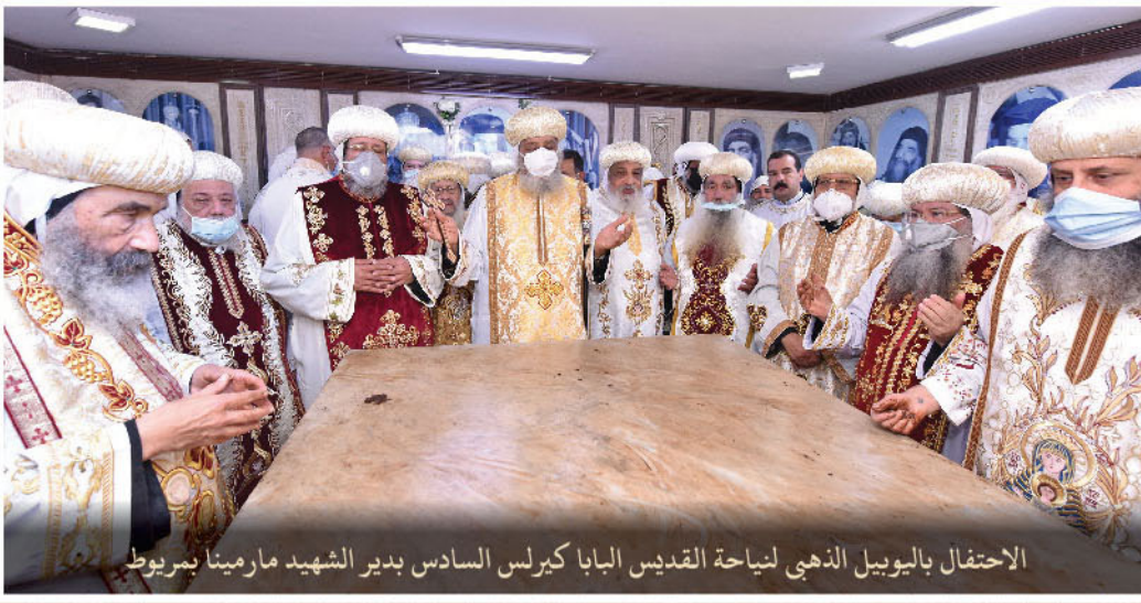
الاحتفال باليوبيل الذهبي لنياحة القديس البابا كيرلس السادس بدير الشهيد مارمينا بمريوط