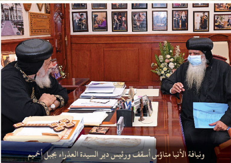
ويناية الأنبا متاؤس أسقف ورئيس دير السيدة العذراء بجبل أحميم