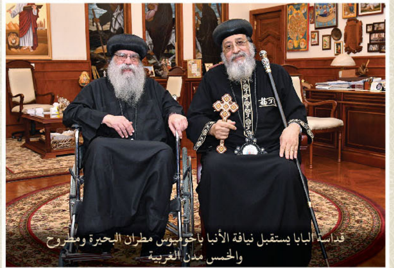
قداسة البابا إستقبل نيافة الأنبا باخوميوس مطران البحيرة ومطروح والخمس مدن الغربية