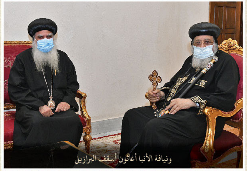
ويناية الأنبا أغاثون أسقف البرازيل