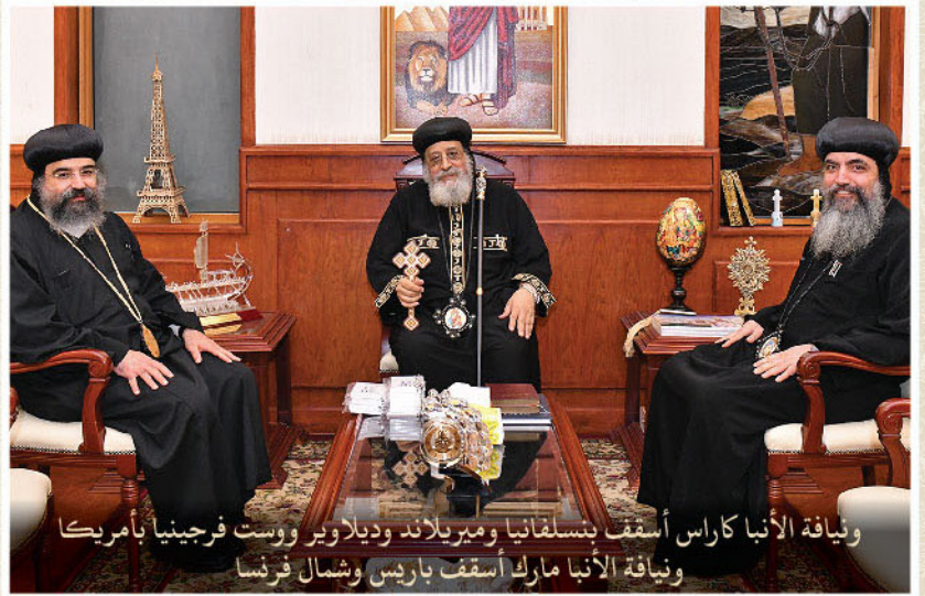
ويناية الأنبا كاراس أسقف بنسلفانيا وميريلاند وديلاوير وست فرجينيا بأمريكا ويناية الأنبا مارك أسقف باريس وشمال فرنسا