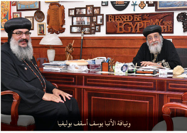
ويناية الأنبا يوسف أسقف بوليفيا