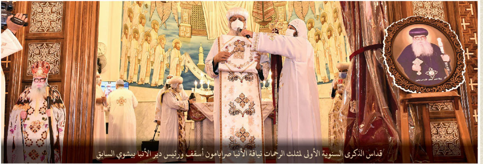
قداس الذكرى السنوية الأولى لمثلث الرحمات نيافة الأنبا صرابامون أسقف ورئيس دير الأنبا بيشوي السابق