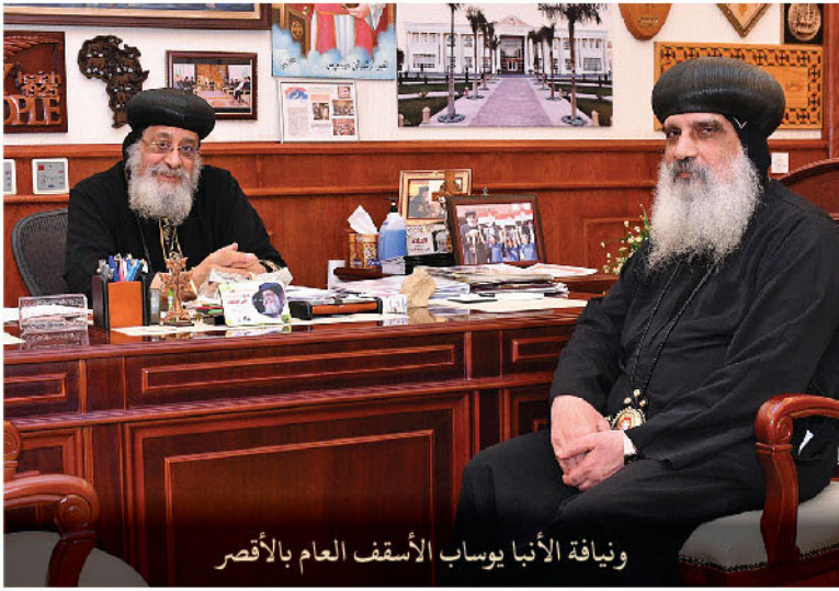
ويناية الأنبا يوساب الأسقف العام بالأقصر