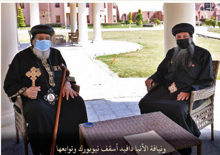
ونيافة الأنبا دافيد أسقف نيويورك وتابعها