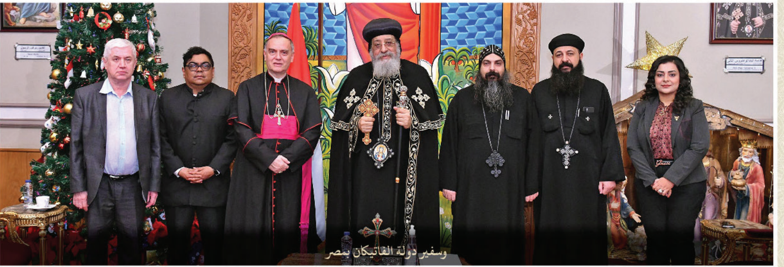
وسفير دولة الفاتيكان بمصر