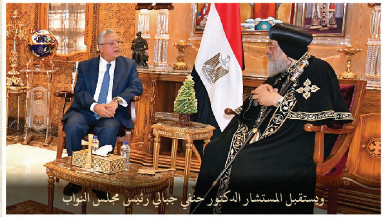
ويستقبل المستشار الدكتور حنفي جبالي رئيس مجلس النواب