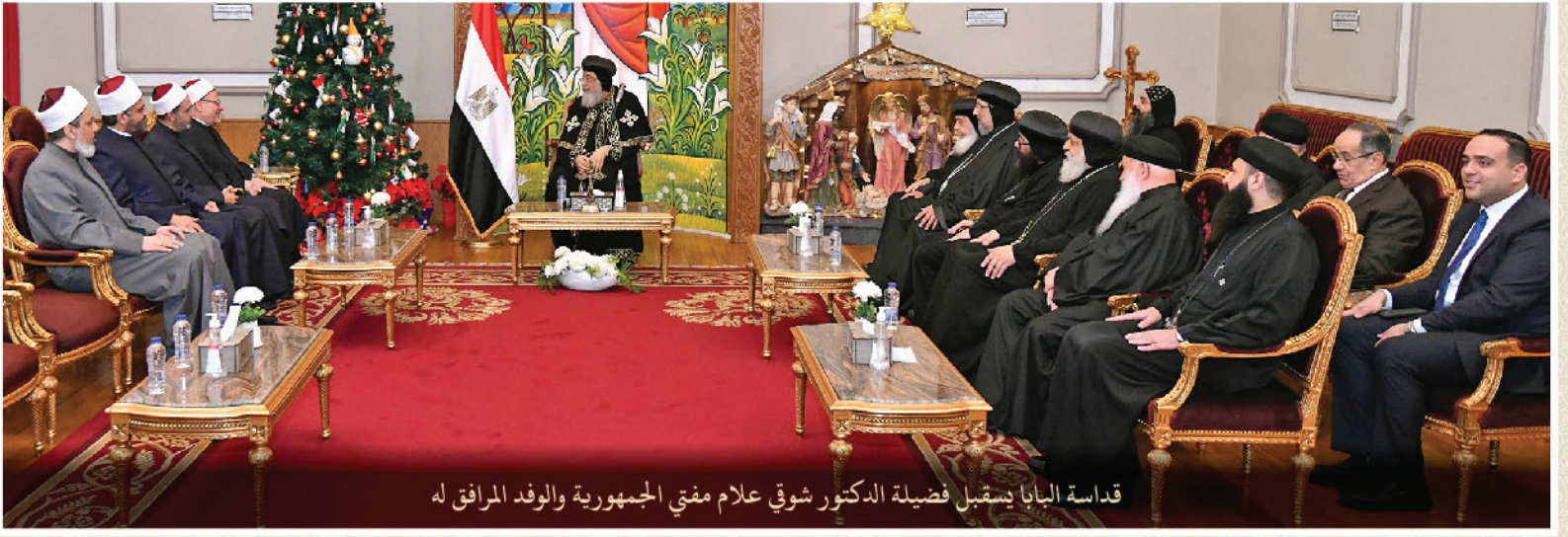
قداسة البابا يستقبل فضيلة الدكتور شوقي علام مفتي الجمهورية والوفد المرافق له