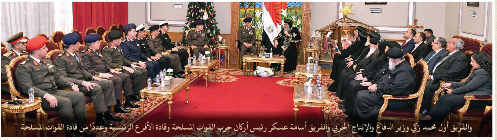
والفریق أول محمد زکی وزیر الدفاع والإنتاج الحربي والفریق أسامة عسکر رئیس أركان حرب القوات المسلحة وقادة الأفرع الرئيسية وعددًا من قادة القوات المسلحة