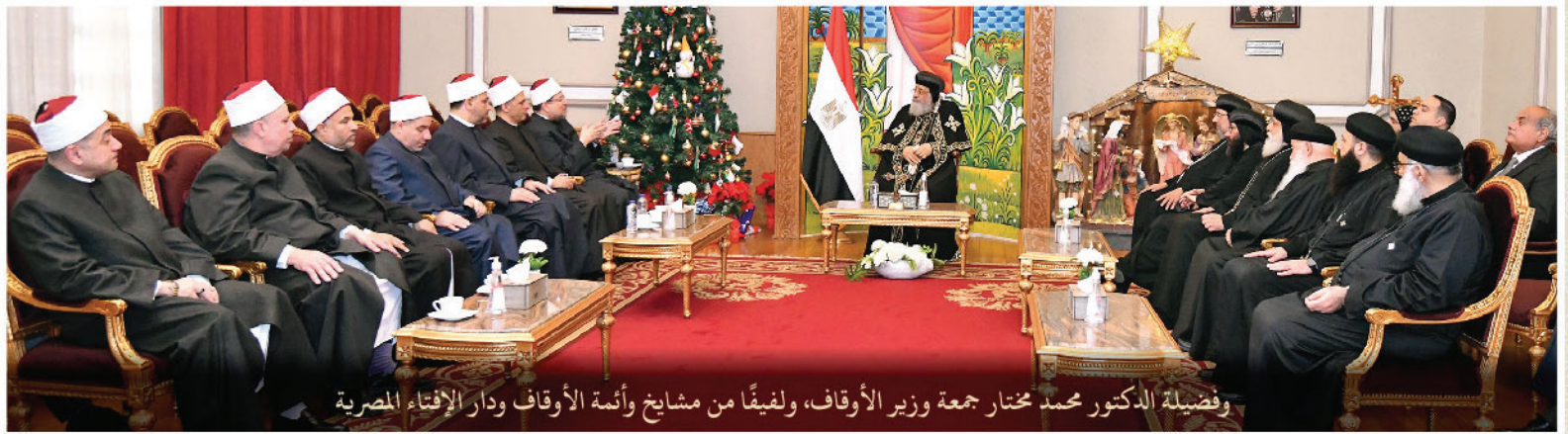
وفضيلة الدكتور محمد مختار جمعة وزیر الأوقاف، ولفیقًا من مشایخ وأئمة الأوقاف ودار الإفتاء المصرية