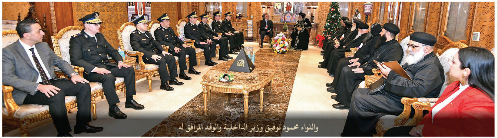
واللواء محمود توفیق وزیر الداخلية والوفد المرافق له