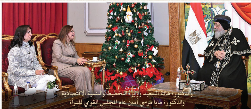
والدكتورة هالة السعيد وزیرة التخطيط والتنمية الاقتصادية والدكتورة مايا مرسي أمين عام المجلس القومي للمرأة