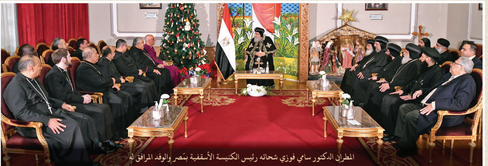
المطران الدكتور سامي فوزي شحاته رئيس الكنيسة الأسقفية بمصر والوفد المرافق له