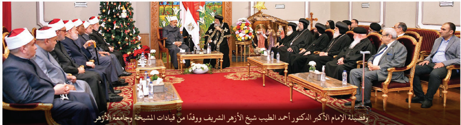
وفضيلة الإمام الأكبر الدكتور أحمد الطيب شيخ الأزهر الشريف ووفدًا من قيادات المشيخة وجامعة الأزهر