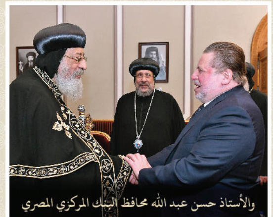
والأستاذ حسن عبد الله محافظ البنك المركزي المصري