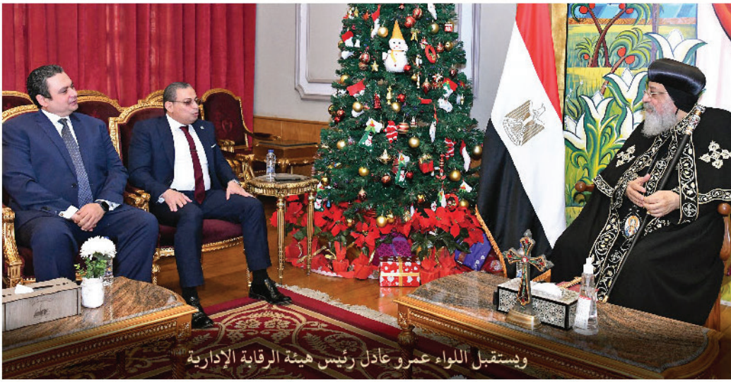
و يستقبل اللواء عمرو عادل رئيس هيئة الرقابة الإدارية