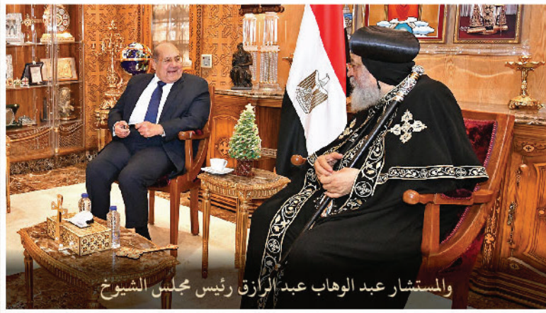
المستشار عبد الوهاب عبد الرازق رئيس مجلس الشيوخ