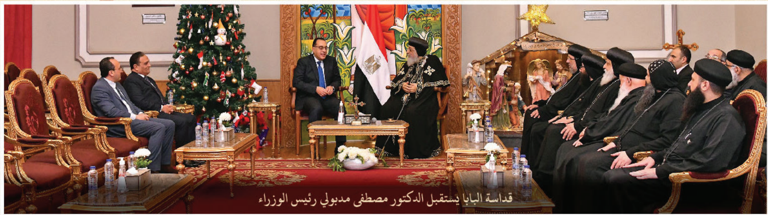
قداسة البابا يستقبل الدكتور مصطفى مدبولي رئيس الوزراء