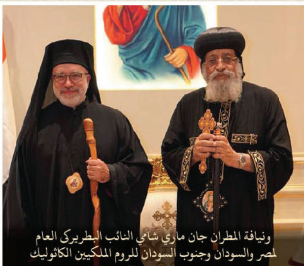
وإيافة المطران جان ماري شامي النائب البطريركي العام لمصر والسودان وجنوب السودان للروم الملكيين الكاثوليك