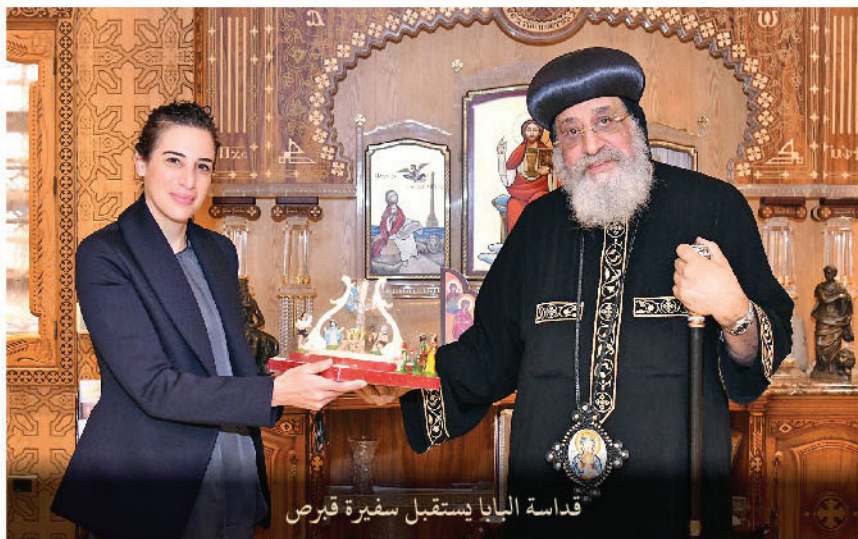
قداسة البابا إستقبال سفيرة قبرص