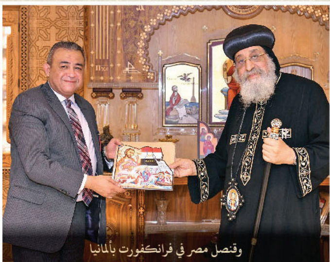
وقنصل مصر في فرانكفورت بألمانيا