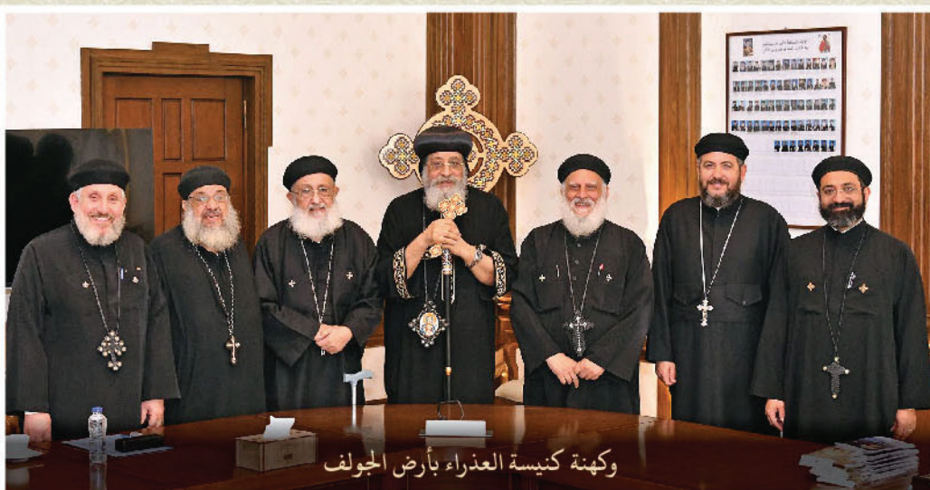
وكهنة كنيسة العذراء بأرض الجولف