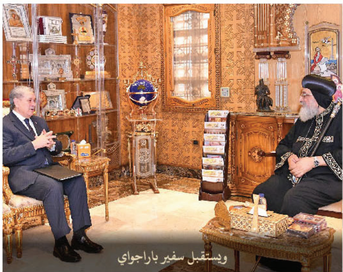
وإستقبال سفير باراجواي