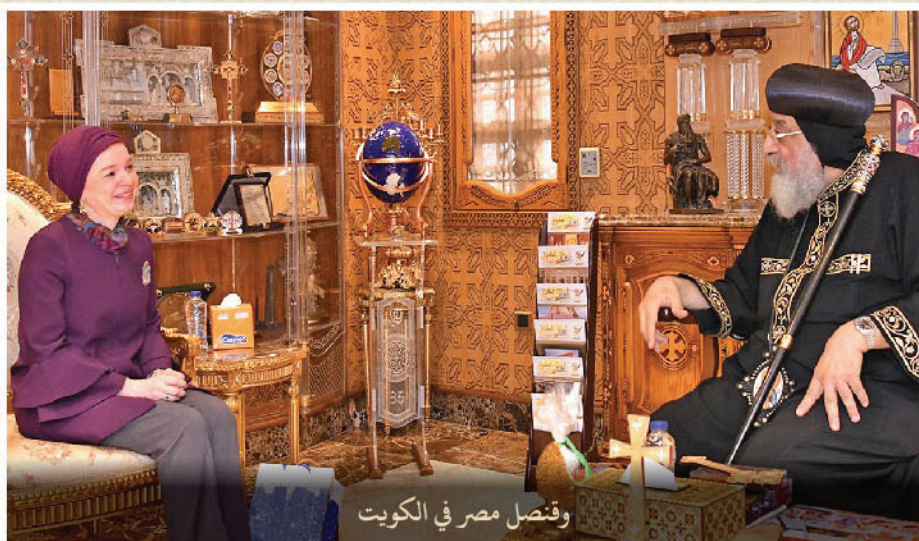
وقنصل مصر في الكويت