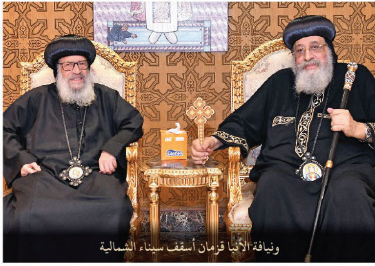
ويناقة الأنبا قزمان أسقف سيناء الشمالية