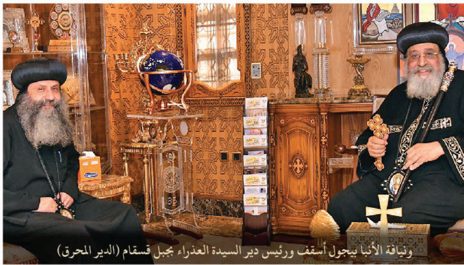
ويناقة الأنبا ييجول أسقف ورئيس دير السيدة العذراء مجبل قسقام (الدير المحرق)