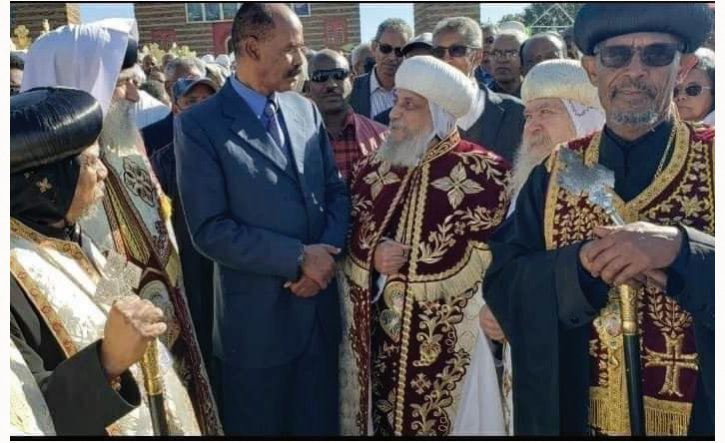
الرئيس الإريترى مع نياحة الأنبا توماس أثناء جناز البطريرك