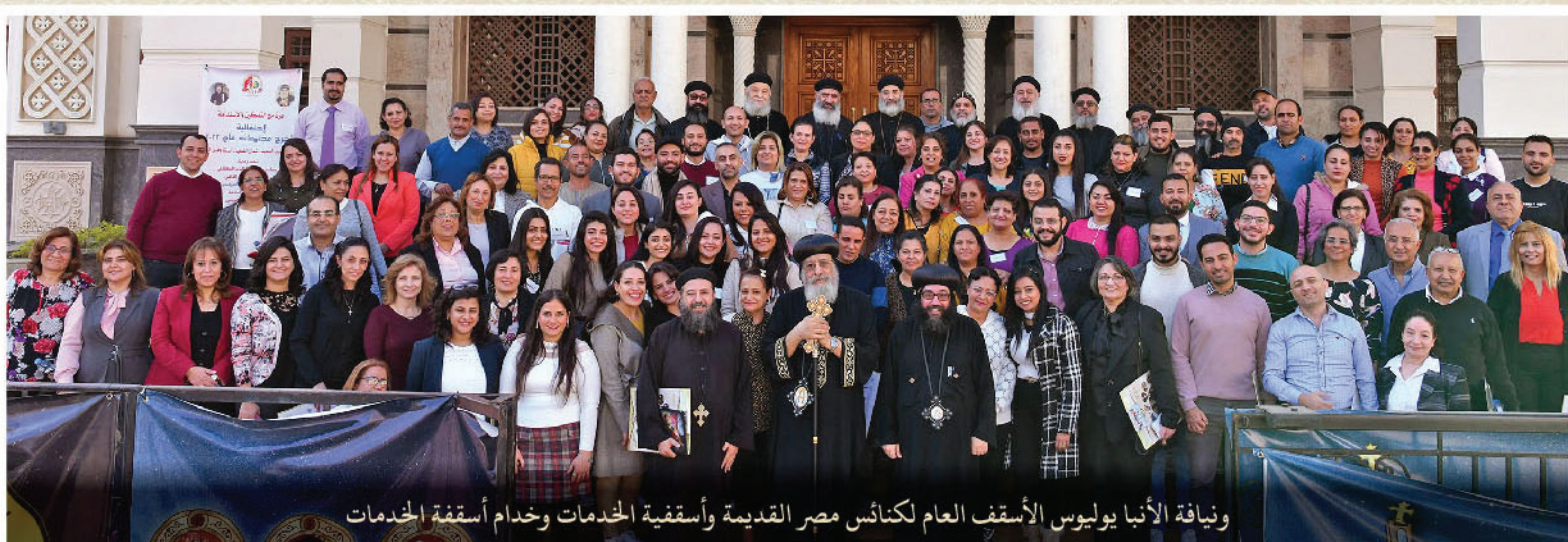
وإيافة الأنبا يوليوس الأسقف العام لكنائس مصر القديمة وأسقفية الخدمات وخدام أسقفية الخدمات