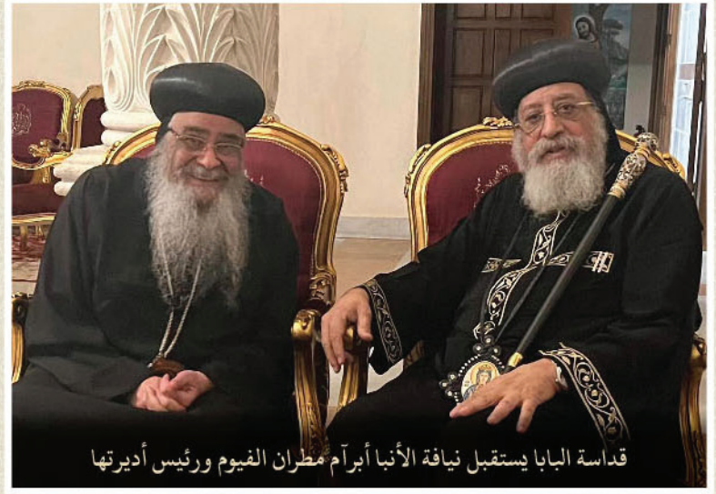
قداسة البابا يستقبل نيافة الأنبا أبرام مطران الفيوم ورئيس أديرتها