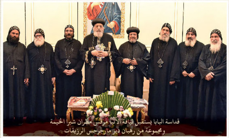
قداسة البابا يستقبل وفياة الأنبا مرقس مطران شبرا الخيمة ومجموعة من رهبان دير مار جرجس الرزيقات