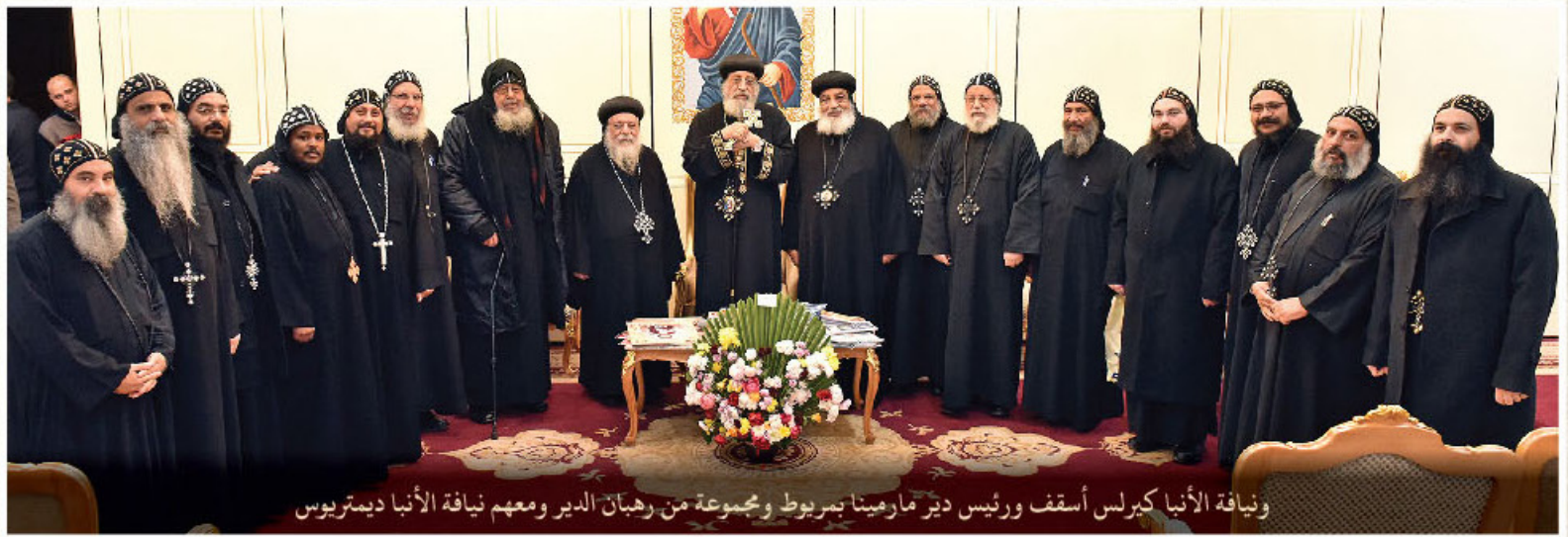
وفياة الأنبا كيرلس أسقف ورئيس دير مار ميخائيل بمربوط ومجموعة من رهبان الدير ومعهم وفياة الأنبا ديمتريوس