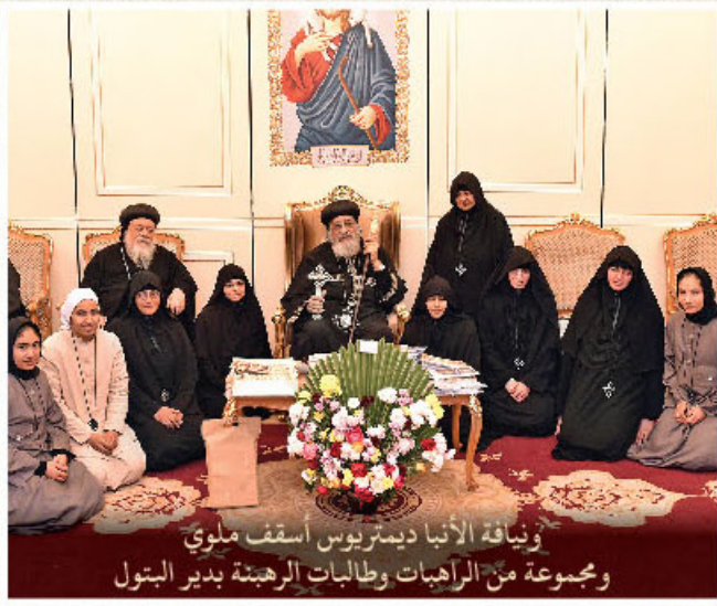
وفياة الأنبا ديمتريوس أسقف ملوي ومجموعة من الرهبان وطالبات الرهبنة بدير البتول