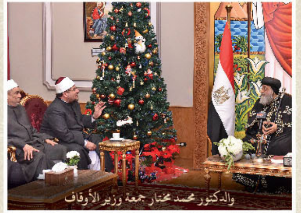
والدكتور محمد مختار جمعة وزير الأوقاف