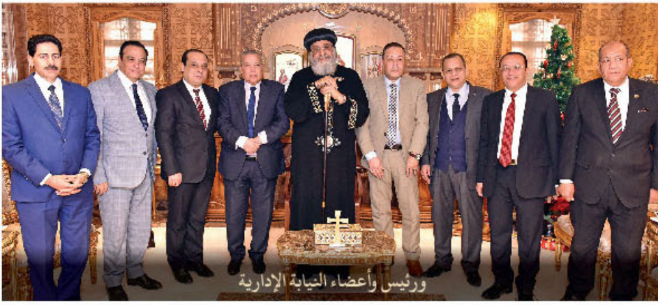
ورئيس وأعضاء النيابة الإدارية