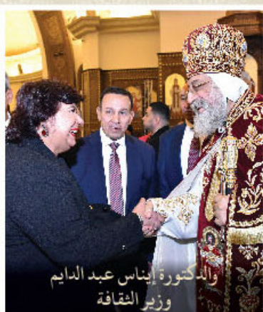
والدكتورة إيناس عبد الدايم ووزير الثقافة