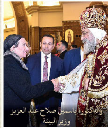
والدكتورة ياسمين صلاح عبد العزيز وزير البيئة