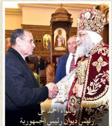
والواء أحمد علي رئيس ديوان رئيس الجمهورية