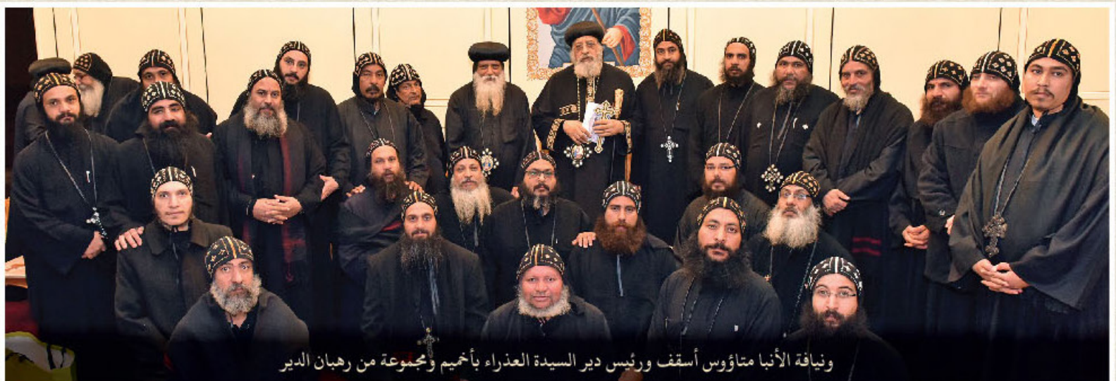
وفياة الأنبا متاؤوس أسقف ورئيس دير السيدة العذراء بأخميم ومجموعة من رهبان الدير