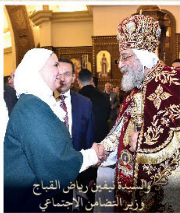
والسيدتين نيفين رياض القباج ووزير التضامن الاجتماعي