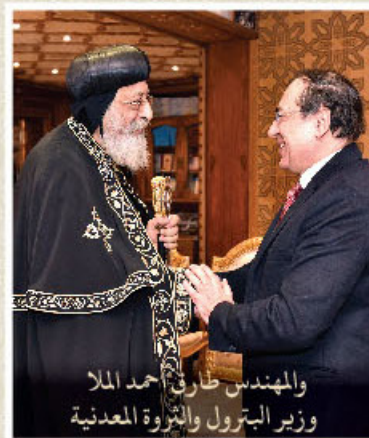
والمهندس طارق أحمد الملا ووزير البترول والثروة المعدنية