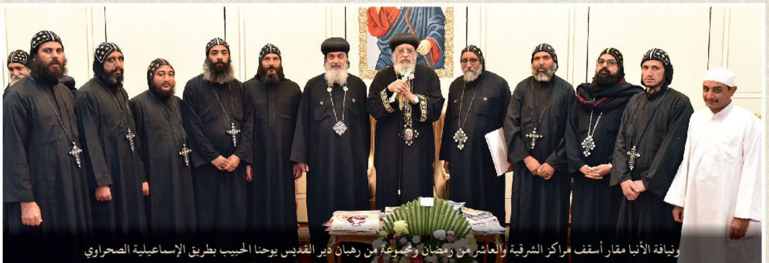
وفياة الأنبا مقار أسقف مراكز الشرقية والعاشر من رمضان ومجموعة من رهبان دير القديس يوحنا الحبيب بطريق الإسماعيلية الصحراوي