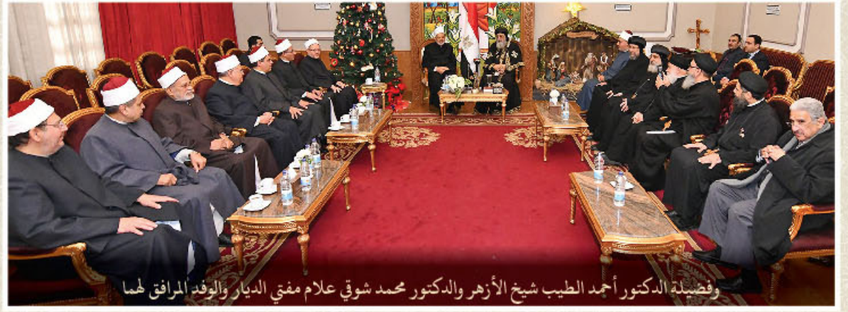
وقضيلة الدكتور أحمد الطيب شيخ الأزهر والدكتور محمد شوقي علام مفتي الديار والوفد المرافق لهما