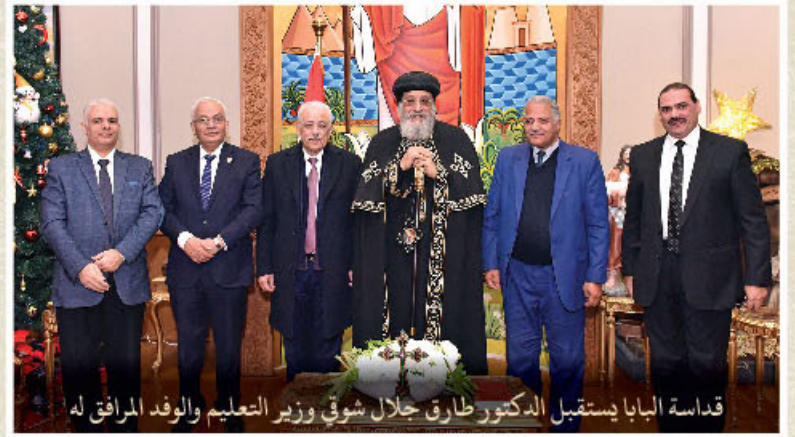
قداسة البابا يستقبل الدكتور طارق جلال شوقي وزير التعليم والوفد المرافق له