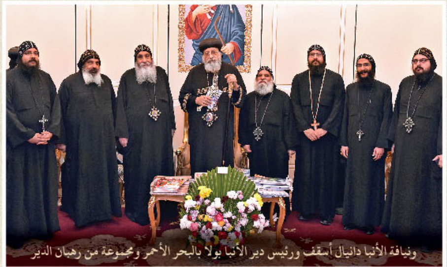
وفياة الأنبا دانيال أسقف ورئيس دير الأنبا يولا بالبحر الأحمر ومجموعة من رهبان الدير