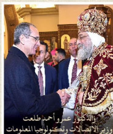
والدكتور عمرو أحمد طلعت ووزير الاتصالات وتكنولوجيا المعلومات