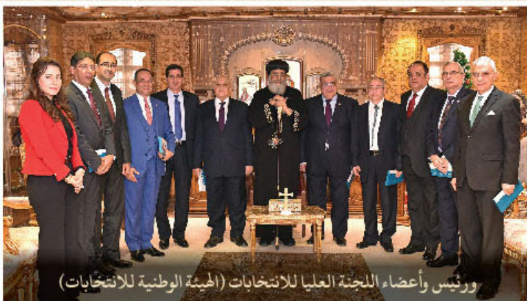
ورئيس وأعضاء اللجنة العليا للانتخابات (الهيئة الوطنية للانتخابات)