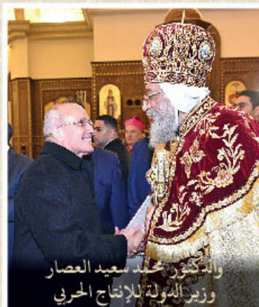
والدكتور محمد سعيد العصار وزير الدولة للإنتاج الحربي