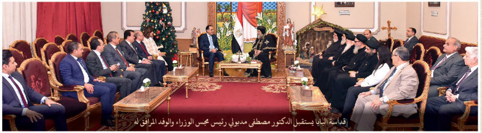
قداسة البابا يستقبل الدكتور مصطفى مدبولي رئيس مجلس الوزراء والوفد المرافق له