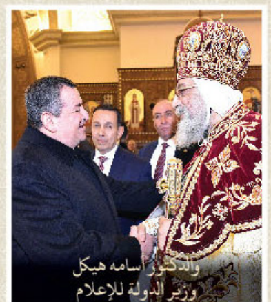
والدكتور أسامة هيكل ووزير الدولة للإعلام