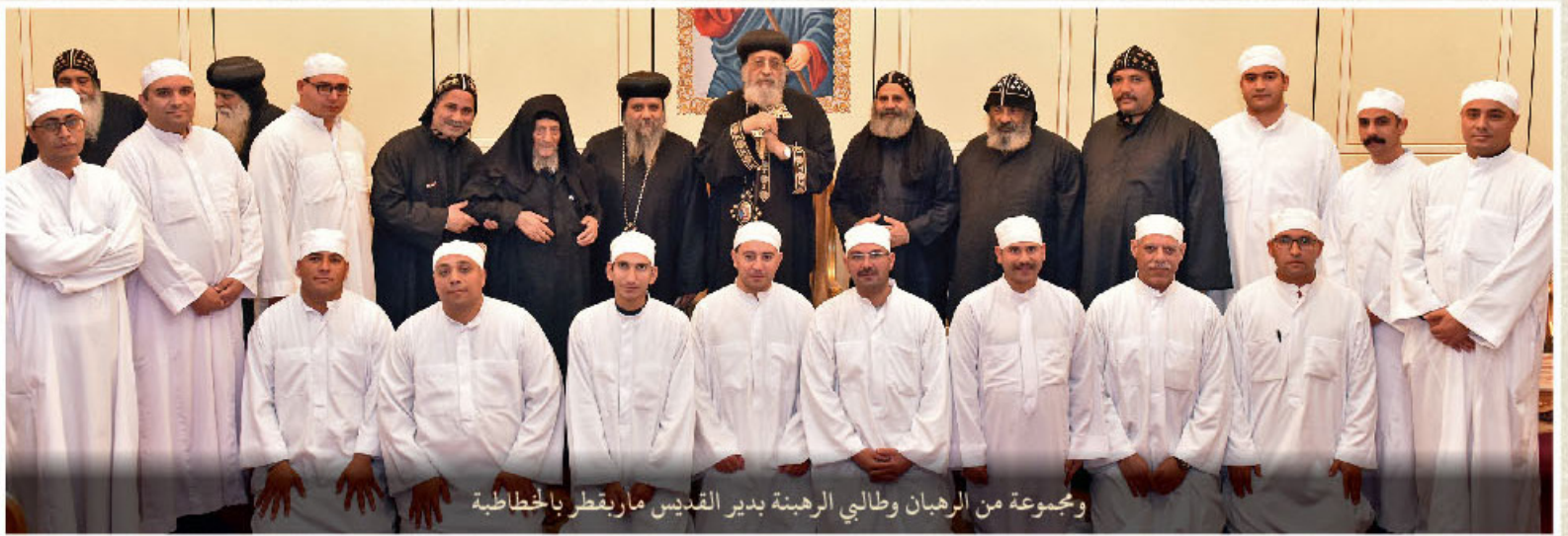
ومجموعة من الرهبان وطالبي الرهبنة بدير القديس ماريقطن بالخطاطبة