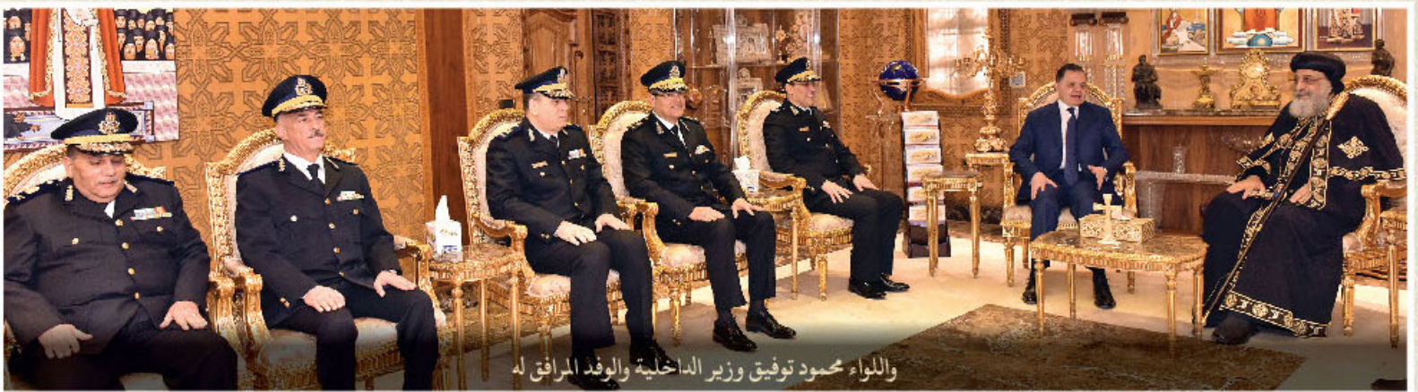
والواء محمود توفيق وزير الداخلية والوفد المرافق له