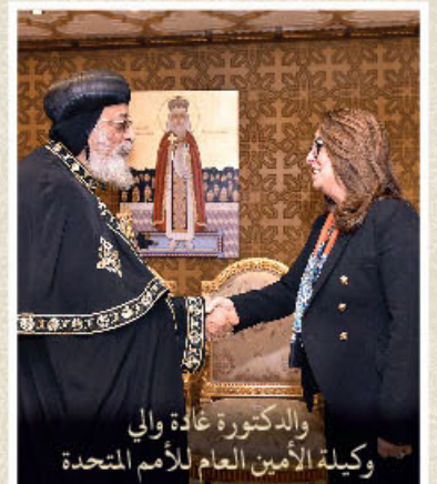
والدكتورة غادة والي وكيلة الأمين العام للأمم المتحدة