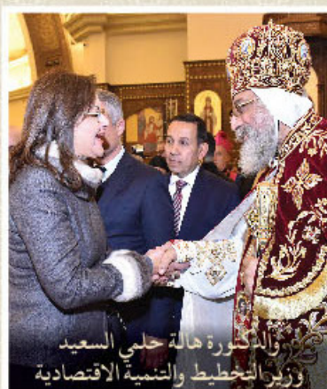
والدكتورة هالة حلمي السعيد ووزير التخطيط والتنمية الاقتصادية