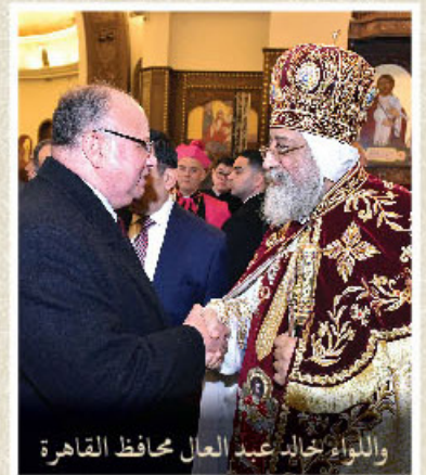
والواء خالد عبد العال محافظ القاهرة