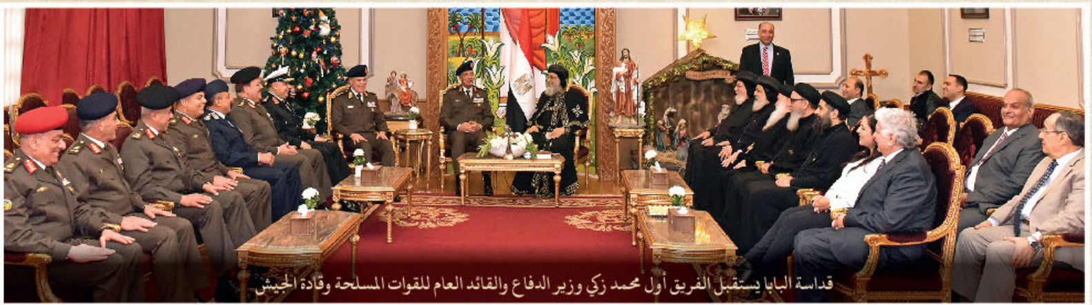
قداسة البابا يستقبل الفريق أول محمد زكي وزير الدفاع والقائد العام للقوات المسلحة وقادة الجيش