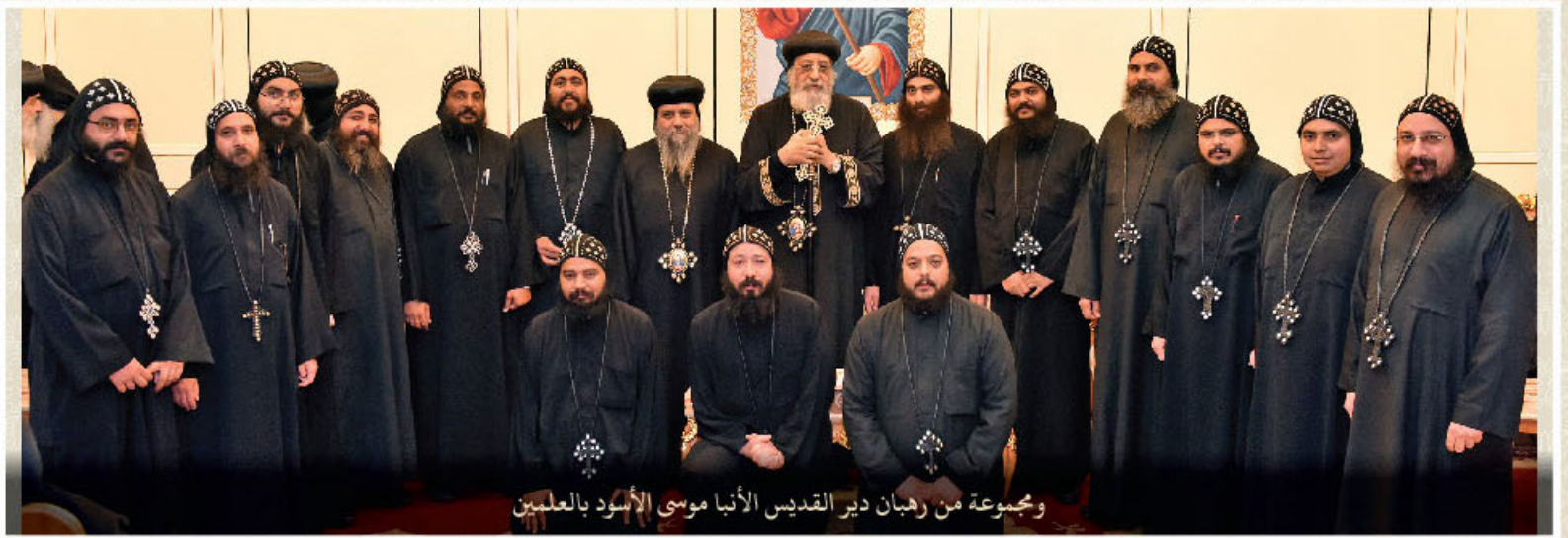
ومجموعة من رهبان دير القديس الأنبا موسى الأسود بالعلمين