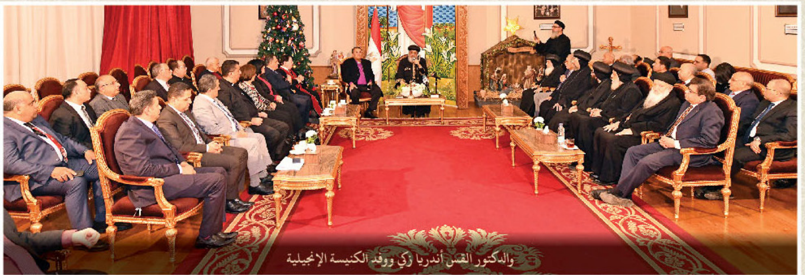
والدكتور القس أندريا زكي ووفد الكنيسة الإنجيلية