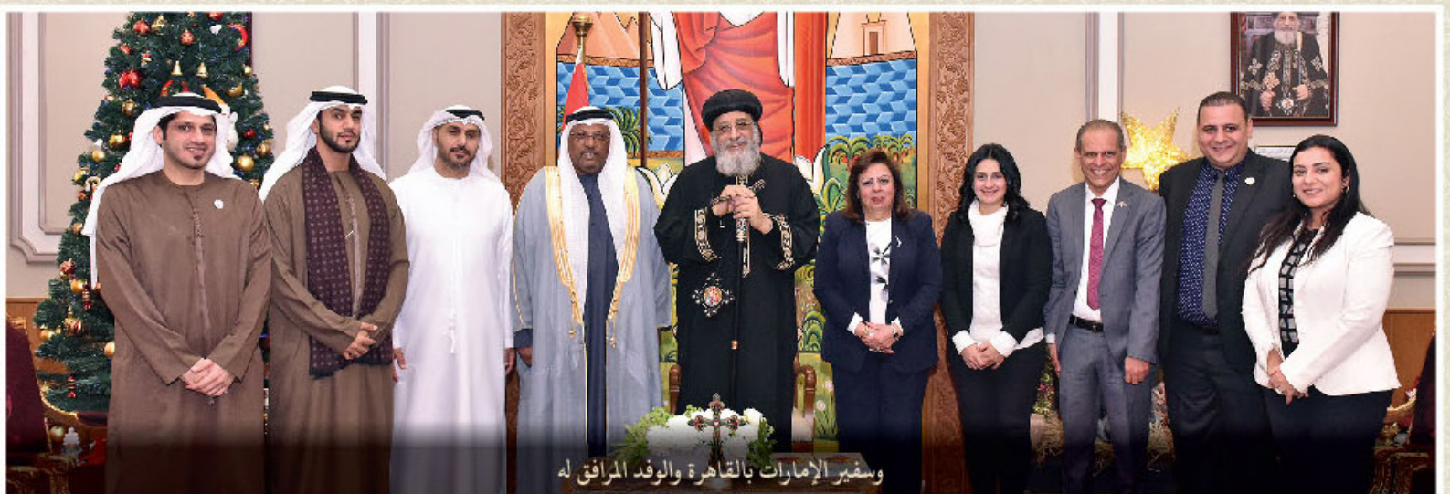
وسفير الإمارات بالقاهرة والوفد المرافق له