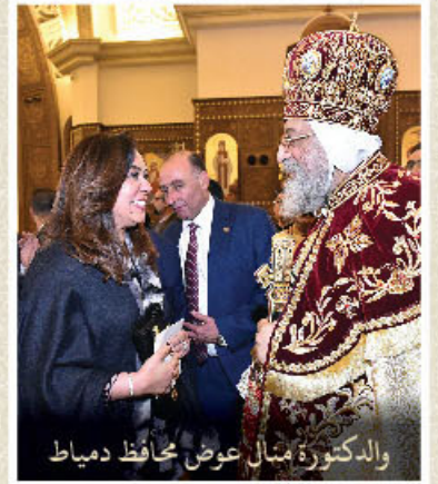
والدكتورة منال عوض محافظ دمياط