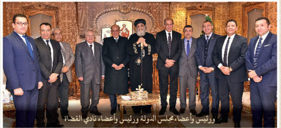
ورئيس وأعضاء مجلس الدولة ورئيس وأعضاء نادي القضاة