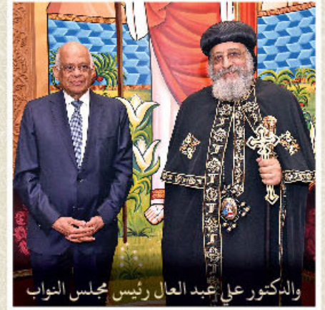
والدكتور علي عبد العال رئيس مجلس النواب