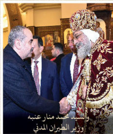
والسيد محمد منار عنيه ووزير الطيران المدني