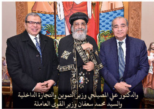
والدكتور علي المصياحي وزير التسيير والتجارة الداخلية والسيد محمد سعيان وزير القوى العاملة