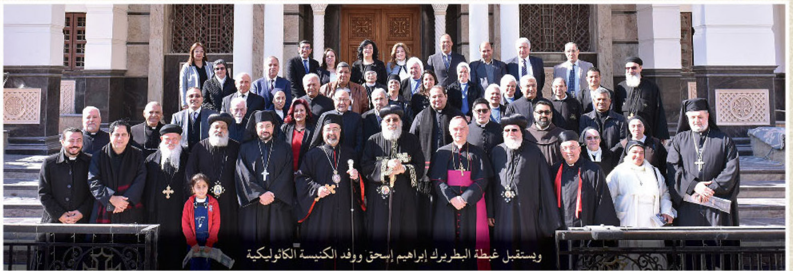
ويعتقب غبطة البطريرك إبراهيم إسحق ووفد الكنيسة الكاثوليكية