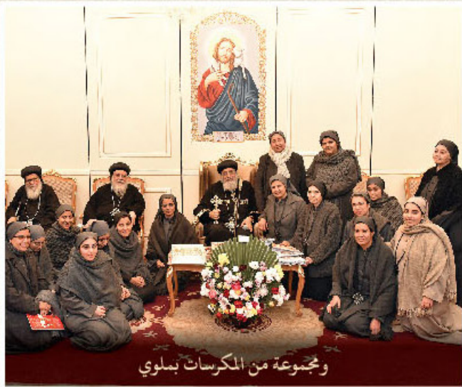
ومجموعة من المكرسات بملوي