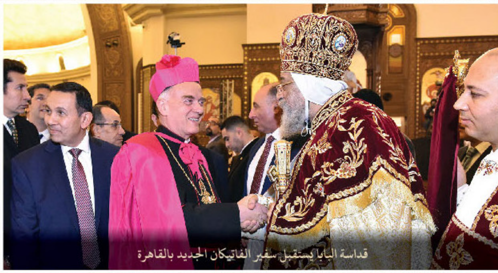
قداسة البابا يستقبل سفير الفاتيكان الجديد بالقاهرة