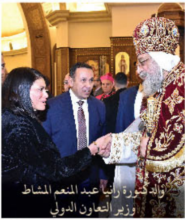
والدكتورة رانيا عبد المنعم المشاط وزير التعاون الدولي