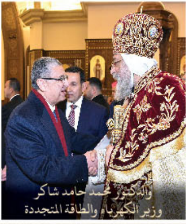
والدكتور محمد حامد شاكر وزير الكهرباء والطاقة المتجددة