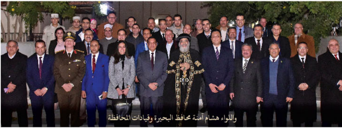
والواء هشام آمنة محافظ البحيرة وقيادات المحافظة