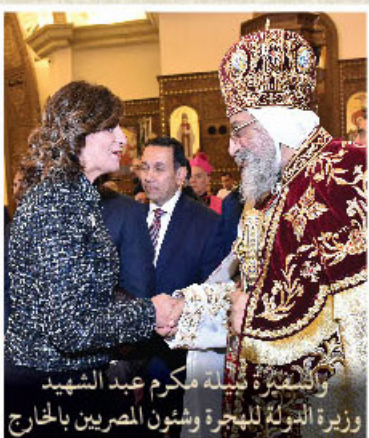
والسفيرة نبيلة مكرم عبد الشهيد وزيرة الدولة للهجرة وشؤون المصريين بالخارج