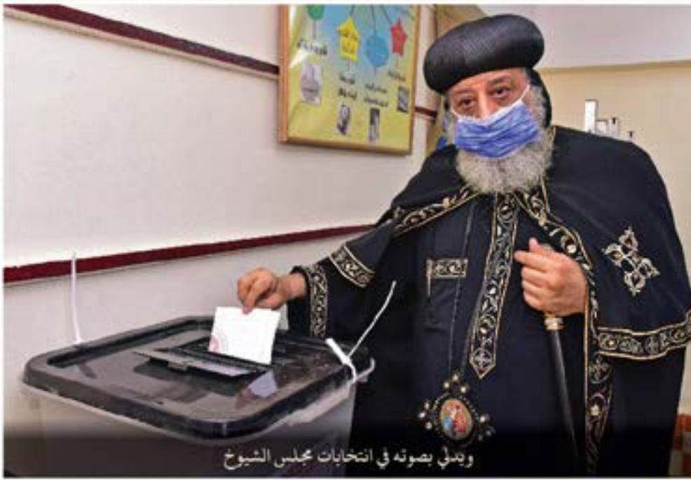
ويُدلي بصوته في انتخابات مجلس الشيوخ