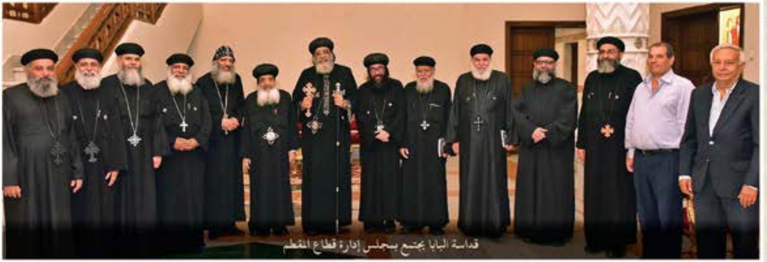
قداسة البابا يجتمع بعلمس إدارة قطاع المقطم