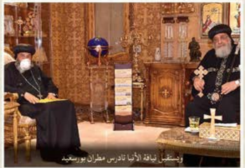
وئسقبفئ نفاقة الأنبا ناءرس مطران بورسعفة