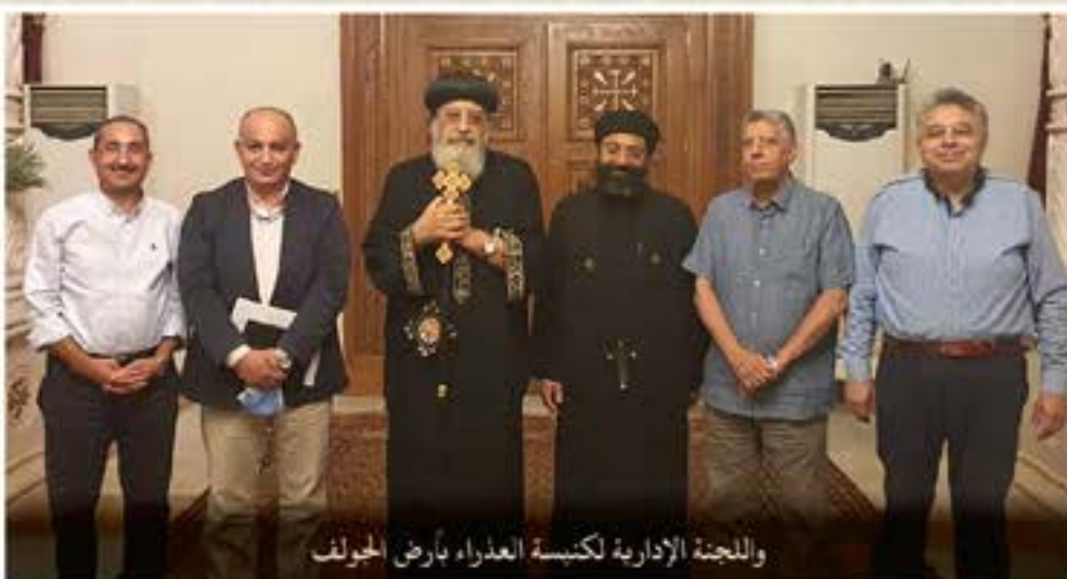
واللجنة الإءارةفة لكئبسة العءراء بأرض الهولف