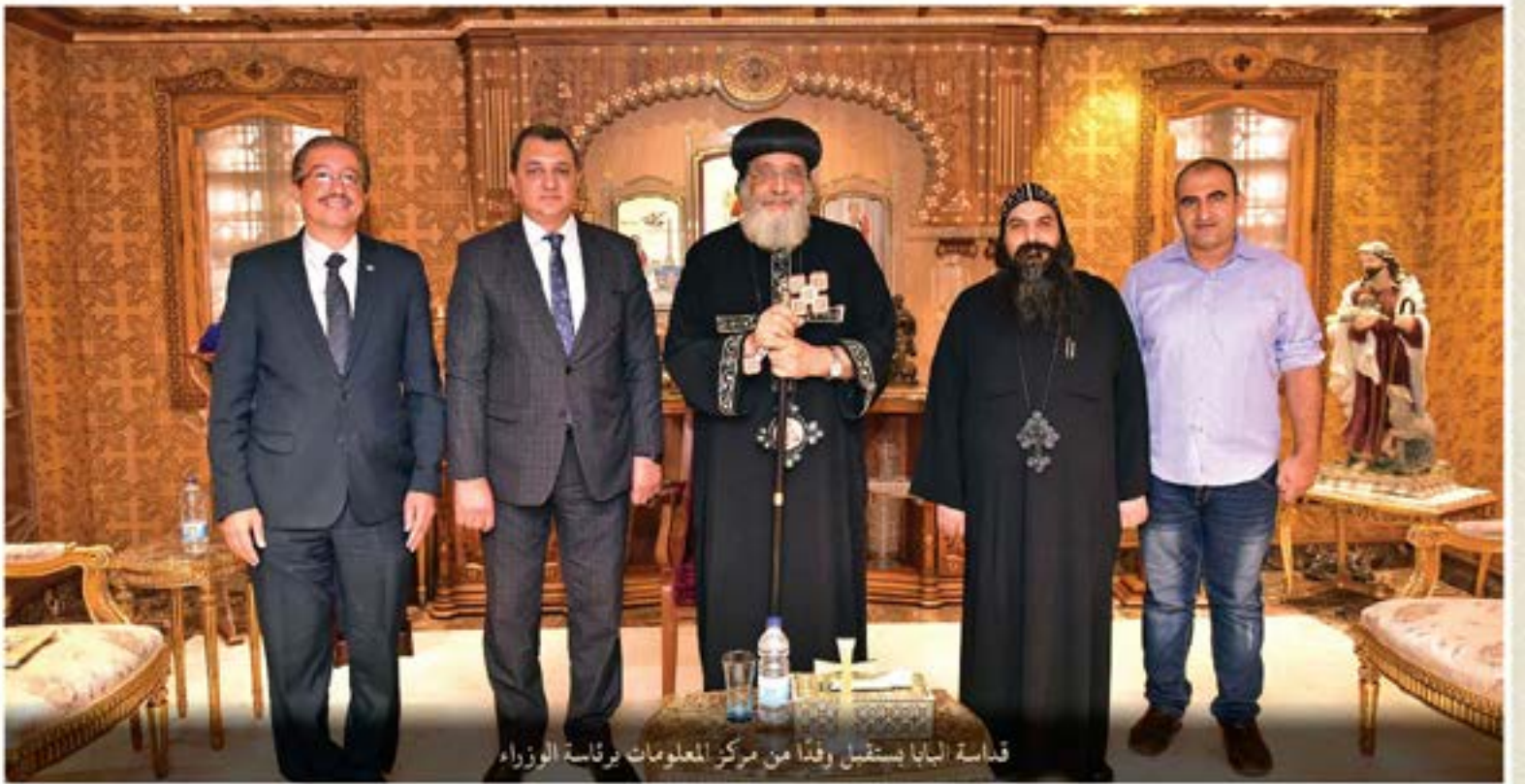
قيادة البابا يستقبل وفداً من مركز المعلومات برئاسة الوزراء