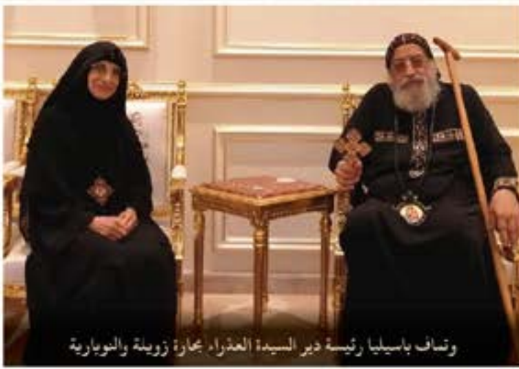
وئساف باسفلبا رئفسة ءبر السفءة العءراء بهارة زوفلة والنوبارة