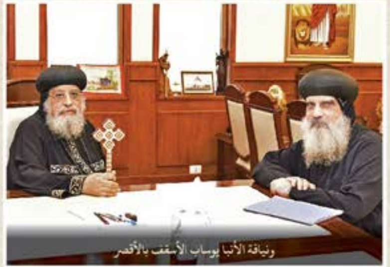
وئفاقة الأنبا فوساب الأسقف بالأنصر