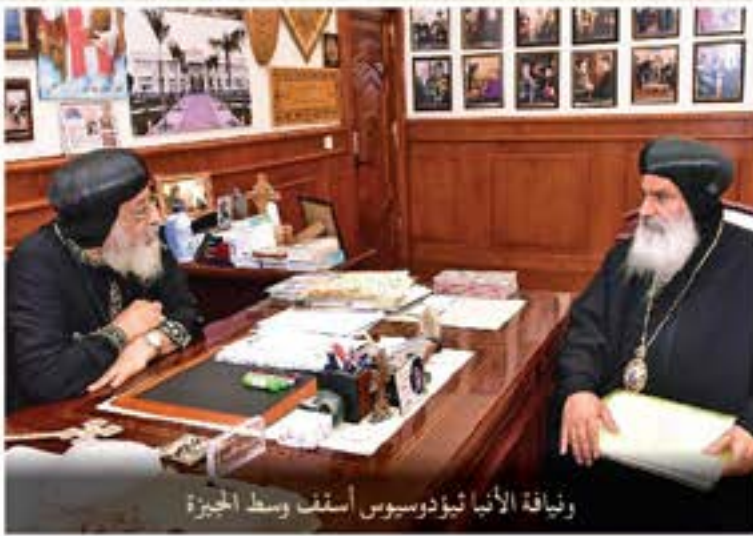
وئفاقة الأنبا ثيودوسيوس أسقف وسط الهبزة