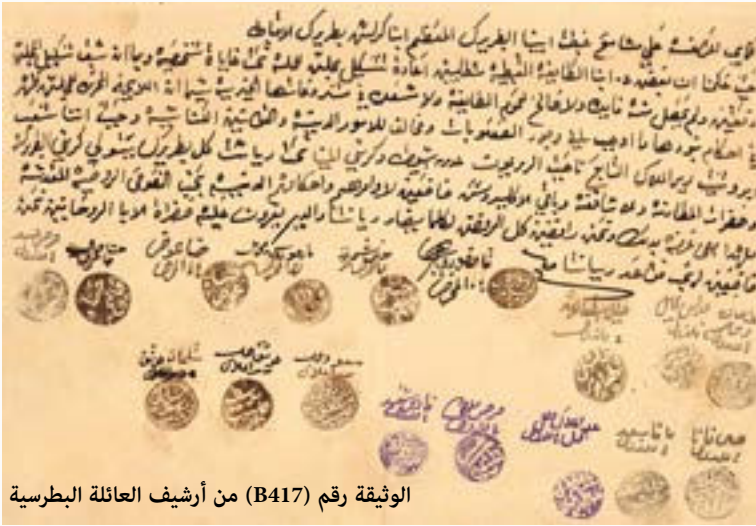
الوثيقة رقم (B417) من أرشيف العائلة البطرسية

http://modernegypt.bibalex.org/Collections/Documents/DocumentsLucene.aspx