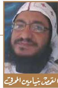
الروح بنيامين الموحى

وبنية، صارت الكنيسة، بعمل الروح القدس فيها.