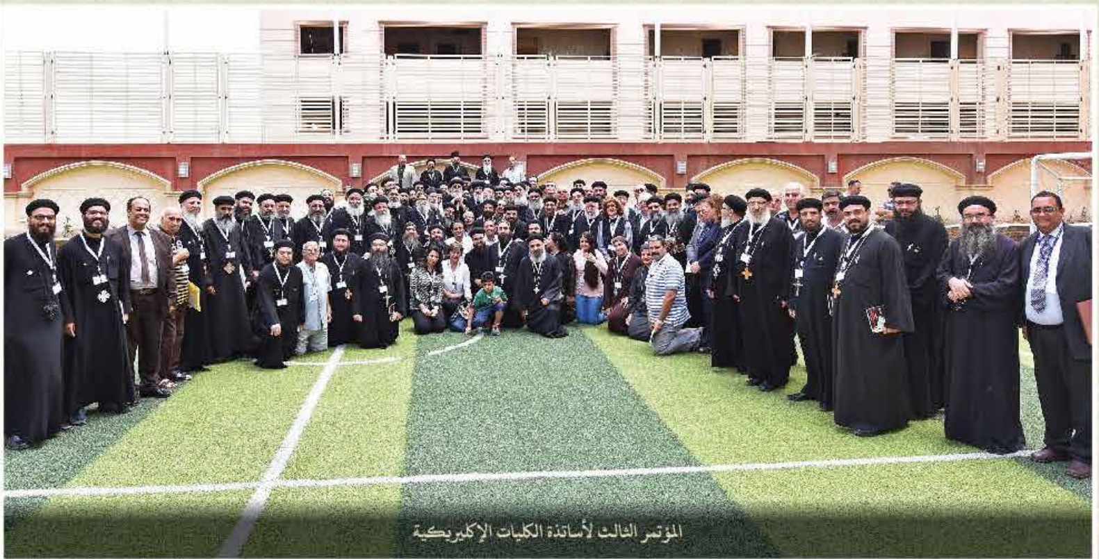
المؤتمر الثالث لأساتذة الكليات الإكليريكية