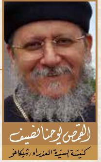
الشمس يوحنا يوسف كنيسة السيدة العذراء شيكاغو

وبالأكثر حينما يكتشفون مدى وحشية الحقد والكراهية التي تحملها الشياطين ضدَّ الإنسان.