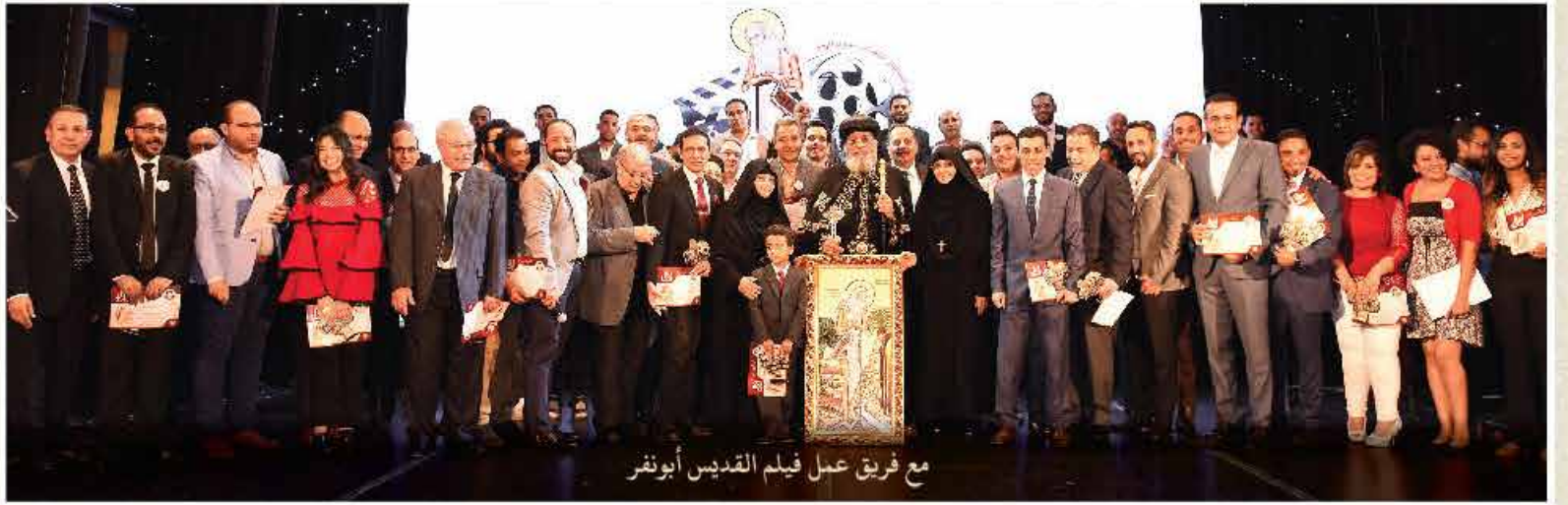
مع فريق عمل قبيلم القديس أبونفر