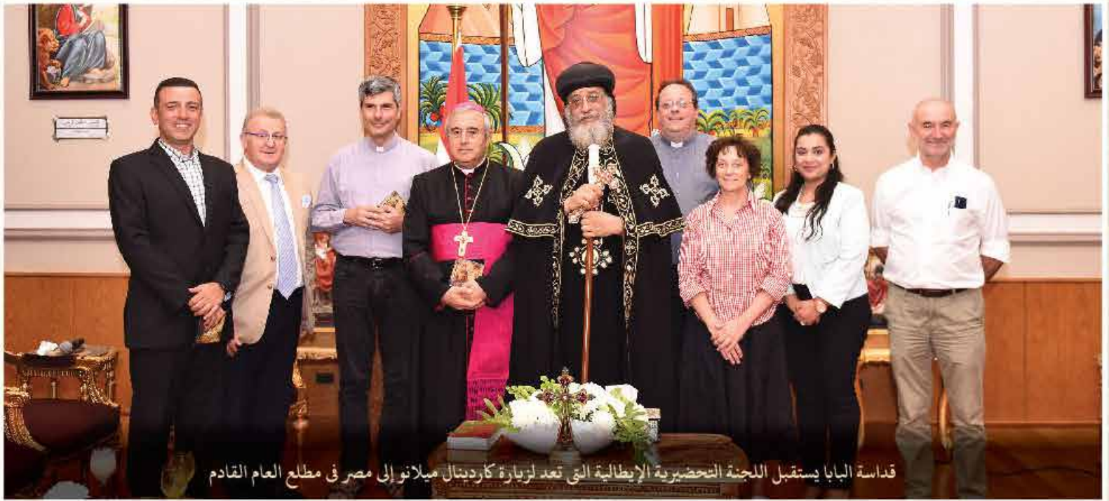
قداسة البابا يستقبل اللجنة التحضيرية الإيطالية التي تعد لزيارة كاردينال ميلانو إلى مصر في مطلع العام القادم