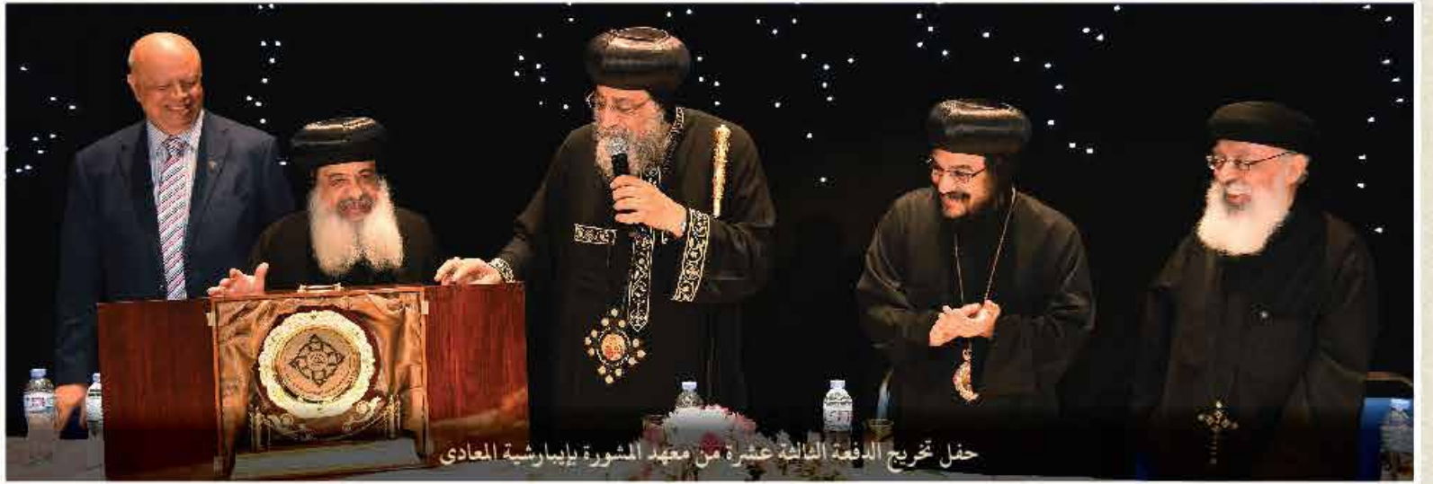
حفل تخريج الدفعة الثالثة عشرة من معهد الشورة بإببارشية المعادي