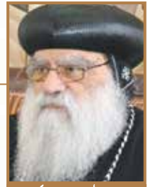
نيافة (الأنبا باخوموس) بطريرك أبرشية درطريخ ورسال افريقيا

من تعاليمه للجموع، فيسوع اصطحب تلاميذه معه ورأوه يصلي مرارًا كثيرة في جبل الزيتون، وهناك سأله أن يعلمهم كيف يصلون فعلمهم أن يصلوا قائلين «أبانا الذي في السموات...» (مت ٦: ٩). فلم تكن تلمذه الآباء الرسل على أفكار نظرية، بل حياة.. لذلك فالخادم الناجح يتعلم من الرب يسوع ومن الكنيسة، ويعيش ما يتعلمه عمليًا قبل أن يعلم به. على الخادم الحقيقي أن لا يتبع التعليم النظري فقط، بل يعيش حياة مسيحية حقيقية على مثال ربنا يسوع قبل أن يعلم، لكي تكون خدمته مؤثرة، فالرب يسوع نفسه علم تلاميذه: «أما من عمل وعلم فهذا يُدعى عظيمًا في ملكوت السموات» (مت ٥: ١٩).