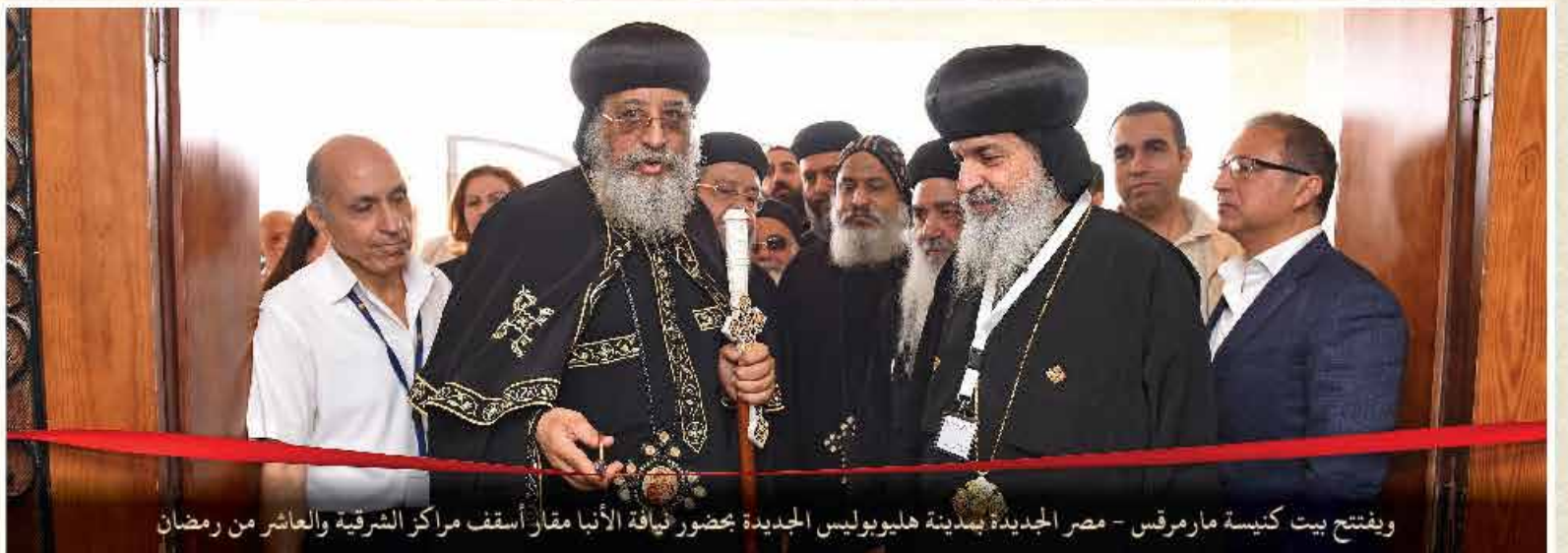
ويفتتح بيت كنيسة مارمرقس - مصر الجديدة بمدينة هليوبوليس الجديدة بحضور نيافة الأنبا مقار أسقف مراكز الشرقية والعاشر من رمضان