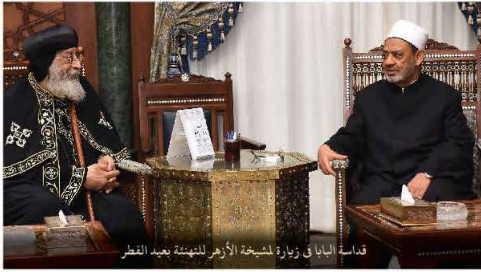
قداسة البابا في زيارة لمشيخة الأزهر للتهنئة بعيد الفطر