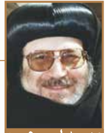
نيافة (الأنبا بيشوي) بطريرك كنيستين وديار مصر