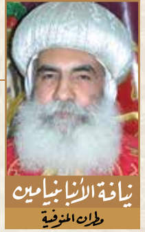
نيافة الأنبا بنامين مطران المنوفية