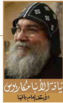
ياقة الآباء الرسل الأربعة الأسقف العام بالينا