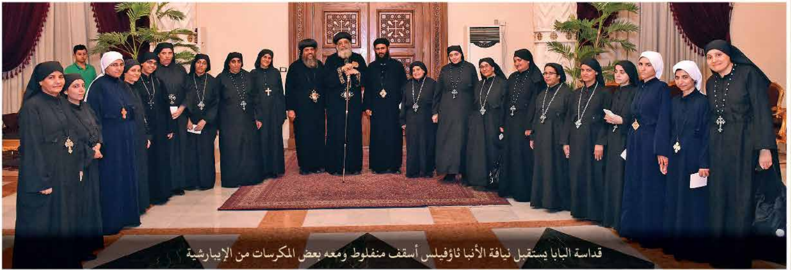
قداسة البابا يستقبل نيافة الأنبا ثاؤفيلس أسقف منفلوط ومعه بعض المكرسات من الإيبارشية