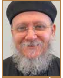
القسيس القديس كنيسة السيدة العذراء/ميكائيل

أوصانا السيد المسيح أن نكون «بسطاء كالحمام» (مت ١٠: ١٦). هل معنى هذا أن يكتفي الإنسان بالقليل من الفهم والمعرفة، ويعيش سطحياً بلا عمق؟! لقد فتح الرب يسوع ذهن التلاميذ ليفهموا الكتب (لو ٢٤)، وأخذ يشرح لهم الأمور المختصة به في جميع الأسفار المقدسة، من موسى والأنبياء والمزامير.. بل وويح تلميذَي عمواس على سطحيتهما، وعدم إلمامهما بما تكلم به الأنبياء عن إلامه التفصيلية وقيامته المحيطة..!