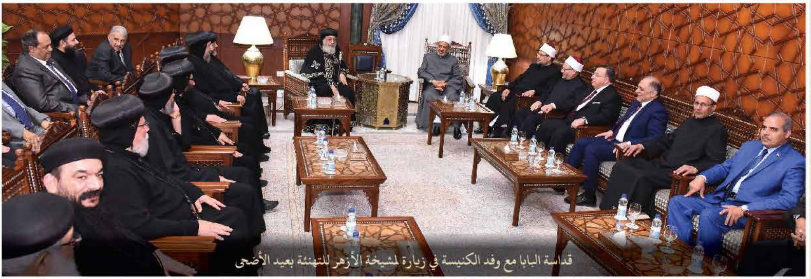
قداسة البابا مع وفد الكنيسة في زيارة لمشيخة الأزهر للتمنئة بعيد الأضحى