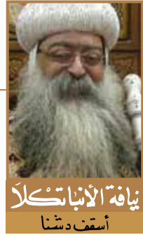
نيافة الأباتكلا أسقف دشنا

هو الذي قال «شعرة من رؤوسكم لا تهلك» (لو ١٨: ٢١).