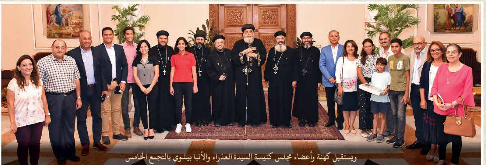
ويستقبل كهنة وأعضاء مجلس كنيسة السيدة العذراء والأتبا بيشوي بالتجمع الخامس