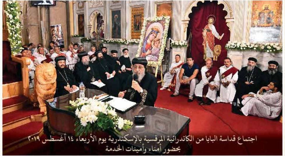
اجتماع قداسة البابا من الكاتدرائية المرقسية بالإسكندرية يوم الأربعاء ١٤ أغسطس ٢٠١٩ بمضور أمناء وأمينات الخدمة