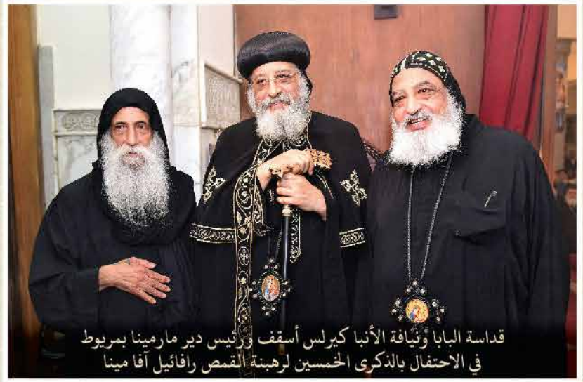
قداسة البابا وثيافة الأنبا كيرلس أسقف ورئيس دير مارمينيا بربوط في الاحتفال بالذكرى الخمسين لرهينة القمص رافائيل آفا مينا