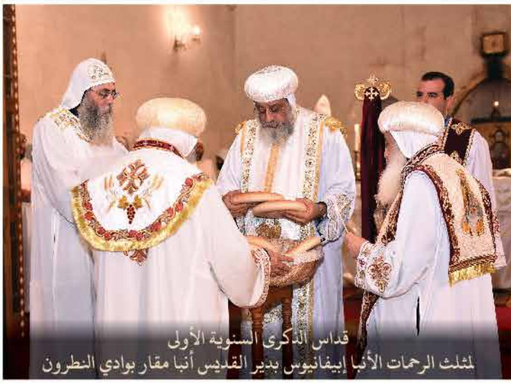
قداس الذكرى السنوية الأولى لمثلث الرحمات الأنبا إبيفانيوس بدير القديس أنبا مقار بوادي النطرون