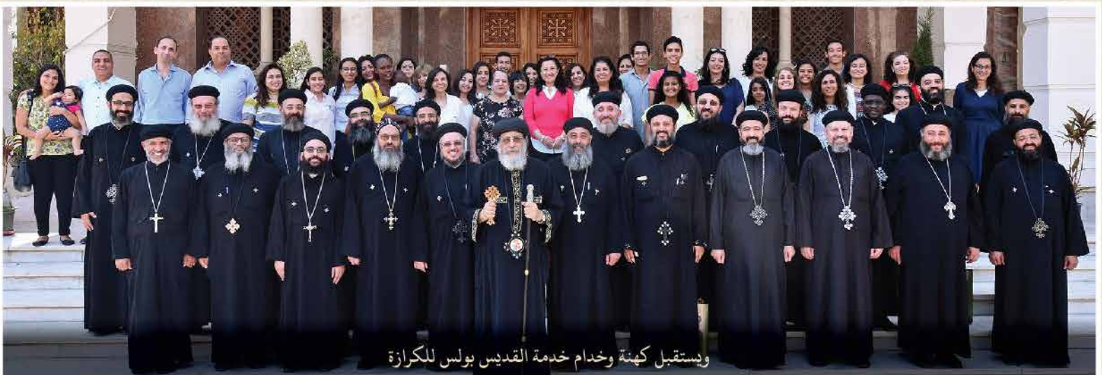
ويستقبل كهنة وخدام خدمة القديس بولس للكرامة