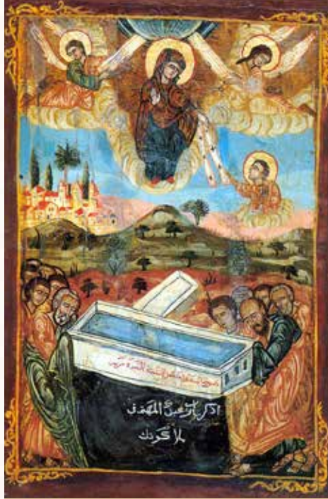
أيقونة قبطية لصعود جسد السيدة العذراء من كنيسة مار مينا بقم الخليج بمصر القديمة

فيما تحتفل الكنائس المسيحية التي تتبع التقويم الغريغوري يوم ١٥ أغسطس من كل عام بعيد رقاد (نياحة) السيدة العذراء، تحتفل الكنائس التي تتبع التقويم اليولياني بنفس العيد يوم ٢٨ أغسطس، أي بفارق ١٣ يوماً، وهو نفس الفارق الزمني الذي يفصل بين الاحتفال بعيد الميلاد المجيد عند اتباع التقويمين (٢٥ ديسمبر - ٧ يناير)، أو أي عيد آخر.