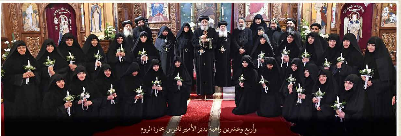
وأربع وعشرين راهبة بدير الأمير تادرس بحارة الروم