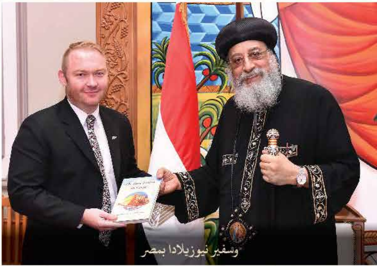
وسفير نيوزيلاندا بمصر