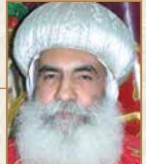
زيارة الأنبا يامين مطار المنوفية

على قدرات الإنسان العادية ولكنه يتعداها، فالإيمان يُركي الإنسان لما هو فوق الطبيعة العادية بعمل إلهي عجيب. هكذا تكون الحياة الروحية تفوق الطبيعة، فتحرّر النفس من الخطية، والانعقاد من سلطانها من خلال الإيمان بعمل دم المسيح وفاعليته في حياتنا.