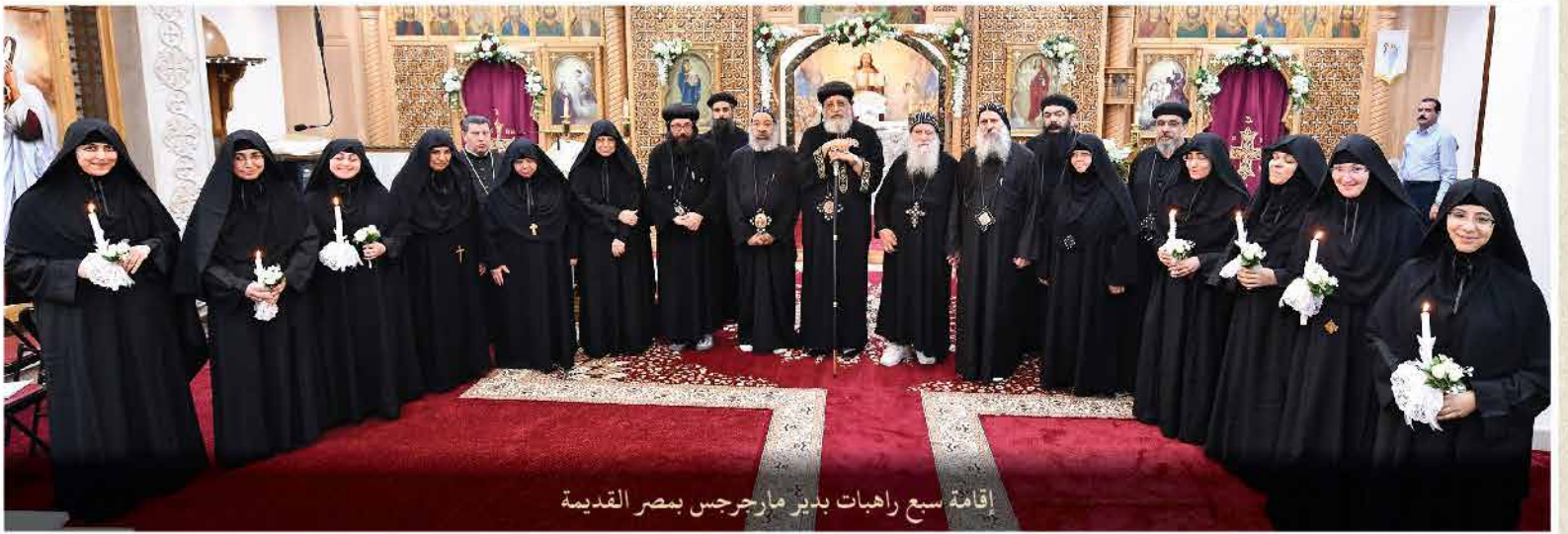
إقامة سبع راهبات بدير مارجرس بمصر القديمة