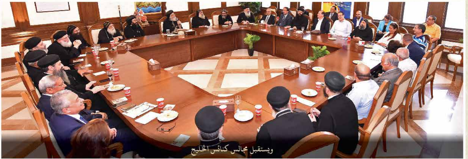
ويستقبل مجالس كنائس الخليج