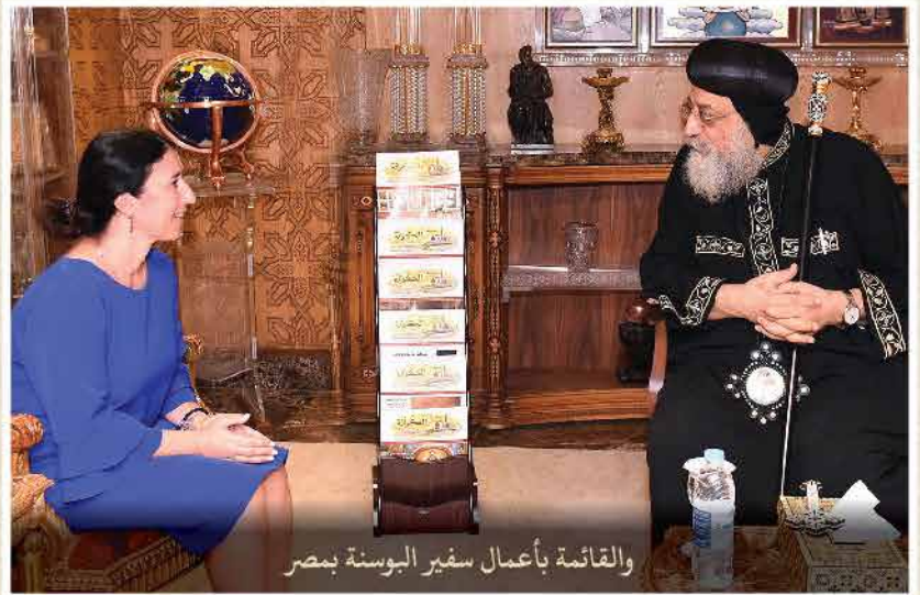
والقائمة بأعمال سفير البوسنة بمصر