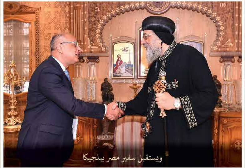
وإستقبال سفير مصر ببلجيكا