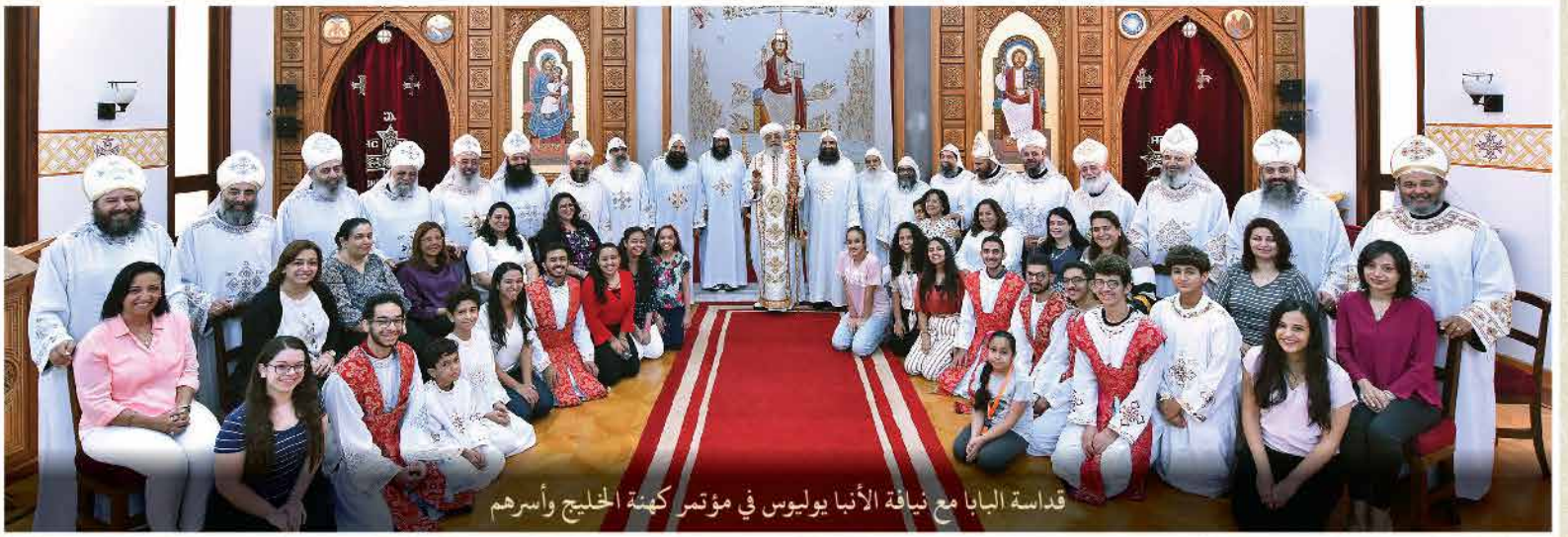
قداسة البابا مع نيافة الأتبا يوليوس في مؤتمر كهنة الخليج وأسرههم