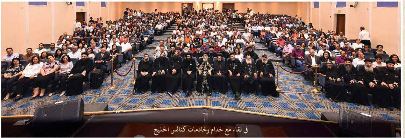
في لقاء مع خدام وخدمات كنائس الخليج