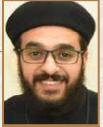
الدكتور إبراهيم المازر كلمة لطلاب جامعة الأزهر الشريف