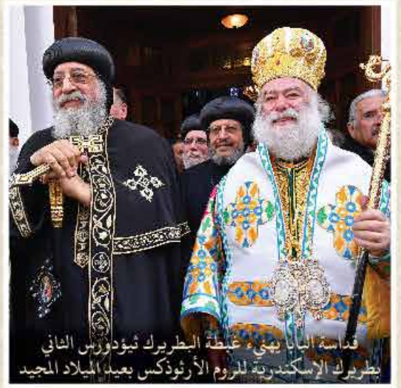
قداسة البابا يمنيء غبطة البطريرك تيودوروس الثاني بطريرك الإسكندرية للروم الأرثوذكس بعيد الميلاد المجيد