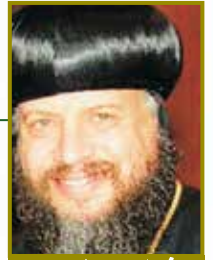
نيافة الانبا يوسف أسقف تكساس، مطرئ بوليا و مطرئ بوليا