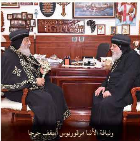
وفيافة الأنبا مرقوريوس أسقف حرجا