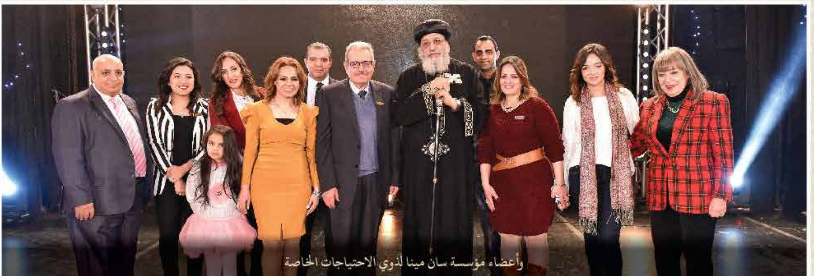
وأعضاء مؤسسة سان مينا لذوي الاحتياجات الخاصة