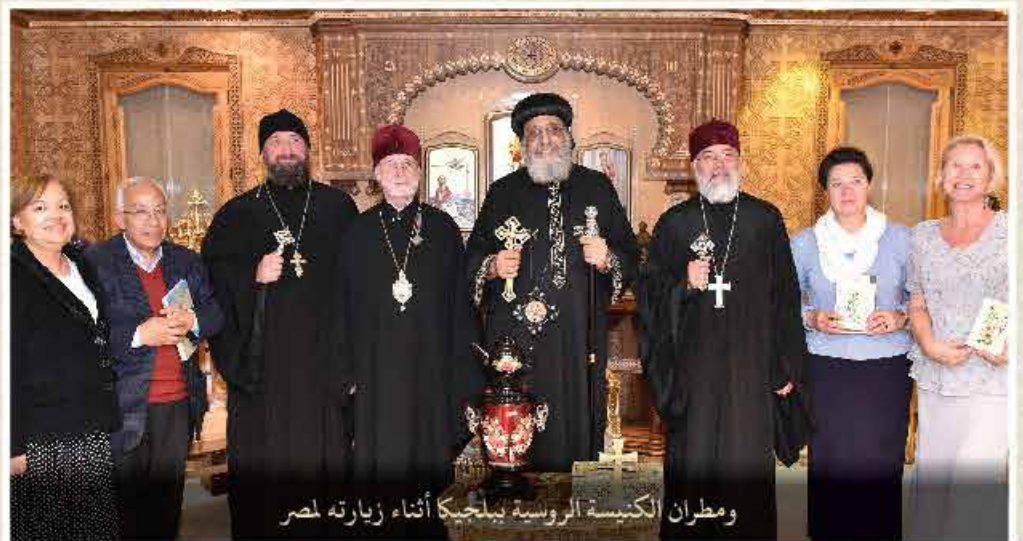
ومطران الكنيسة الروسية بيلجيكاً أثناء زيارته لمصر