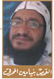
القرص بنيامين المورق

(غلا ٥: ١٦). وكما صام موسى النبي أربعين يوماً (خر ٢٤: ١٨)، استعداداً لكي يتسلم لوحى الشريعة، التي هي كلمة الله، لكي يعرف بنو إسرائيل الله من خلال الوصية المكتوبة. هكذا تصوم الكنيسة صوم الميلاد لكي نوهل لميلاد الكلمة المتجسد في قلوبنا، وننال معرفة الله الفائقة، فالسيد المسيح بتجسده أظهر لنا نور الأب وأنعم علينا بمعرفة الروح القدس الحقيقية. فلكي نتمتع وننال بركات التجسد الإلهي، لا بد أن نستعد بالصوم والتسبيح ولا سيما ترتيب التسابيح في شهر كيهك، وهو معروف بصلواته وطوقسه وأحانه وتسابجه، التي يُطلق عليها «سبعة وأربعة» وذلك إشارة إلى: سبع ثيوطوكيات (وهي مدائح وتطويات خاصة بالسيدة العذراء مريم) وأربعة هوسات (والهوس كلمة قبطية معناها تسبحة).