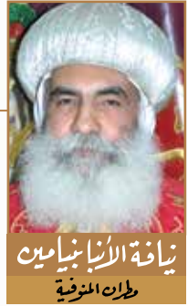
بشارة الابن انجيليا بابا بومباردي ورسول انجيليا

«مفتدين الوقت لأن الأيام شريرة» (أف ٥: ١٦) .. ثم ينصح أيضاً أهل كولوسي بقوله: «اسلكوا بحكمة من جهة الذين هم من خارج مفتدين الوقت» (كو ٤: ٥) .. ولنا أن نسأل: