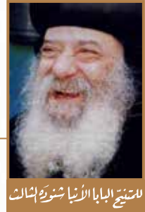
الشيخ البابا الأنبا شنودة الثالث