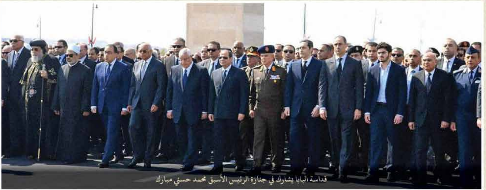
قداسة البابا يشارك في جنازة الرئيس الأسبق محمد حسني مبارك