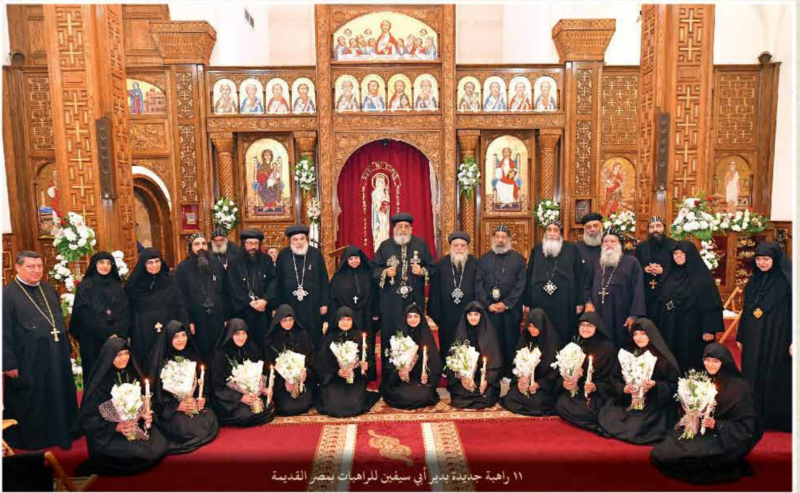
١١ راهبة جديدة بدير أبي سيفين للراهبات بنصر القديمة