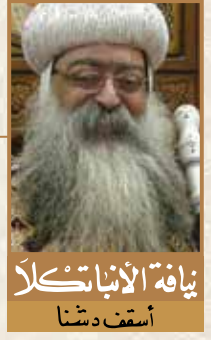
نيافة الأبناتكلأ أسقف دشنا