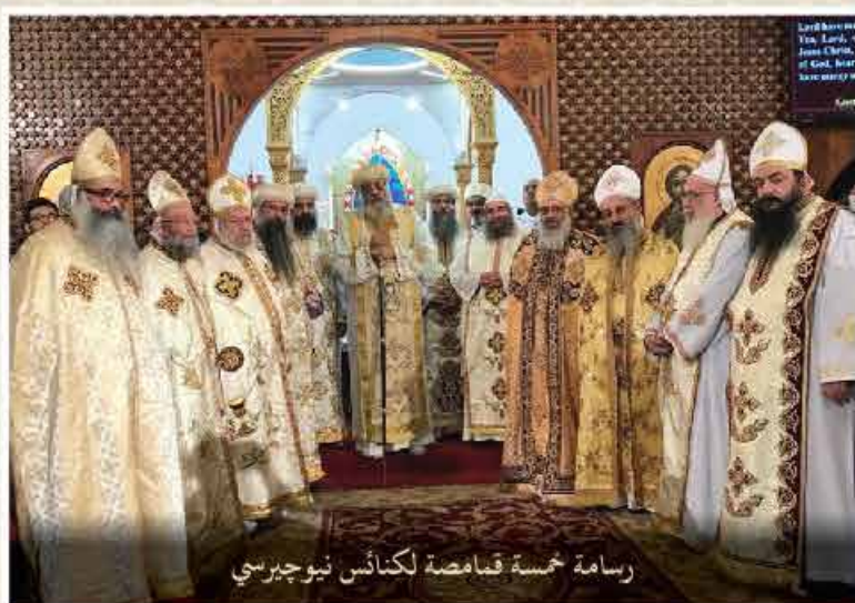
رسم خمسة قمصاة لكنائس نيوجيرسي