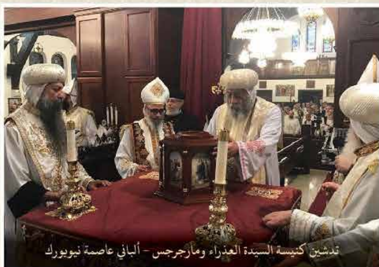
تدشين كنيسة السيدة العذراء ومارجرس - ألباني عاصمة نيويورك