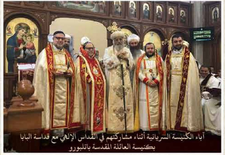
آباء الكنيسة السريانية أثناء مشاركتهم في القداس الإلهي مع قداسة البابا بكنيسة العائلة المقدسة باتلبورو