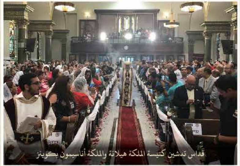
قداس تدهين كنيسة الملكة هيلانة والملكة أناسيون بكونيز