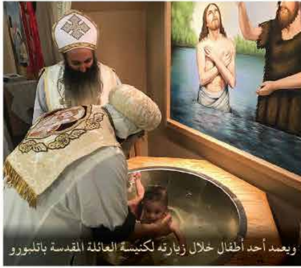
ويعد أحد أطفال خلال زيارته لكنيسة العائلة المقدسة باتلبورو