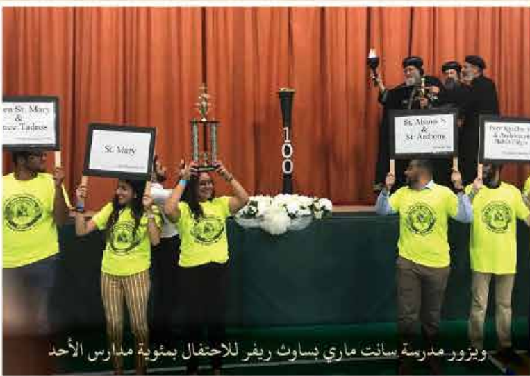
ويزور مدرسة سانت ماري إسناوث ريفر للاحتفال بمئوية مدارس الأحد