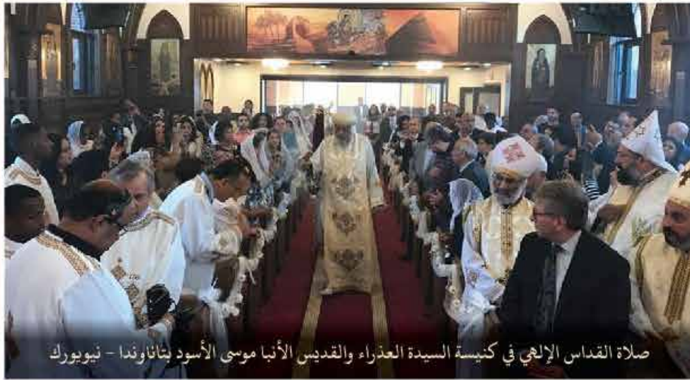
صلاة القداس الإلهي في كنيسة السيدة العذراء والقديس الأنبا موسى الأسود بساناوندنا - نيويورك