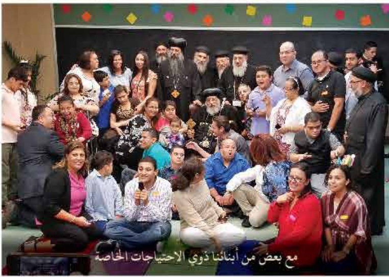
مع بعض من أبنائنا ذوي الاحتياجات الخاصة