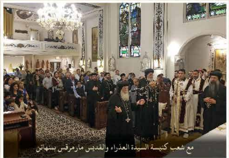
مع شعب كنيسة السيدة العذراء والقديس مارمرقس بنينان