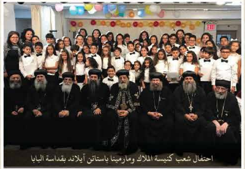
احتفال شعب كنيسة الملاك ومارميثا باستاتن آيلاند بقداسة البابا