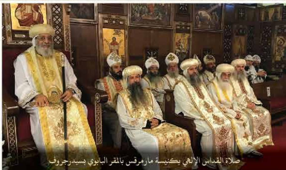
صلاة القديس الإلهي بكنيسة مارمرقس بالمقر البابوي بسيدرجروف