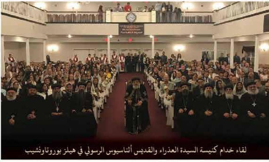
لقاء خدام كنيسة السيدة العذراء والقديس أثناسيوس الرسولي في هيلز بوروتا ونشيب