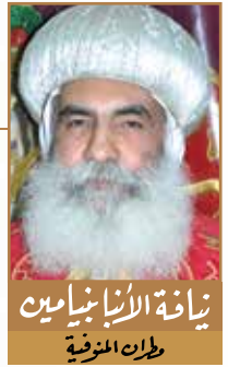
نيافة الأنبا بنامين مطران المنزفة