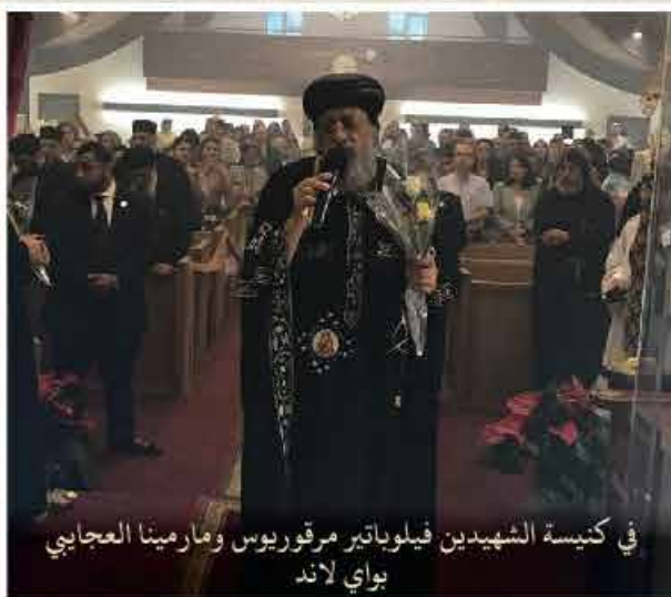
في كنيسة الشهيد فيلوياتي مرقوريوس ومارمينا العجايبي بواي لاند