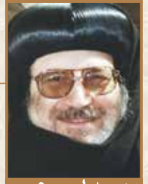
زيارة (الربنا بيشوي) طران كهنيسة وطران وشمال افريقيا

والآن يلزمنا أن نتأمل في معنى «مفتاح داود» الذي ورد في هذه النبوة، ثم تأكد في كلام السيد المسيح في سفر الرؤيا.