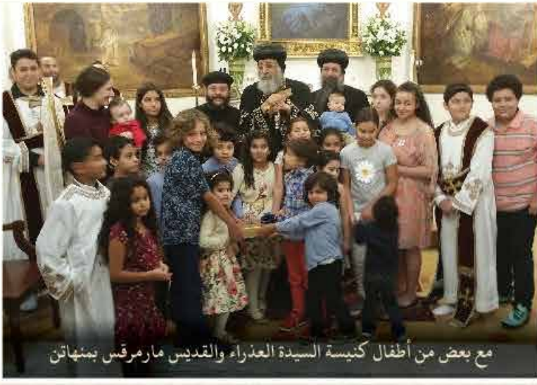
مع بعض من أطفال كنيسة السيدة العذراء والقديس مارمرقس بمنهاتن