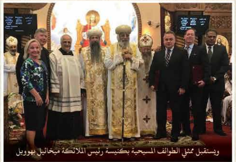
ويستقبل ممثلي الطوائف المسيحية بكنيسة رئيس الملائكة ميخائيل بهوويل