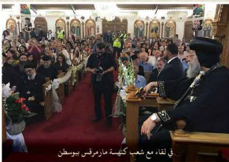
في لقاء مع شعب كنيسة مارمرقس ببوسطن