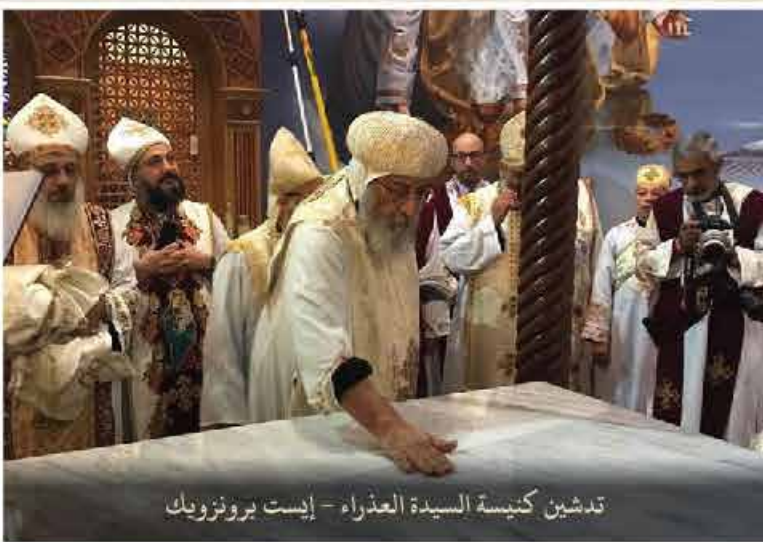
تدهين كنيسة السيدة العذراء - إيسيت برونزويك