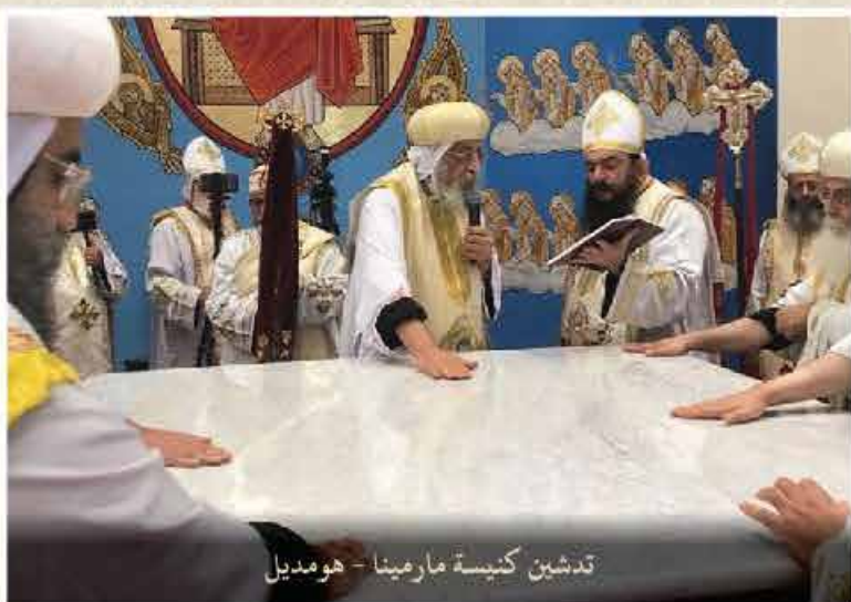
تدشين كنيسة مارمينا - هومديل