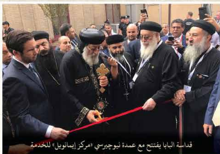
قداسة البابا يفتتح مع عمدة نيوجيرسي «مركز إيمانويل» للخدمة