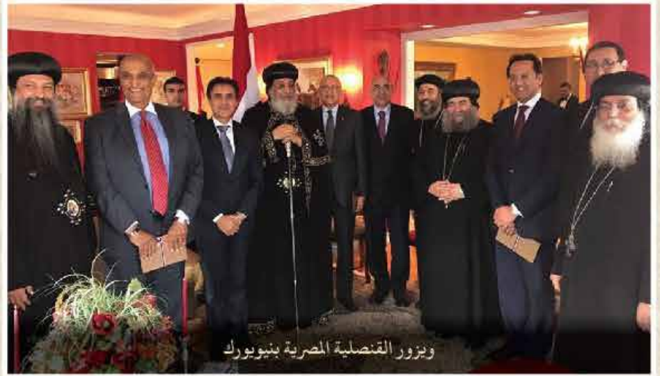
ويزور القنصلية المصرية بنيويورك