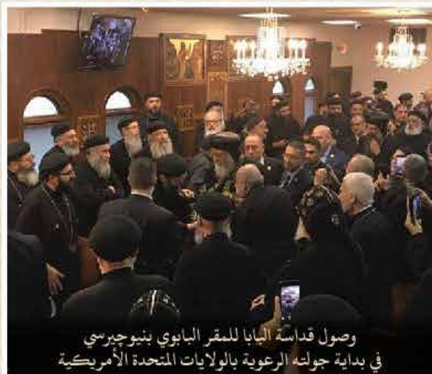
وصول قداسة البابا للمقر البابوي بنيوجيرسي في بداية جولته الرعوية بالولايات المتحدة الأمريكية