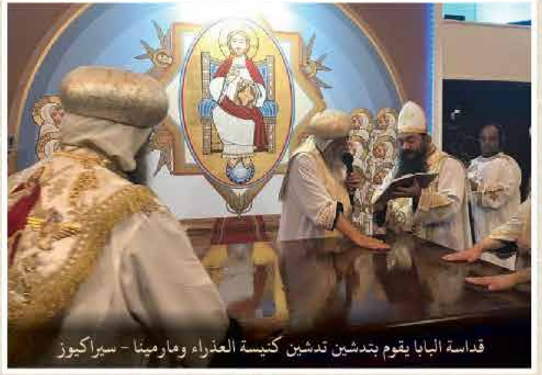
قداسة البابا يقوم بتدشين كنيستين في مارمينا - سيراكوز