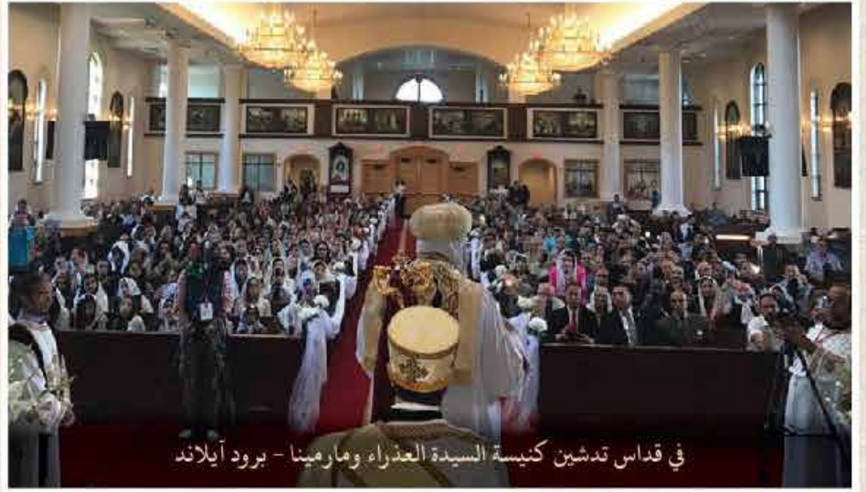
في قداس تدشين كنيسة السيدة العذراء ومارمينا - برود آيلاند