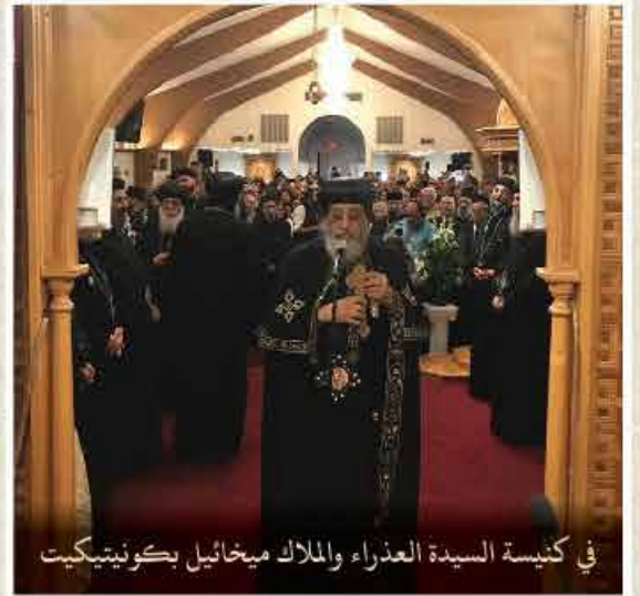
في كنيسة السيدة العذراء والملاك ميخائيل بكونيتيكت