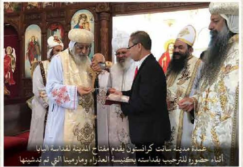
عمدة مدينة سانت كرايستون يقدم مفتاح المدينة لقداسة البابا أثناء حضوره للترحيب بقداسه بكنيسة العذراء ومارينا التي تم تدشينها