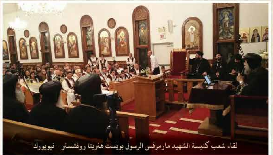
لقاء شعب كنيسة الشهيد مارمرقس الرسول بوندست هنريتا روتشستر - نيويورك