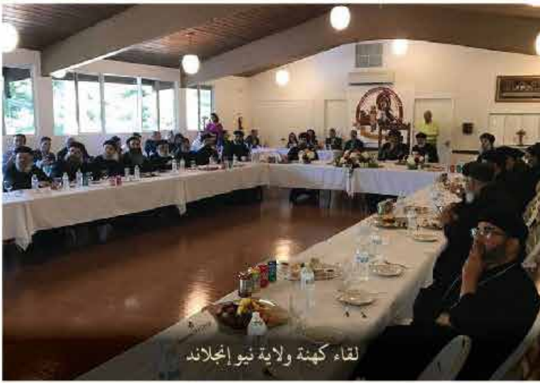
لقاء كهنة ولاية نيو إنجلاند