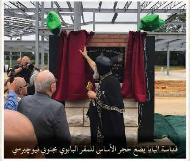
قداسة البابا يضع حجر الأساس للمقر البابوي بجنوبي فيوجيرسي