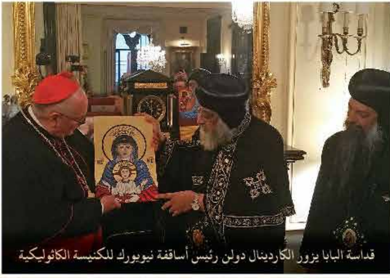
قداسة البابا يزور الكاردينال دولن رئيس أساقفة نيويورك للكنيسة الكاثوليكية