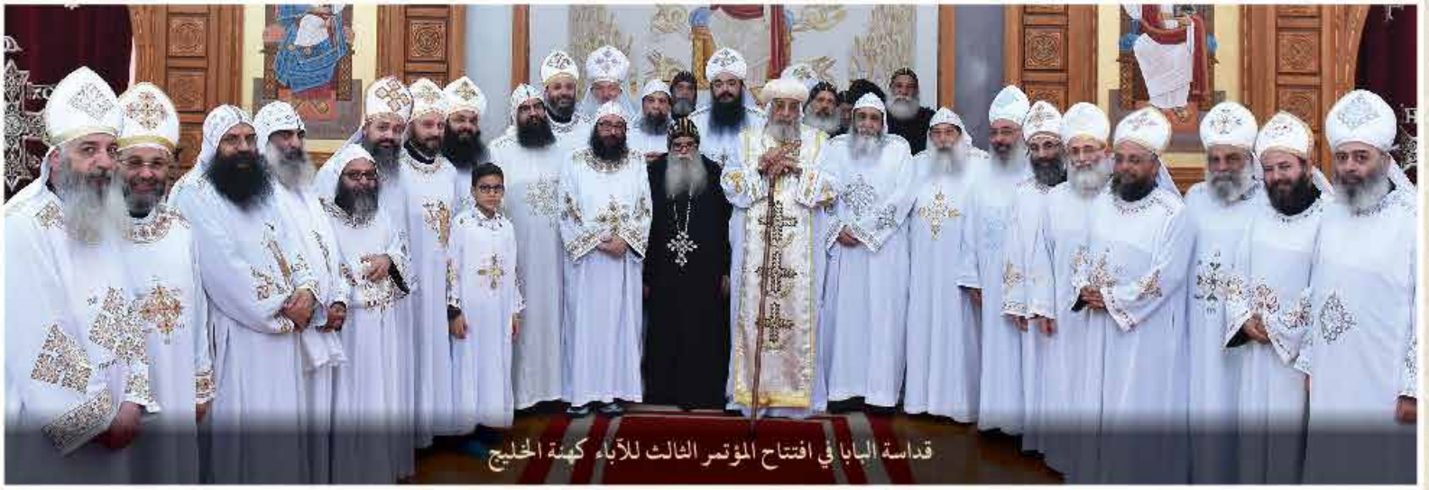
قداسة البابا في افتتاح المؤتمر الثالث للآباء كنيسته الخليج