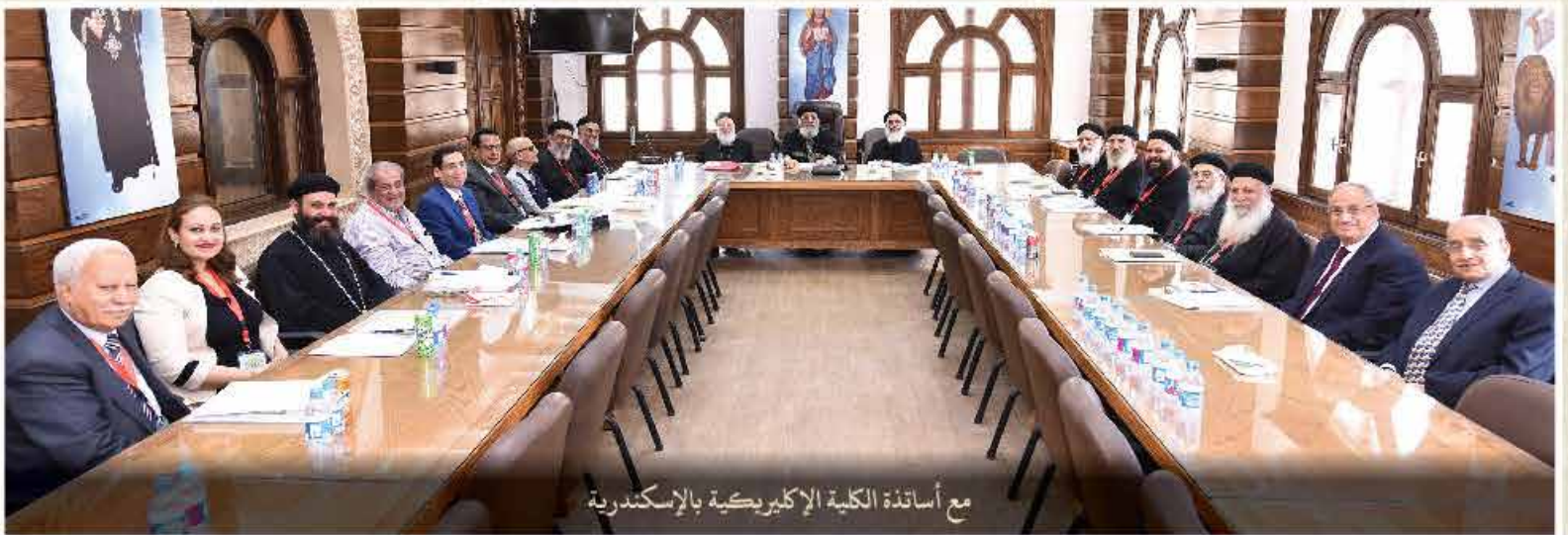
مع أساتذة الكلية الإكليريكية بالإسكندرية