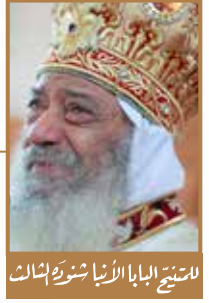
الصورة البابا الأناثيون سنة ١٩٨٣

مجلة الكرازة ٢٠ أغسطس ٢٠١٠ - العددان ٢١-٢٢