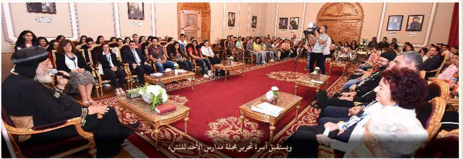
ويستقبل أسرة تحرير مجلة مدارس الأحد للنشء