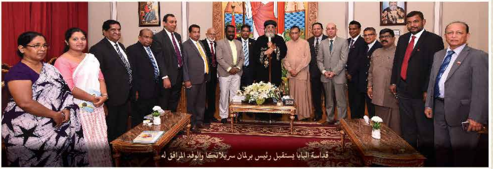
قداسة البابا يستقبل رئيس برلمان سريلانكا والوفد المرافق له