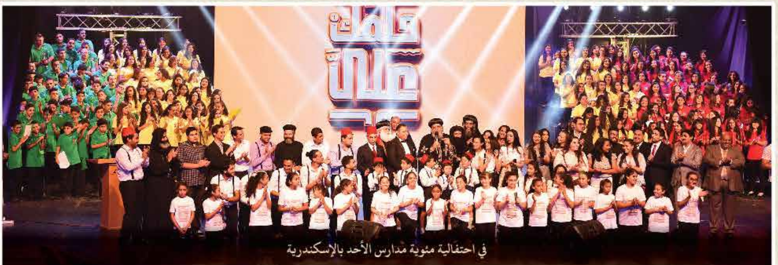
في احتفالية مئوية مدارس الأحد بالإسكندرية