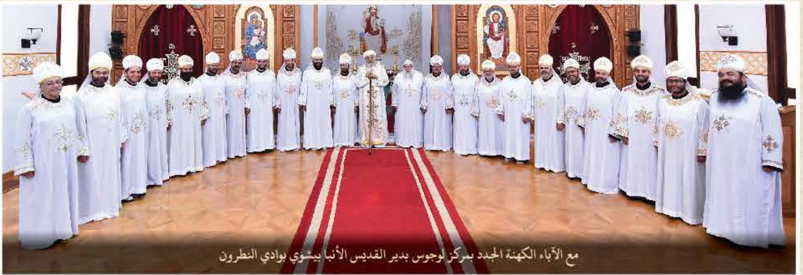
مع الآباء الكهنة الجدد بمركز لوجوس بدير القديس الأنبا يشوي بوادي النطرون