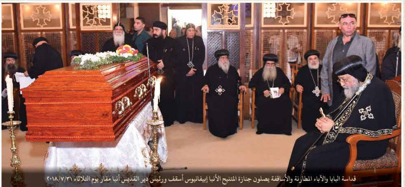
قداسة البابا والآباء المطارنة والأساقفة يصلون جنازة المتبجح الأنبا إيفانيوس أسقف ورئيس دير القديس أنبا مقار يوم الثلاثاء ٢٠١٨/٧/٣١