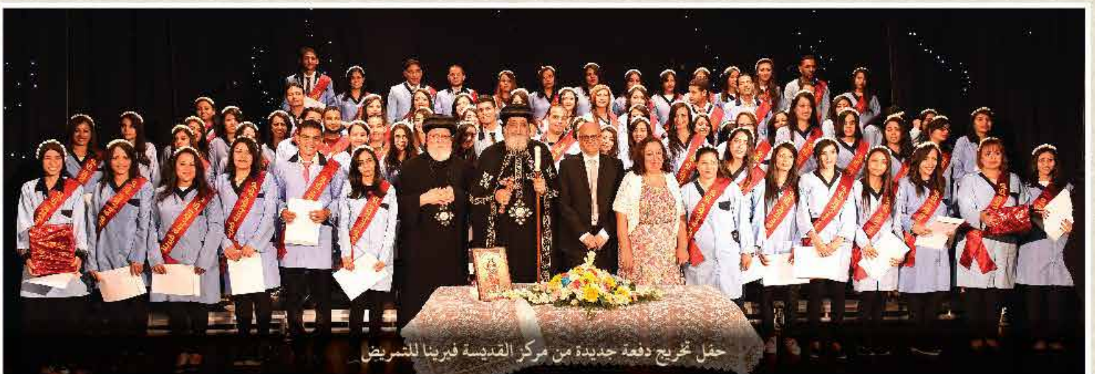
حفل تخرج دفعة جديدة من مركز القديسة فبرينا للتشريض