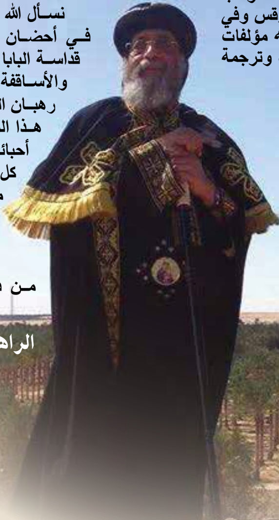
الراهب يوحنا المقاري

نسأل الله أن ينيح روحه الطاهرة في أحضان القديسين، وأن يعزي قداسة البابا ومجمع الآباء المطارنة والأساقفة، والكهنة، وأولاده رهبان الدير، ومصر كلها في هذا المصاب الفادح، بل وكل أحبائه وعارفي فضله في كل أنحاء العالم، وأن يهبنا من يصلح لاستكمال مسيرته، ويكشف الجاني من أجل خلاص نفسه، ونجاته من دينونة الله الرهيبة.