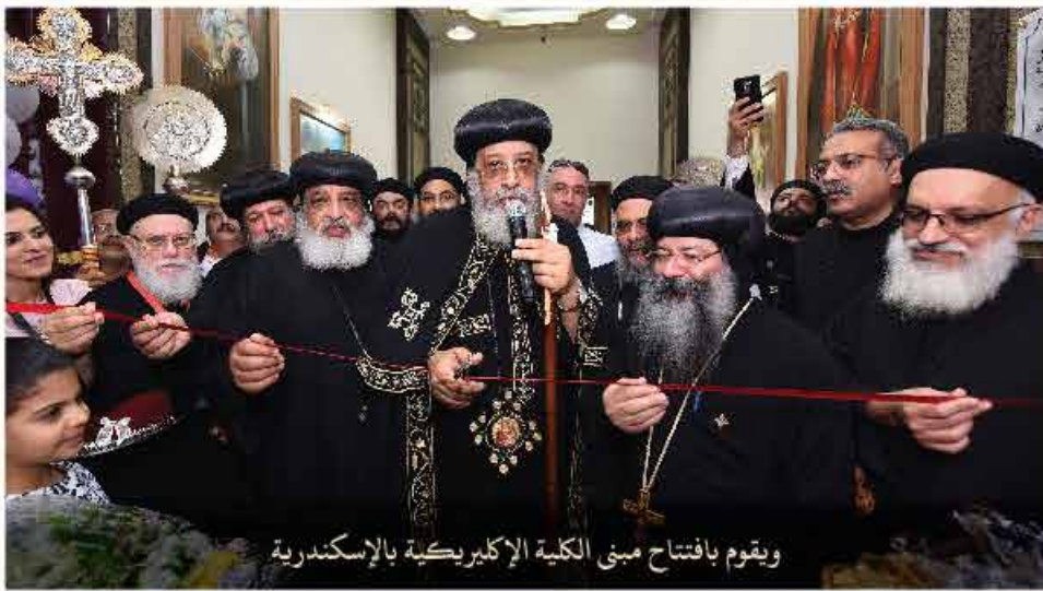
ويقوم بافتتاح مبنى الكلية الإكليريكية بالإسكندرية