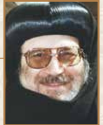
زيارة البابا بيشوي طران كنيسة شيخ وبياطر بلدي

كثيراً ما تواجهنا أمور محيرة في الخدمة. ربما سبب الحيرة الغيرة على خلاص أنفس المخدمين. أو يكون سبب الحيرة وجود صعاب أو مخاوف أو تهديدات. أو يكون سبب الحيرة عدم وضوح إرادة الرب في بعض الشئون أو المشاكل. أو يكون سبب الحيرة تضارب مصالح المخدمين أو تضارب رؤيتهم لما هو صالح أو مفيد. أو يكون سبب الحيرة هو وجود عدة مطالب في الخدمة يتعذر تحقيقها في وقت واحد، مثل التعارض بين السفر والاعتكاف، أو التعارض بين كثرة الأنشطة، وبين التركيز في الخدمة في أنشطة محددة. أو يكون سبب الحيرة في خدمة الأب الأسقف هو بين سيامة بعض الأشخاص في رتبة القسيسية أو الشماسية الكاملة، وبين عدم سيامتهم.