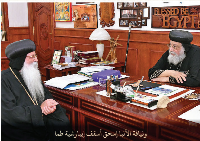
ونيافة الأنبا إسحق أسقف إبارشية طما