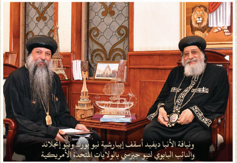
ونيافة الأنبا ديفيد أسقف إبارشية نيويورك ونيو إنجلاند والنائب البابوي لنيو جيرسي بالولايات المتحدة الأمريكية