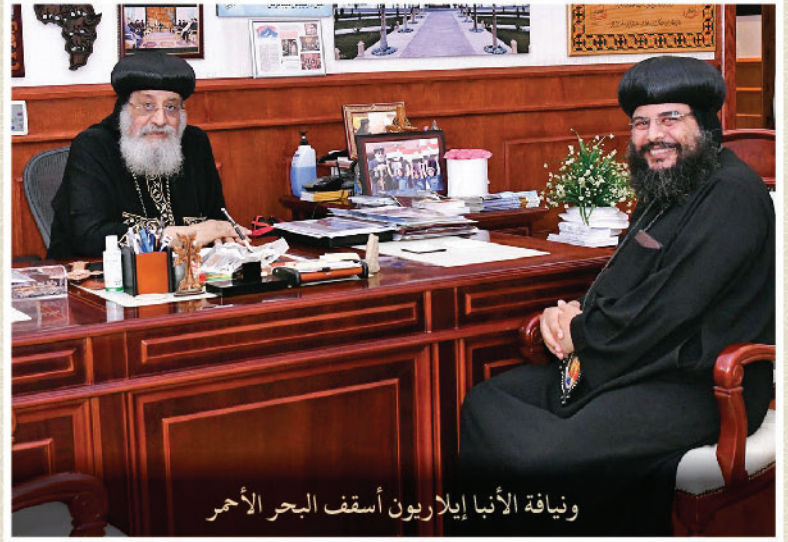
ونيافة الأنبا إيلاريون أسقف البحر الأحمر