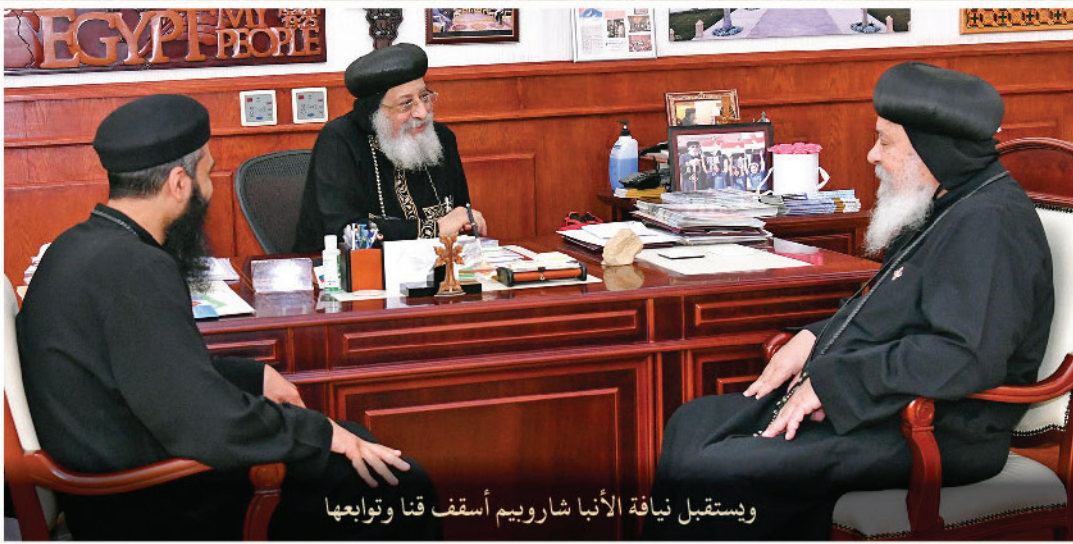
ويستقبل نيافة الأنبا شاروويم أسقف قنا وتواجها