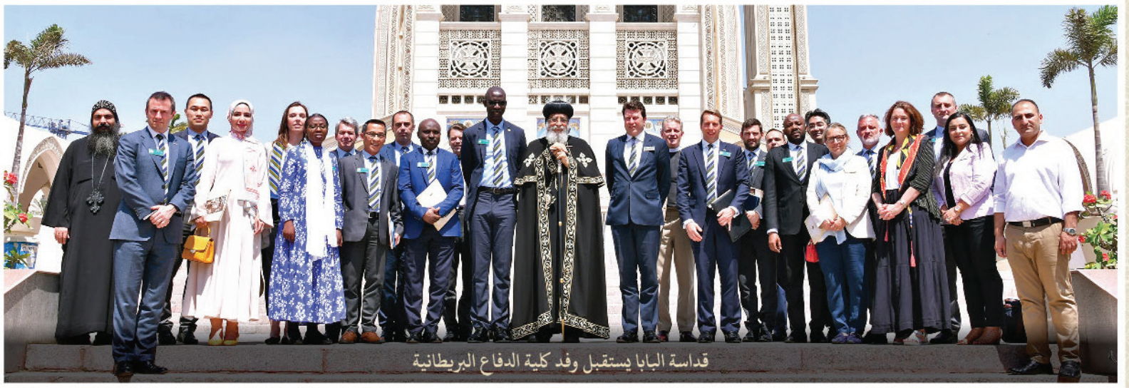
قداسة البابا يستقبل وفد كلية الدفاع البريطانية