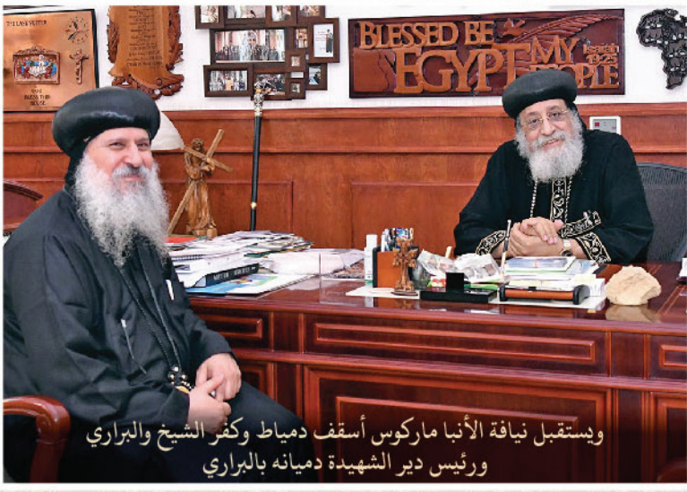
وإستقبل نيافة الأنبا ماركوس أسقف دمياط وكفر الشيخ والبراري ورئيس دير الشهيد دميانه بالبراري