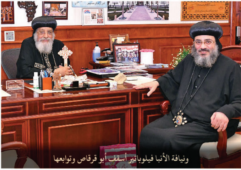
ونيافة الأنبا فيلوباتير أسقف أبو قرقاص وتوابعها