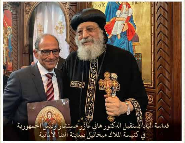
قداسة البابا كاستقبل الدكتور هاني عازر مستشار رئيس الجمهورية في كنيسة الملك ميخائيل بمدينة ألتنا الألمانية