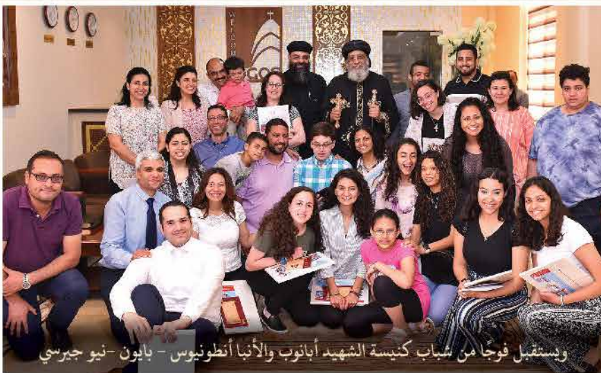
ويستقبل فوجاً من شباب كنيسة الشهيد أبانوب والأنبا أنطونيوس - بايون - نيو جيرسي