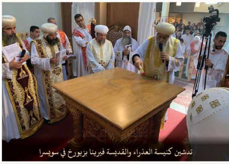
تدشين كنيسة العذراء والقديسة فيرينا بزيورخ في سويسرا