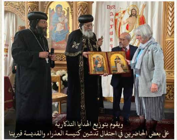
ويقوم بتوزيع الهدايا التذكارية على بعض الحاضرين في احتفال تدشين كنيسة العذراء والقديسة فيرينا