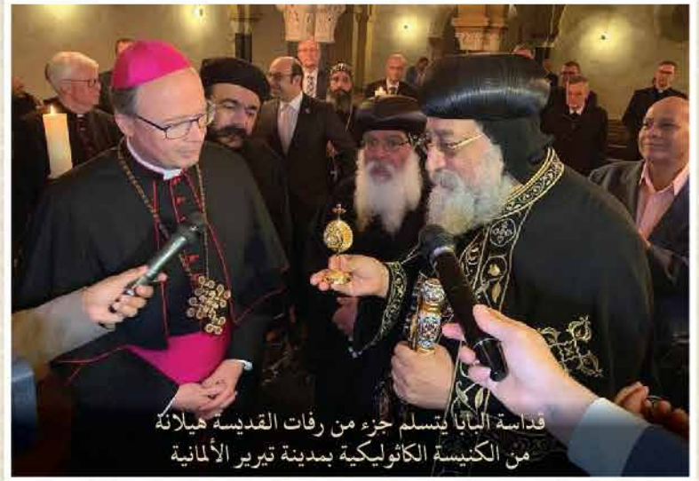
قداسة البابا يتسلم جزء من رفات القديسة هيلانة من الكنيسة الكاثوليكية بمدينة تيرير الألمانية