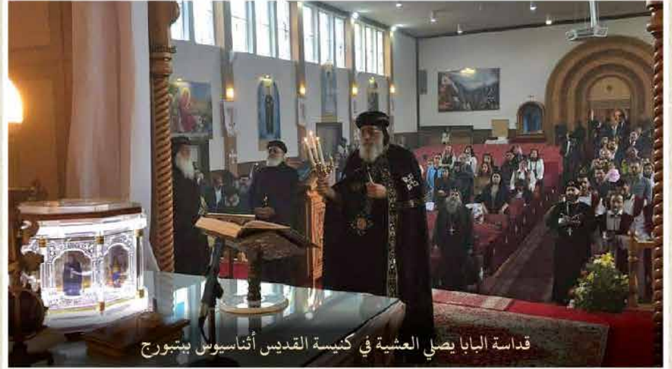
قداسة البابا يصلي العشية في كنيسة القديس أنثاسيوس ببتوج