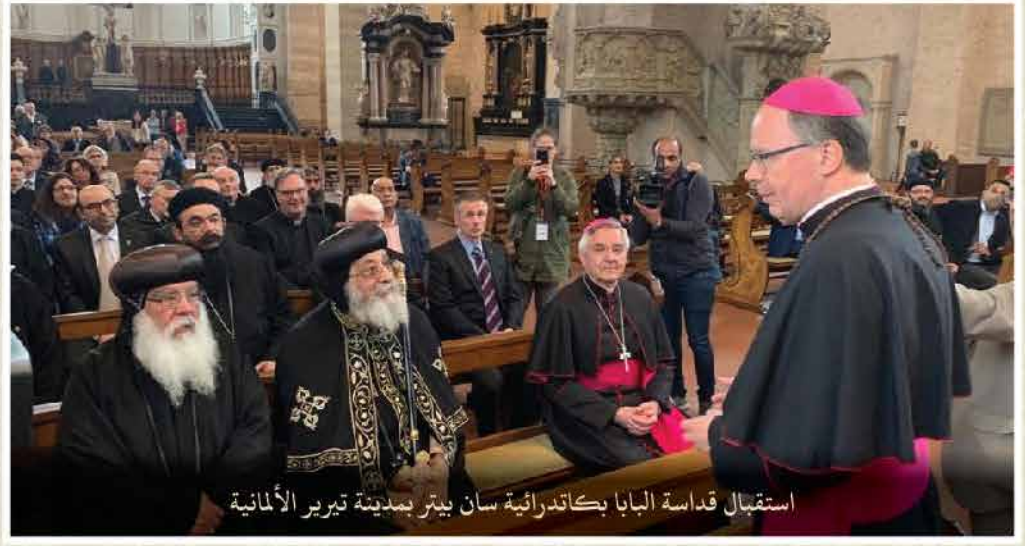
استقبال قداسة البابا بكاتدرائية سان بيتر بمدينة تيرير الألمانية