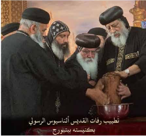
تطبيب رفات القديس أنثاسيوس الرسولي بكنيسته ببتوج