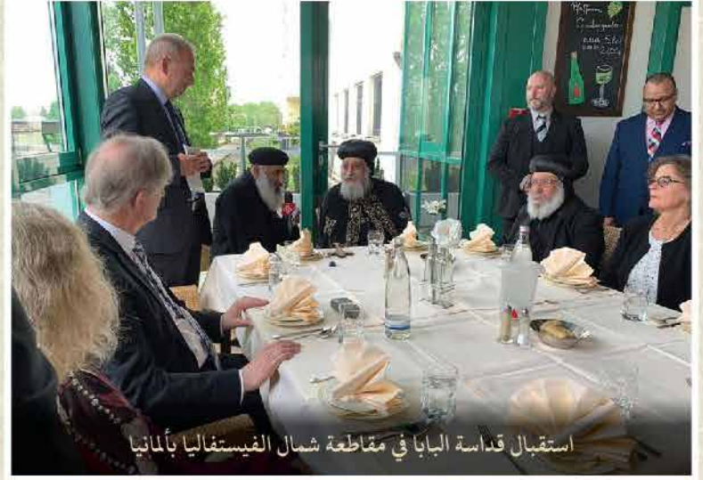
استقبال قداسة البابا في مقاطعة شمال الفيستفاليا بألمانيا