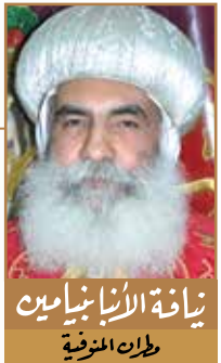
نيافة الأنبا بنامين طران المنوفية

النصرة المتهللة.. يقول ذهبي القم: "حقاً سيقوم الكل في قوة وعدم فساد، ولكن في هذا المجد الذي بلا فساد لا يتمتع الكل بذات الكرامة والأمان. ومع وجود قيامة واحدة لكن توجد اختلافات ضخمة في الكرامة من جسد لآخر".