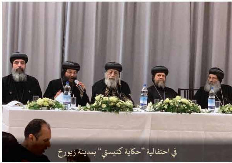
في احتفالية "حكاية كنيسة" بمدينة زيورخ