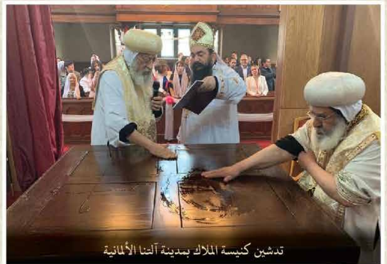
تدشين كنيسة الملك بمدينة ألتنا الألمانية