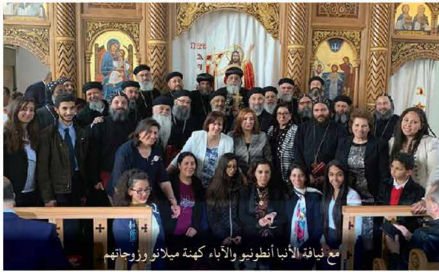
مع نيافة الأنبا أنطونيوس والآباء كهنة ميلانو وزوجاتهم