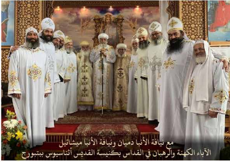
مع نيافة الأنبا دميان ونيافة الأنبا ميشائيل الآباء الكهنة والرهبان في القديس بكنيسة القديس أنثاسيوس ببتوج