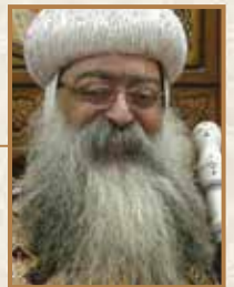
يافّة (الابناتكلا) أسقف دشنا