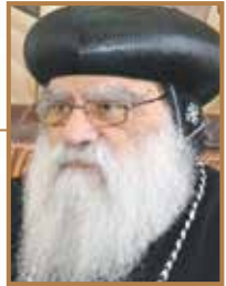
نيافة البابا بنهوميوس طران هجرية در طبريز وشمال افريقيا