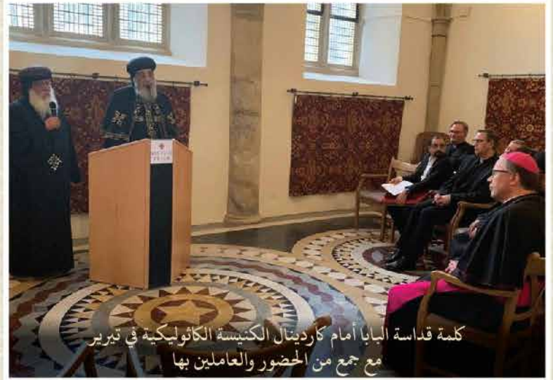
كلمة قداسة البابا أمام كاردينال الكنيسة الكاثوليكية في تيرير مع جمع من الحضور والعاملين بها