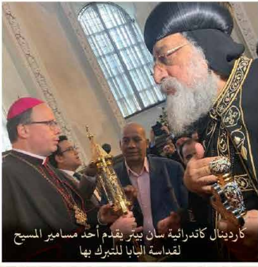
كاردينال كاتدرائية سان بيتر يقدم أحد مسامير المسيح لقداسة البابا للتبرك بها