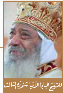
الشيخ البابا الأنبا شنودة الثالث

مجلة الكرازة ٥ ديسمبر ٢٠٠٣م - العددان ٣٩-٤٠