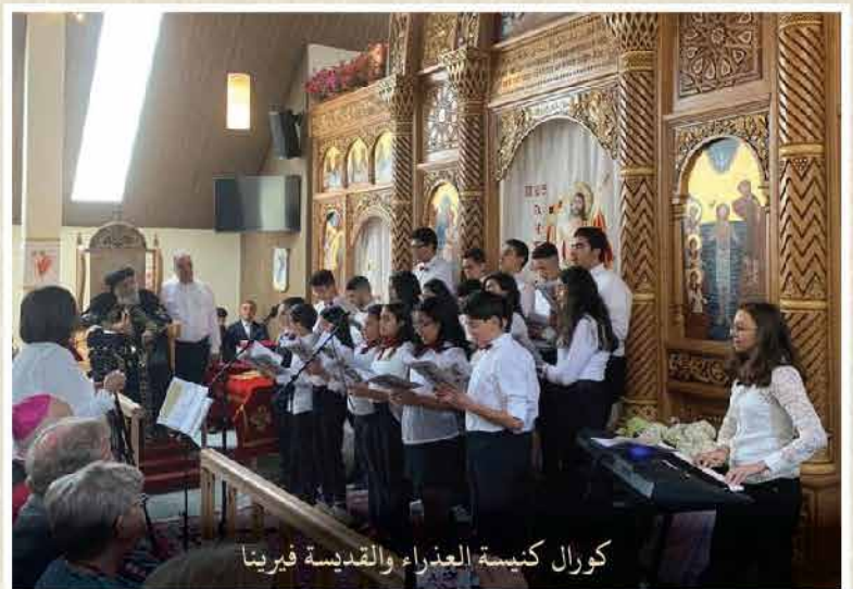
كورال كنيسة العذراء والقديسة فيرينا