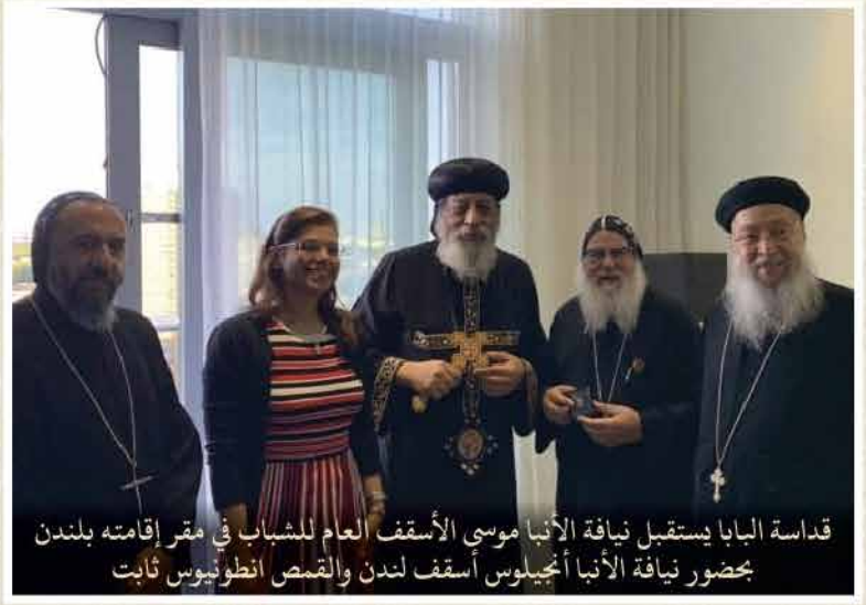
قداسة البابا يستقبل نيافة الأنبا موسى الأسقف العام للشباب في مقر إقامته بلندن بحضور نيافة الأنبا أنجيلوس أسقف لندن والقمص انطونيوس ثابت