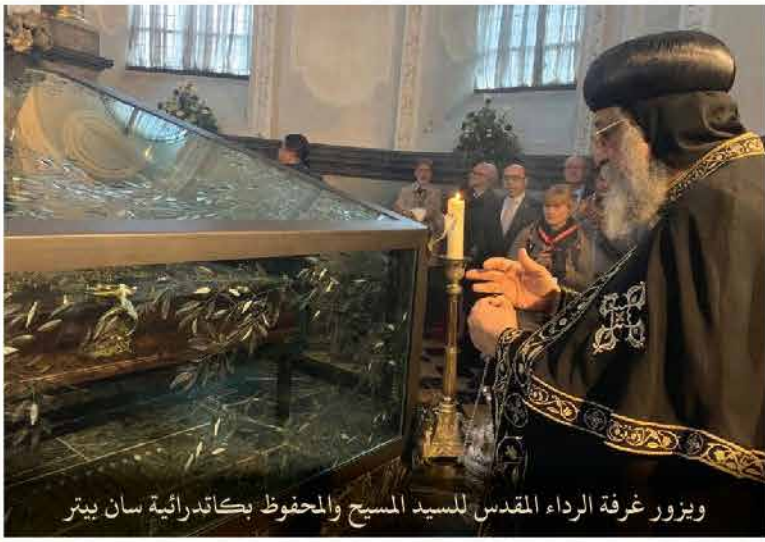
ويزور غرفة الرداء المقدس للسيد المسيح والمحفوظ بكاتدرائية سان بيتر