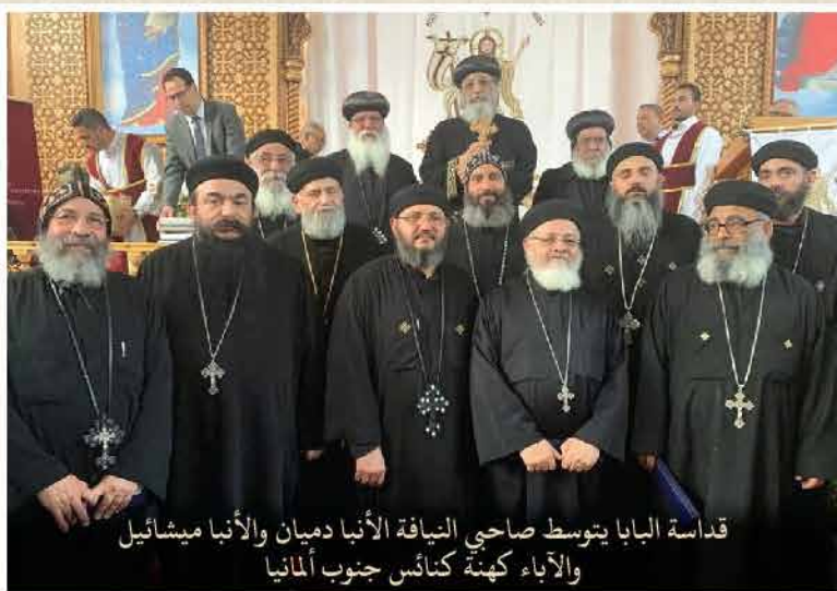
قداسة البابا يتوسط صاحبي النيافة الأنبا دميان والأنبا ميشائيل والآباء كهنة كنائس جنوب ألمانيا