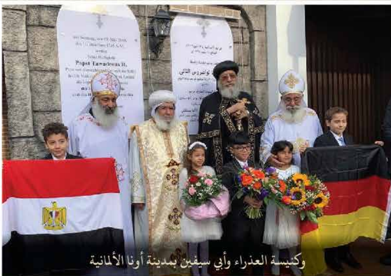
وكنيسة العذراء وأي سيفين بمدينة أونا الألمانية