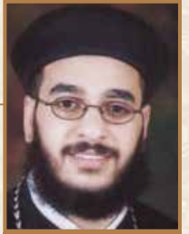
القسّ القبطي القديس حنا كنيسة الأناجيل بولندا الأثيون، بولندا

الله لخليقته بل الفرح والسعادة. ولكن الإنسان يمرض عندما ينتهك طبيعته الخاصة ويفسد قوانين الطبيعة أيضًا. ومن هنا جاء في الكتاب المقدس ذلك الربط بين المرض والخطية «لا تعود تخطئ لئلا يكون لك أشر». ليس بمعنى أن المرض نتيجة مباشرة لخطية يصنعها الإنسان، أو عقاب من الله نتيجة أفعاله. ولكن المقصود هنا أن المرض حلّ وساد، عندما أفسد الإنسان طبيعته، وأساء لنظام الكون من حوله. فتحولت الخليقة لتكون سببًا لشقائه وألمه، بدلًا من أن تكون مصدرًا لفرحه وسعادته. ولذلك تُخصّص الكنيسة صلاة خاصة (سر مسحة المرضى) لنصلي من أجل شفاء المرضى، ونطلب العلاج ليس فقط للجسد، ولكن رجوع الإنسان لله «إن كان قد فعل خطية تُغفر له». ما نحتاجه بالأولى ليس هو شفاء وقتي للجسد (مرض الجسد)، ولكن شفاء كليّ للكيان وأبدّي للإنسان. «تباركت أيها الرب إلهنا الصالح طيب أنفسنا، بجراحاتك شُفينا أيها الراعي الصالح» (مسحة المرضى). لقد جاء الرب يسوع ليشفى الإنسان «أتى بصيرًا». عندها يصبح المرض والألم في العالم، مجرد أدوات تدفعنا نحو الطبيب الصالح، تهذب ما تمرّد من طبيعتنا، وتصلح حياتنا «من تألم بالجسد كُف عن الخطية»، وتكفل جهادنا (إكليل الحياة). فالعلاج الحقيقي ليس تخلصًا من الأم الجسد (العرض)، ولكن تجديدًا للكيان كله من الخطية (المرض) بالتوبة والرجوع لله، انتظرًا لعداء أجسادنا (رو ٨: ٢٣).