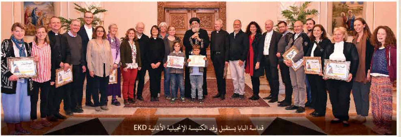
قداسة البابا يستقبل وفد الكنيسة الإنجيلية الألمانية EKD