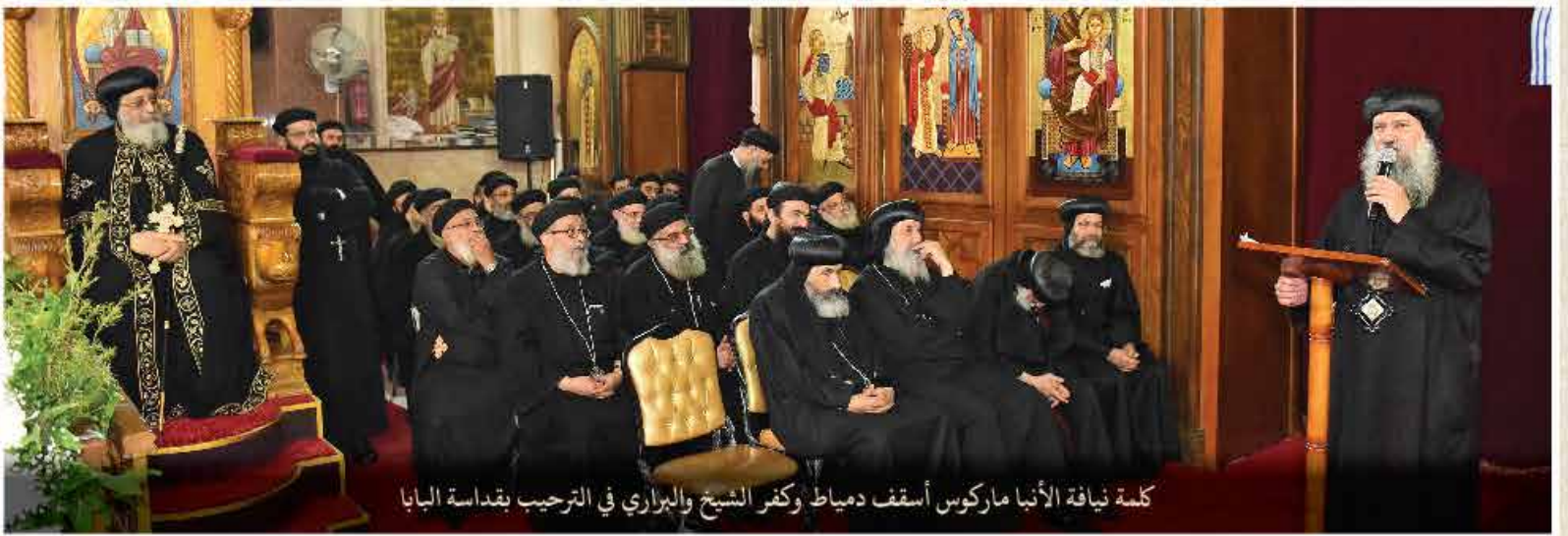
كلمة نيافة الأنبا ماركوس أسقف دمياط وكفر الشيخ والبراري في الترحيب بقداسة البابا