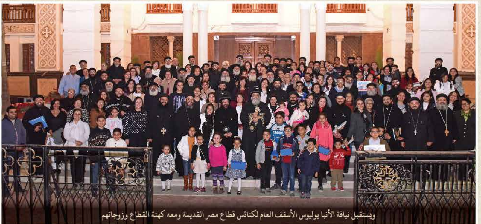
ويستقبل نيافة الأنبا يوليوس الأسقف العام لكنائس قطاع مصر القديمة ومعه كهنة القطاع وزوجاتهم