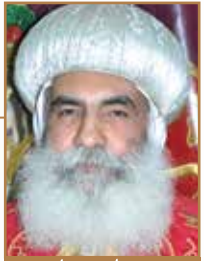
زيارة الأنبا بنامين مطارن المنوفية

والقدس أغسطينوس يوصي قائلاً: "ليكن لكم الإيمان العامل بالحب الإلهي فإن هذا هو ثوب العرس.. يا مَنْ تحبون المسيح، وتحبون بعضكم بعضاً، وكذلك الأصدقاء، بل حتى الأعداء. ولا يكون هذا ثقلاً عليكم". بل يرى الأب غريغوريوس الكبير أن ثوب العرس يُنسج بين عارضتين هما: محبة الله ومحبة القريب، لأن الحب المقدس هو طبيعة النفس التي لا تقدر أن تفصل محبة الله عن محبة القريب. ولخطورة هذا الأمر نقتني المحبة المتكاملة لله وللناس، ونسهر عليه بالصلوات كما في نصف الليل: "ها هوذا الختن يأتي في نصف الليل، فطوبى للعبد الذي يجده مستيقظاً، أما الذي يجده متغافلاً فإنه غير مستحق المضي معه. فانظري يا نفسي لئلا تُثقلني نوماً فثقلني خارج الملكوت، بل إسهرى..."