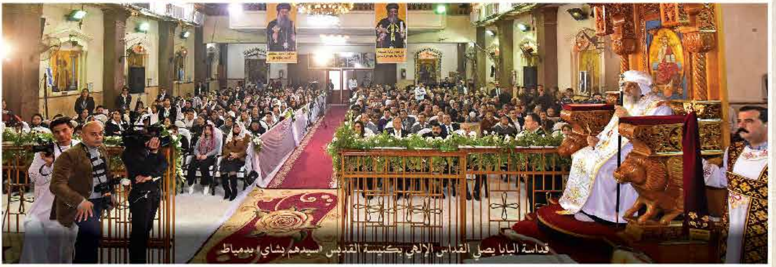
قداسة البابا يصلي القديس الإلهي بكنيسة القديس سيدهم بشاي دمياط