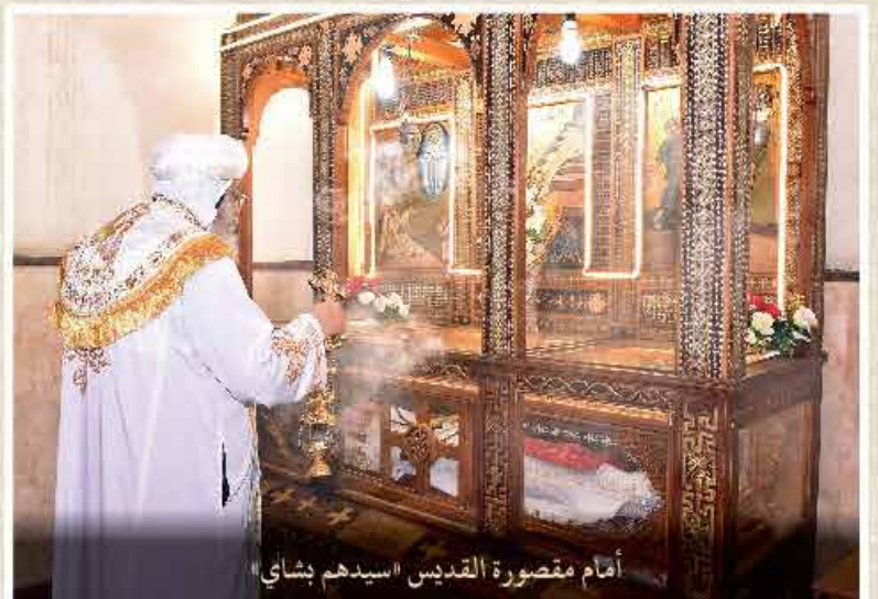
أمام مقصورة القديس سيدهم بشاي