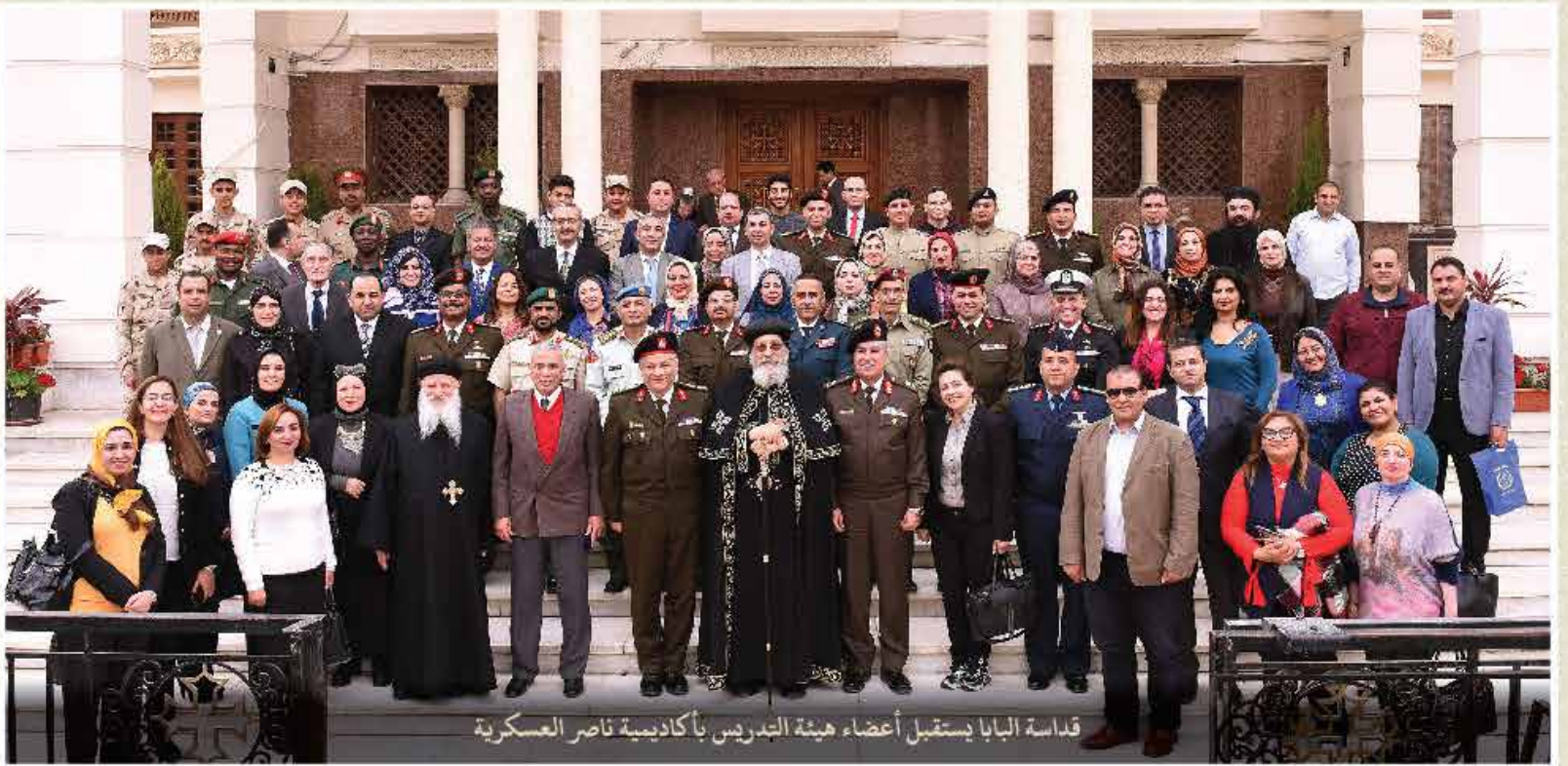
قداسة البابا يستقبل أعضاء هيئة التدريس بأكاديمية ناصر العسكرية