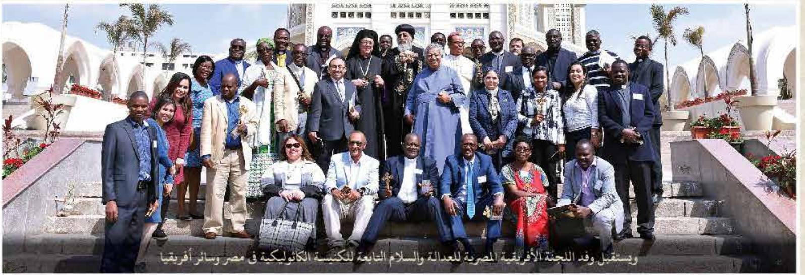
ويستقبل وفد اللجنة الأفريقية المصرية للعدالة والسلام التابعة للكنيسة الكاثوليكية في مصر وسائر أفريقيا