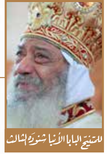
السيخ البابا الأنبا شموئيل الثاني

آمن أن حياتك في يد الله، تمتلئ سلامًا، أما إن شعرت أن حياتك في أيدي الناس، فحينئذ ستفقد سلامك.