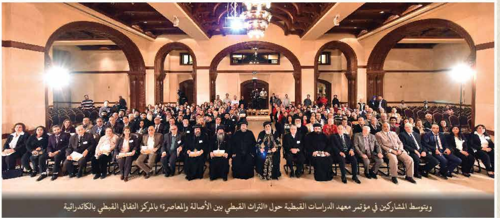
ويتوسط المشاركين في مؤتمر معهد الدراسات القبطية حول «التراث القبطي بين الأصالة والمعاصرة» بالمركز الثقافي القبطي بالكاتدرائية