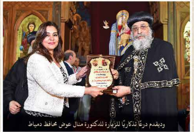
وديقدم درعاً تذكاريًا للزيارة للدكتورة منال عوض محافظ دمياط