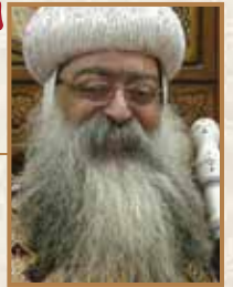
نيافة الأنبا تكلا أسقف دشنا

٥- إن الله قادر على كل شيء ولا يعسر عليه أمر: حتى ولو كان المرض قد طال ومعه استحالة الشفاء.. فمن الذي سيلقي هذا المخلع في البركة متى تحرك الماء؟ ولكن بكلمة واحدة شُفي دون احتياج لعلاج، فبكلمة خلق الله العالم، وبكلمة يهب الشفاء للمرضى والحياة للموتى، فاجعل تقنك فيه.