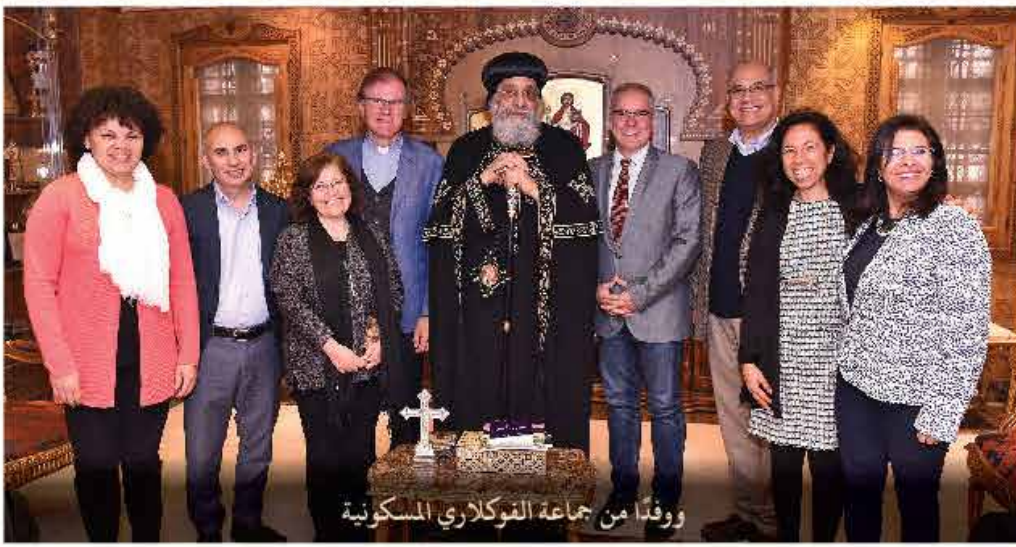
وفداً من جماعة التوكلاري المسكونية