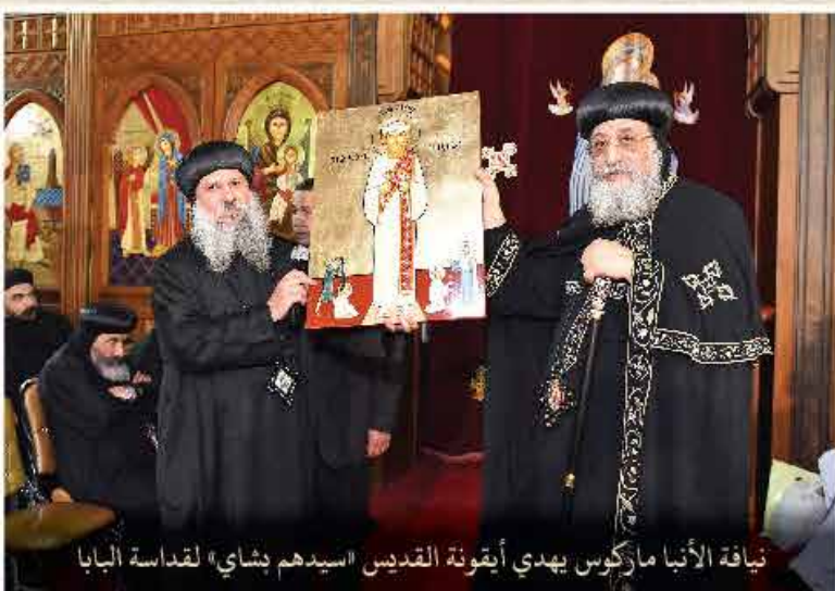
نيافة الأنبا ماركوس يهدي أيقونة القديس سيدهم بشاي لقداسة البابا