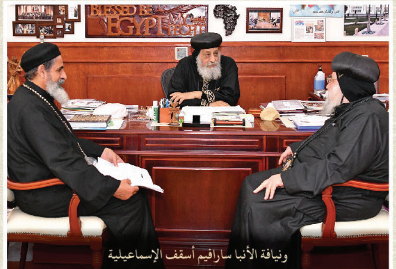
نيافة الأنبا سارافيم أسقف الإسماعيلية