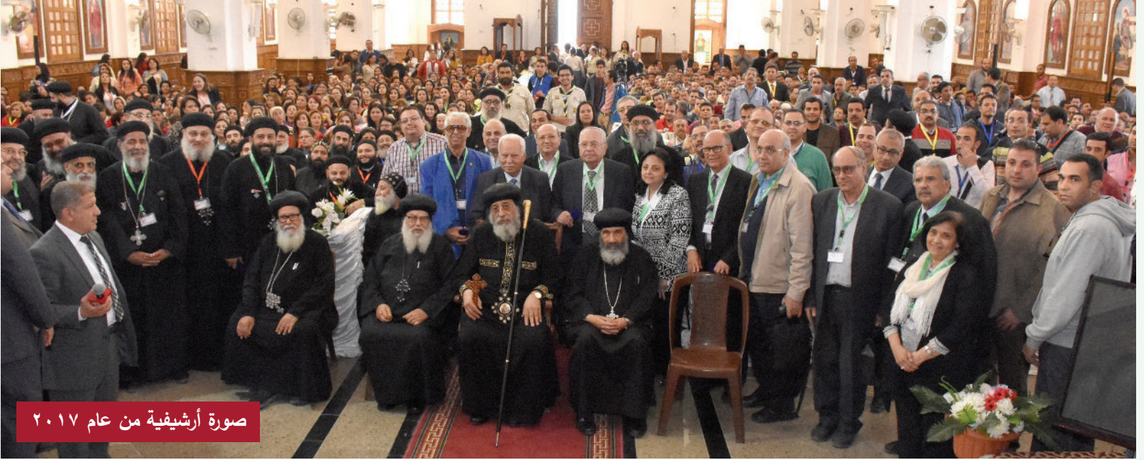
صورة أرشيفية من عام ٢٠١٧

ومجتمعية بشكل ما، فإن من يخدمونهم يحتاجون لتأهيلهم بما يتناسب مع هذا النوع من الخدمة.