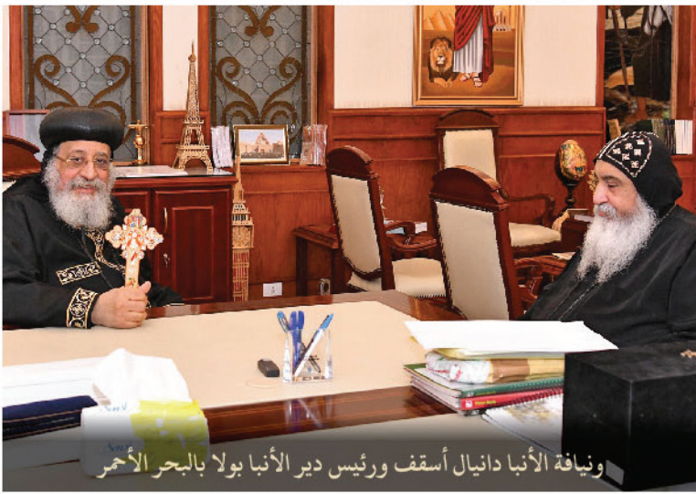
نيافة الأنبا دانيال أسقف ورئيس دير الأنبا بولا بالبحر الأحمر