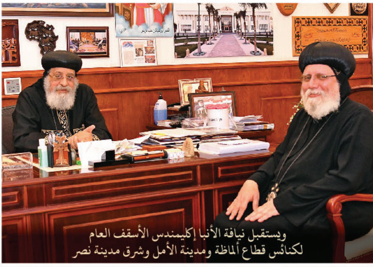
ويستقبل نيافة الأنبا إكليمندس الأسقف العام لكنائس قطاع أمانة ومدينة الأمل وشرق مدينة نصر