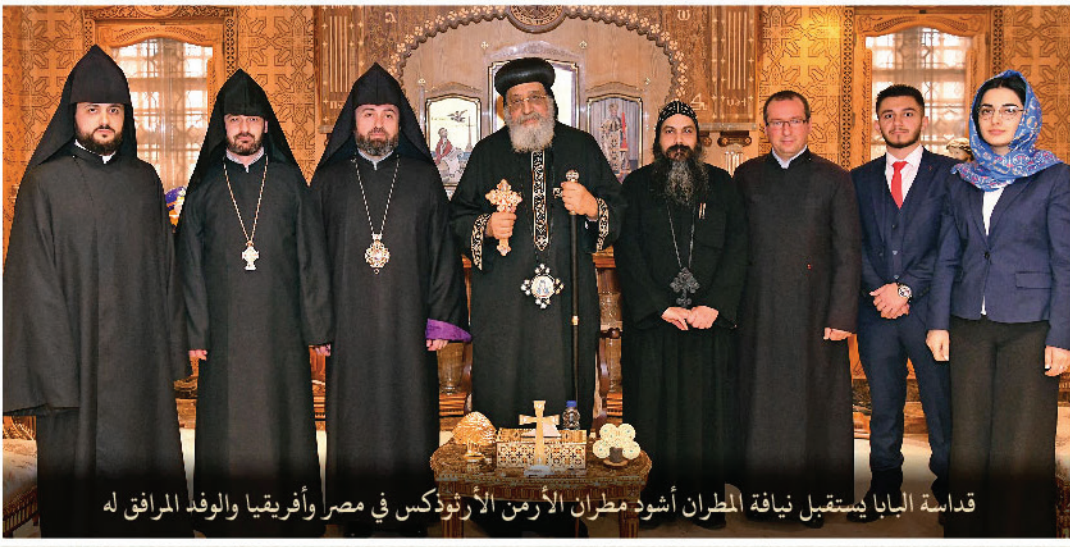
قداسة البابا يستقبل نيافة المطران أشود مطران الأرثوذكس في مصر وأفريقيا والوفد المرافق له