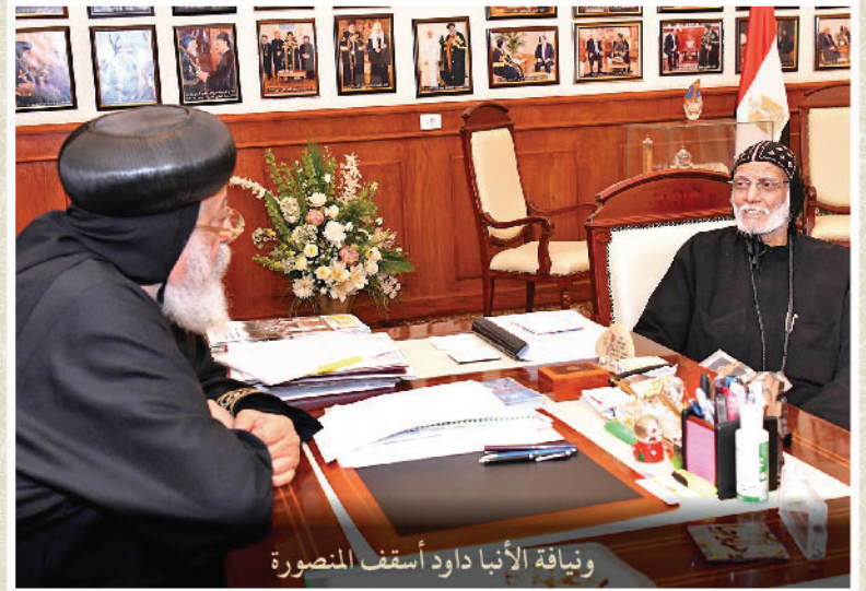
نيافة الأنبا داود أسقف المنصورة