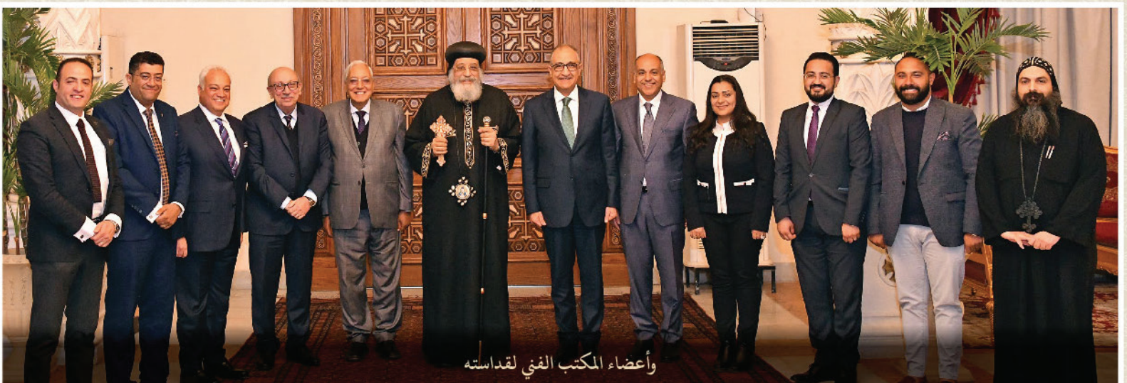
وأعضاء المكتب الفني لقساسته