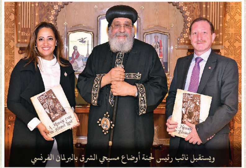
ويستقبل نائب رئيس لجنة أوضاع مسيحي الشرق بالبرلمان الفرنسي