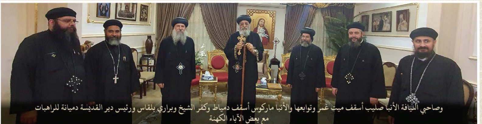
وصاحي النيابة الأنبا صليب أسقف ميت عمر وتوابعا والأنبا ماركوس أسقف دمياط وكفر الشيخ وبراري بلقاس ورئيس دير القديسة دميانة للراهبات مع بعض الآباء الكهنة