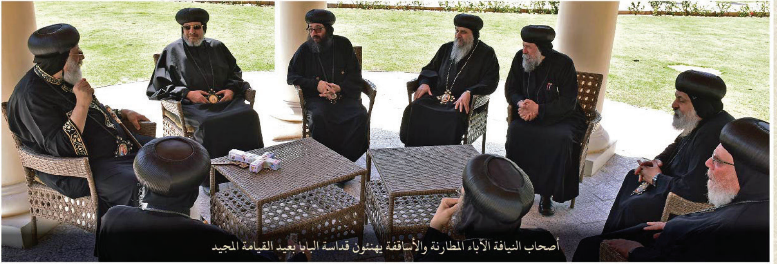
أصحاب النيابة الآباء المطارنة والأساقفة يهنئون قداسة البابا بعيد القيامة المجيد