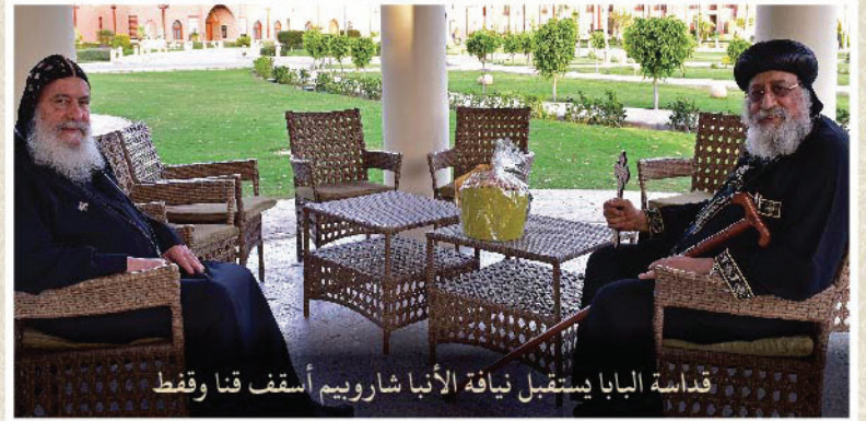
قداسة البابا يستقبل نيافة الأنبا شارويم أسقف قنا فقط