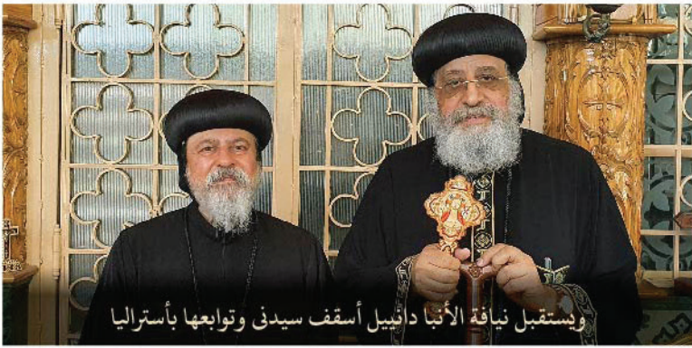
ويستقبل نيافة الأنبا دانييل أسقف سيدني وتوابعا بأستراليا