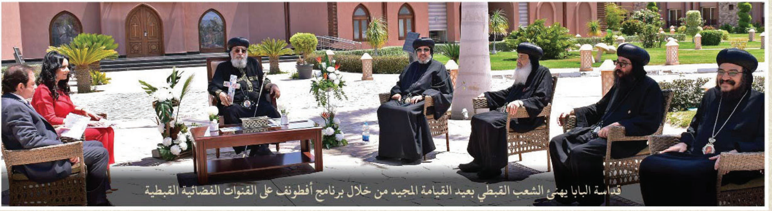
قداسة البابا يهنئ الشعب القبطي بعيد القيامة المجيد من خلال برنامج أفطونف على القنوات الفضائية القبطية