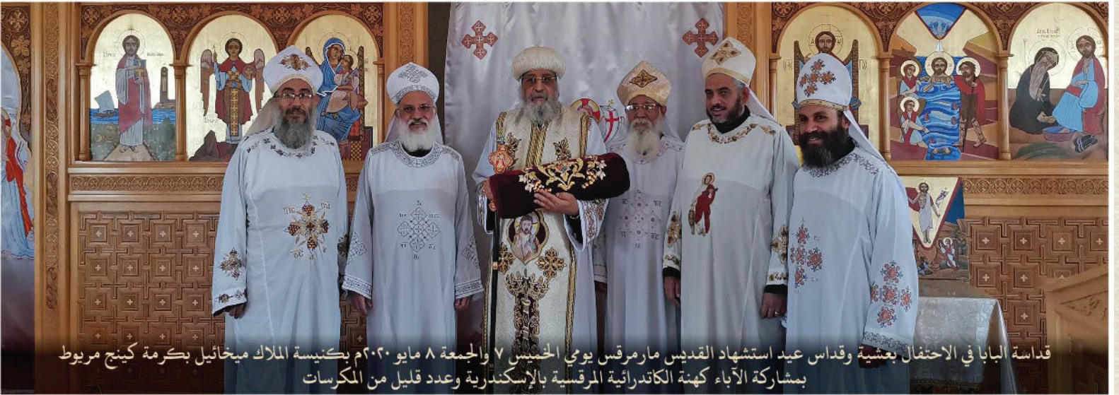
قداسة البابا في الاحتفال بعشية وقداس عيد استشهاد القديس مارمرقس يومي الخميس ٧ والجمعة ٨ مايو ٢٠٢٠م بكنيسة الملك ميخائيل بكرمة كينج مربوط بمشاركة الآباء كهنة الكاتدرائية المرقسية بالإسكندرية وعدد قليل من المكرسات