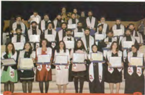
ويحضر الاحتفال بمرور ١٥ عاما على إنشاء الأناطورا