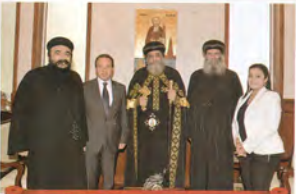
ونيافة الانبا سوريال اسقف مشورن ومعه السفير الامترائي بالقاهرة