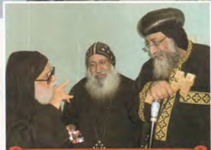
لقاء قداسة البابا مع المنسحق الابن مينايل عقب جلوس قداسه