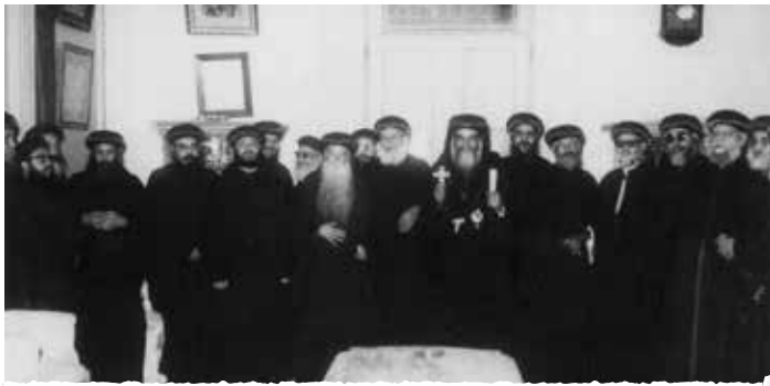
المجمع المقدس في عهد البابا كيرلس السادس

أثناء الظهورات الإلهية سنة ٢٠٠٠ التي كانت في كنيسة مارمرقس (بأسيوط)، وطبعاً أشرطة الفيديو موجودة، كل الناس كانت بتيجي من كل القطر ومن الخارج القطر، فنيافة الأنبا ميخائيل كان يقول لأحد الآباء يعدي عليه الساعة ١٢ بالليل، ويروح بعد الساعة ١٢ بالليل يدخل من الباب الجانبي لكنيسة مارمرقس ويطلع فوق السطح، ويطلع في هدوء ويصلي مزاميره، وأول ما الظهورات الإلهية كانت بتظهر كل