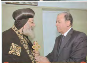
ويتمثل الكراء من التواء ابراهيم حماد محافظة اسيوط