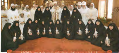
قداسة البابا يرسم راهبات جديدات لدير الشهيد مار جرجس بالطحايطبة التابع لدير الشهيد مار جرجس بمصر القديمة