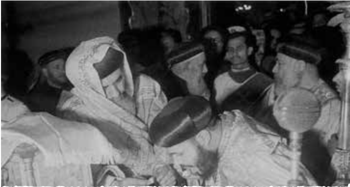
ويتناول من الأسرار المقدسة

في سفر النشيد في الإصحاح الأخير نسمع كلمة الملائكة: «مَنْ هذه الطالعة من البريّة مستندة على حبيبتها؟»... هذه نفس شيخ المطارنة وقديس المطارنة الأنبا ميخائيل، هذه نفس الأنبا ميخائيل الذي رعى رعيته في أسيوط بالطهارة والبر والتقوى، وقد كمل فيه قول الرب