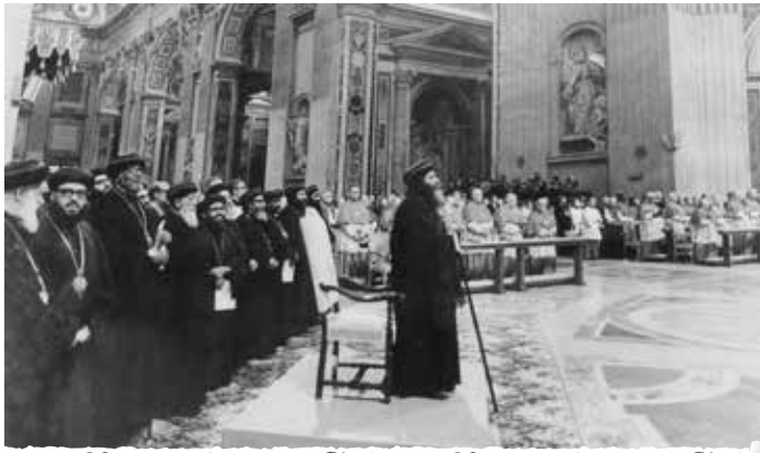
في كاتدرائية القديس بطرس بالفاتيكان