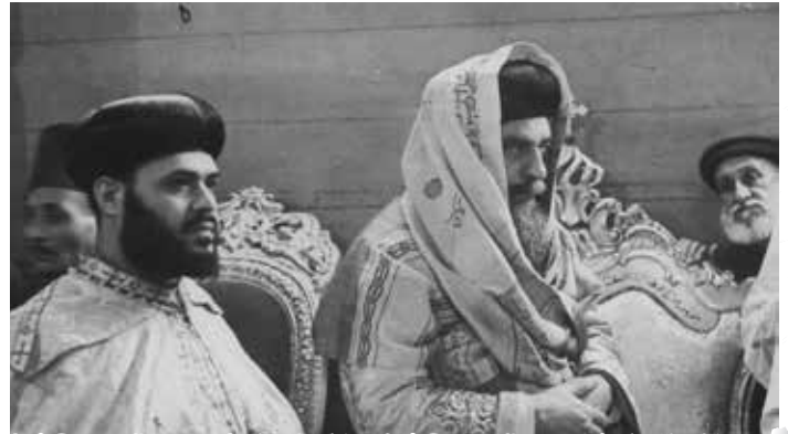
مع قداسة البابا كيرلس السادس

وفوق عمله في إيبارشية أسيوط المباركة، عمل كرئيس لدير القديس الكبير الكبير أبو مقار، وقاد هذا الدير أيضاً بمحبة واقتدار، وتلمذ عدداً كبيراً فيه من الآباء الرهبان .