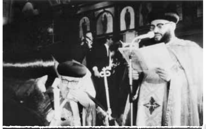
في تجليس البابا شنوده الثالث

الناس بتفرح وتهلل وتزغرد وتبص وتشوف، لكن نيافة الأنبا ميخائيل كان بيبتدي يضرب ميطنيات، كان طول فترة الظهورات الإلهية يضرب ميطنيات وكان سنه ٧٩ سنة! وأبونا يقوله: «يا سيدنا طيب السطح مليون تراب»، يقوله «أنا مستهشش أقبل تراب مارمرقس»، فكان يسجد لله شكرًا وانسحاقًا، أنا فكرت لو أنا شايف ظهورات أفتح كده وابص كده، وإنما لا.. ده كان يسجد شكرًا وانسحاقًا وتواضعًا أمام الله.