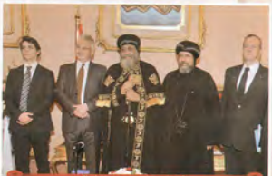
ويستقبل السيد نائبه رئيس وزراء العجم يحتضن نيافة الانبا ازميا اسقف العام