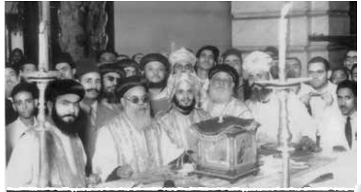
سيامة الأنبا ميخائيل بيد البابا يوساب الثاني

صلاها من أجلي، وبالْحَقِيقَة كنت أشعر وقتها أنني أنال بركات كثيرة جداً وأنال نعمة خاصة .