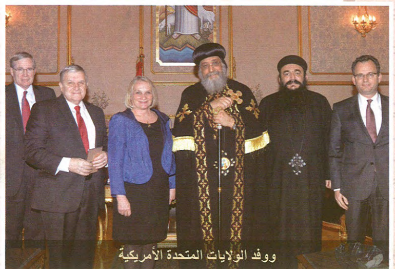
وفد الولايات المتحدة الأمريكية