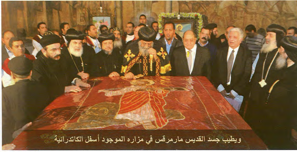
ويطيب جسد القديس مارمرقس في مزاره الموجود أسفل الكاتدرائية