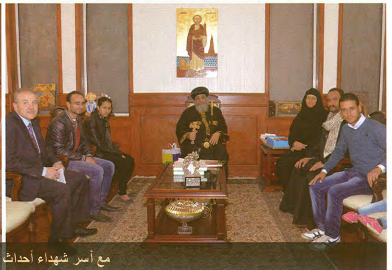
مع أسر شهداء أحداث عين شمس والمطرية