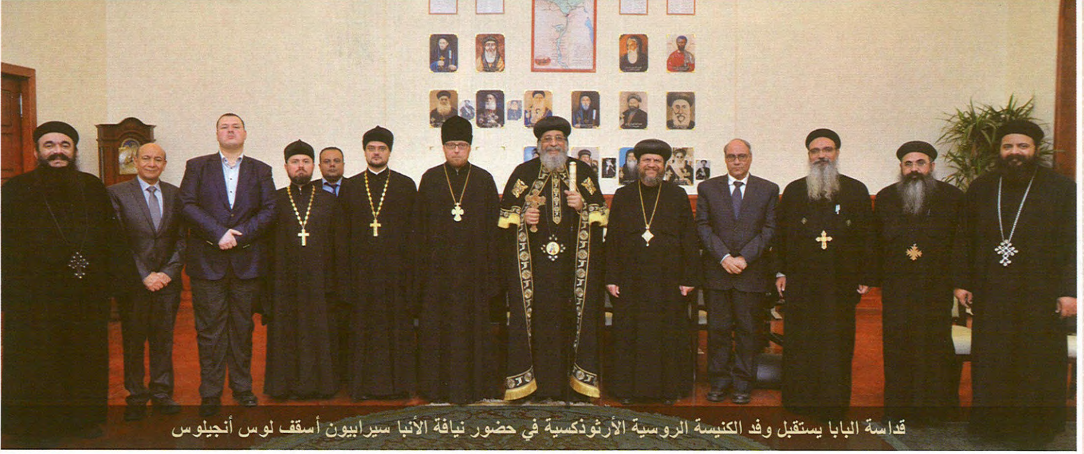
قداسة البابا يستقبل وفد الكنيسة الروسية الأرثوذكسية في حضور نيافة الأنبا سيرابيون أسقف لوس أنجلوس