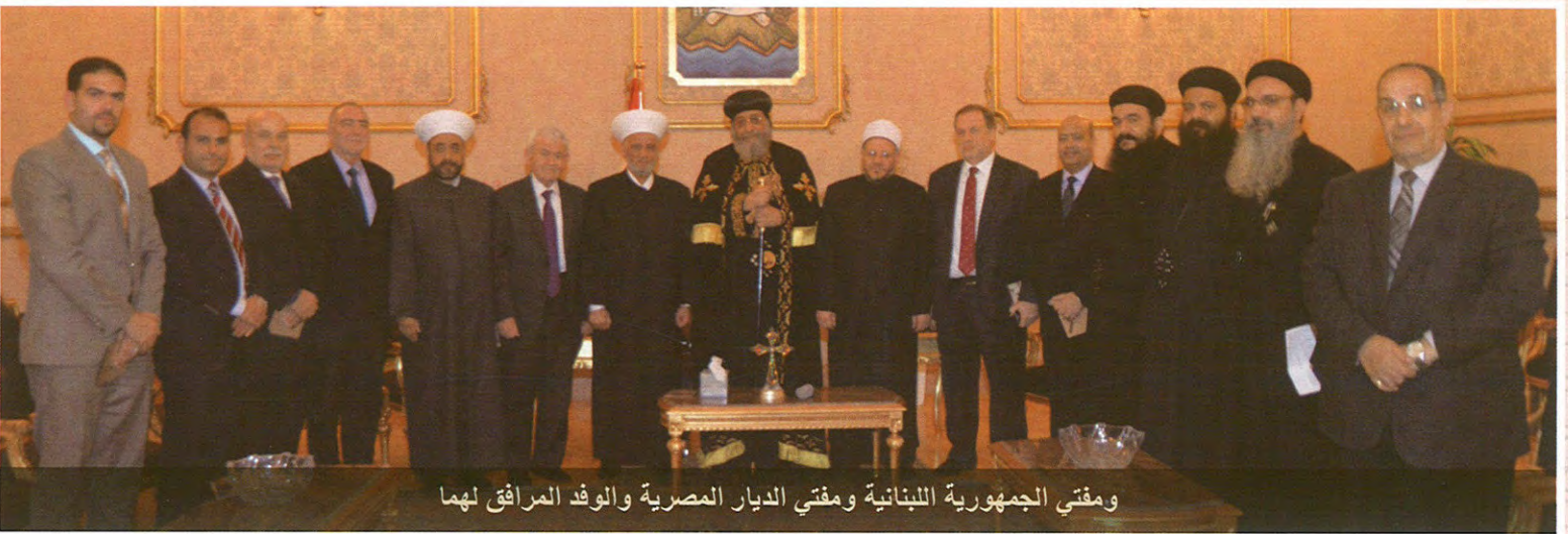
ومفتي الجمهورية اللبنانية ومفتي الديار المصرية والوفد المرافق لهما