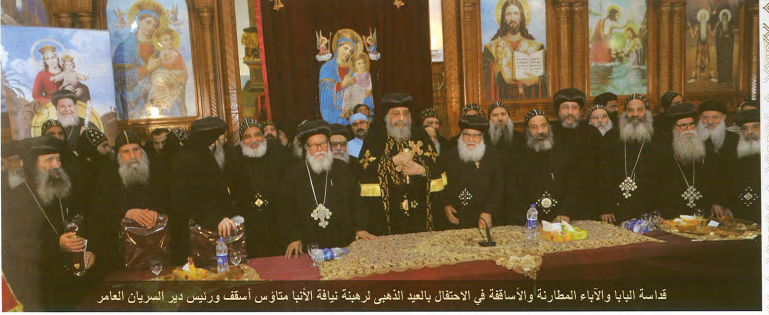
قداسة البابا والآباء المطارنة والأساقفة في الاحتفال بالعيد الذهبي لرهينة نيافة الأتبا متاؤس أسقف ورئيس دير السريان العامر