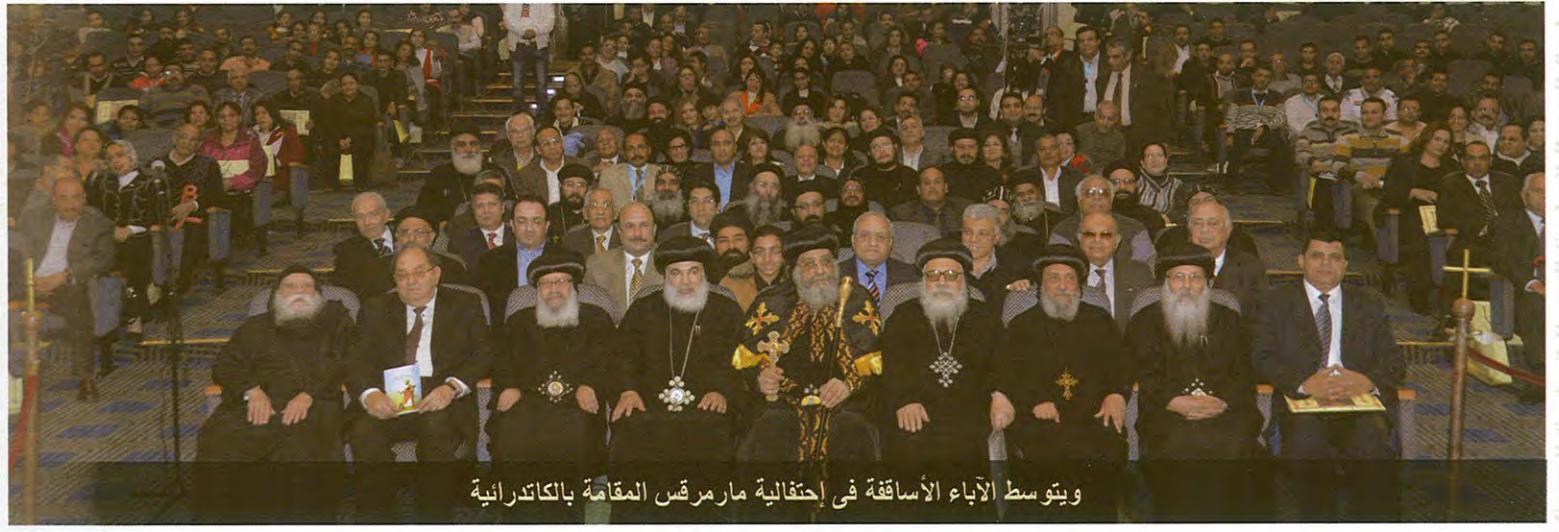
ويتوسط الآباء الأساقفة في إحتفالية مارمرقس المقامة بالكاتدرائية