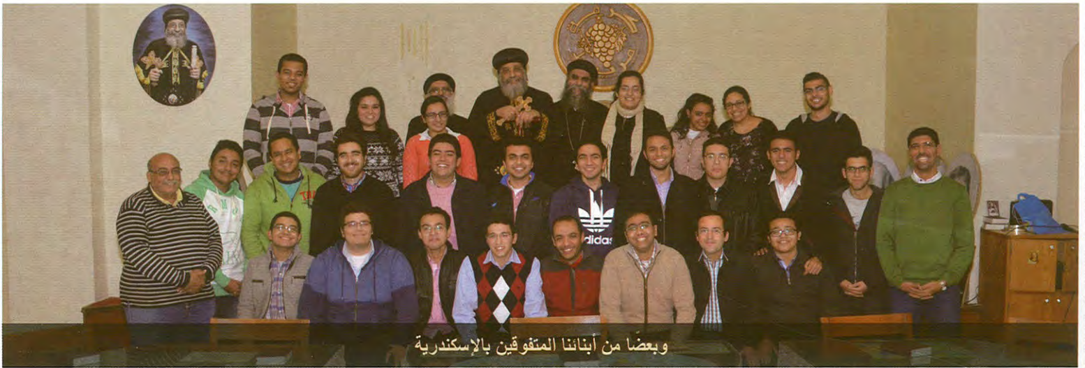
وبعضاً من أبنائنا المتفوقين بالإسكندرية