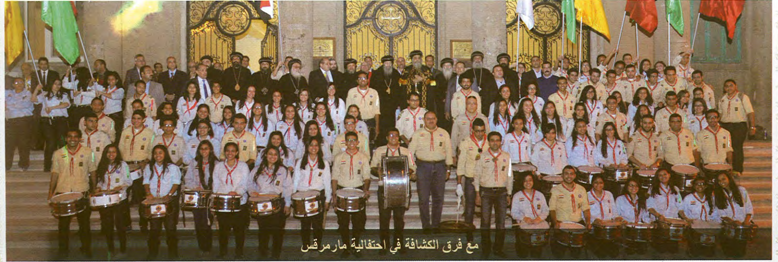
مع فرق الكشافة في إحتفالية مارمرقس