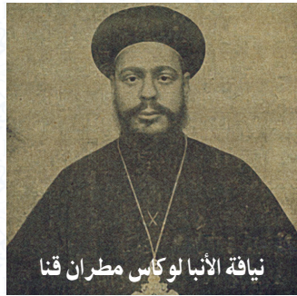
نياقة الأنبا لوكاس مطران قنا

جريدة الوقائع المصرية، وبعض الصحف، تنشر مرسوم الملك فؤاد الخاص بتعيين أعضاء مجلس الشيوخ المصري، وورد من ضمن الأسماء اسم صاحب النياقة الأنبا لوكاس مطران قنا (جريدة الأخبار، ٢٤ فبراير ١٩٢٤م؛ جريدتا الوقائع المصرية والأهرام، ٢٥ فبراير ١٩٢٤م).