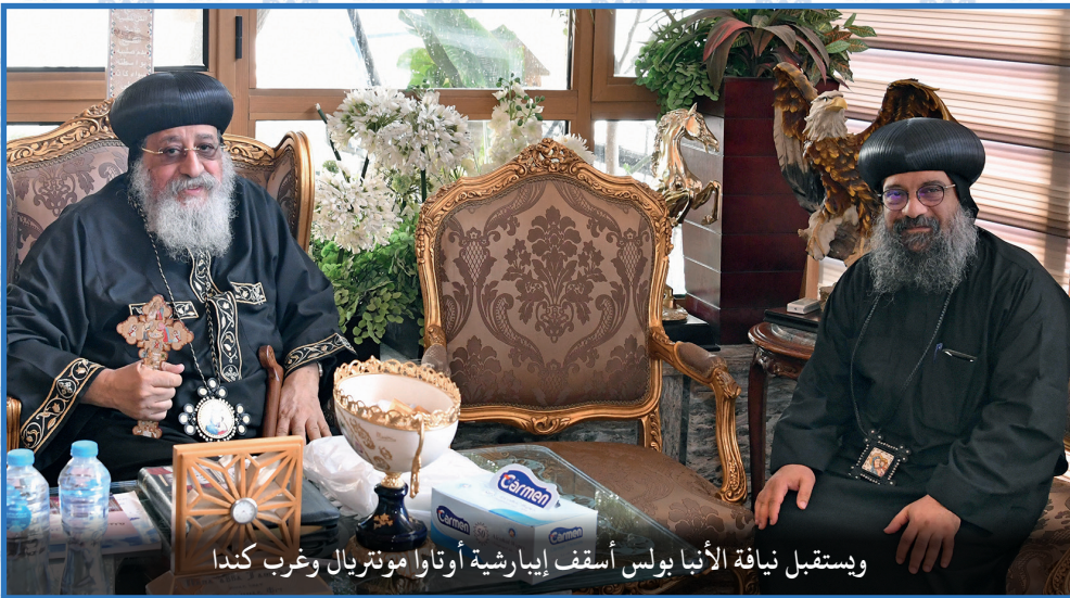
ويستقبل نيافة الأنبا بولس أسقف إبارشية أوتاوا ومونتريال وغرب كندا