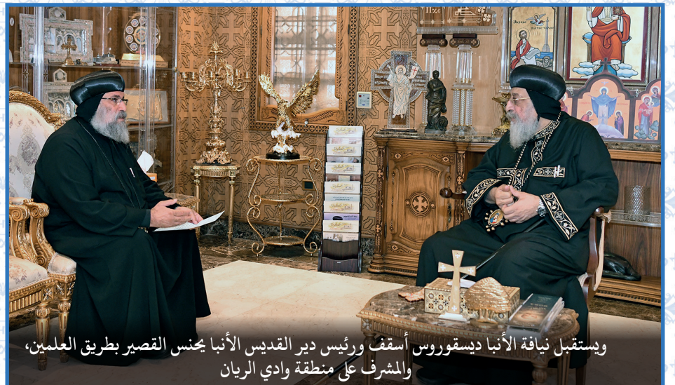
ويستقبل نيافة الأنبا ديسفوروس أسقف ورئيس دير القديس الأنبا بجنس القصر بطريق العلمين، والمشرف على منطقة وادي الريان