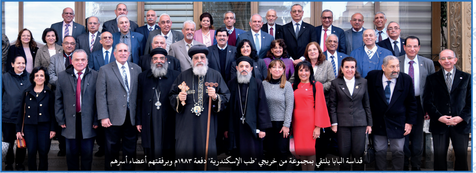
قداسة البابا يلتقي بمجموعة من خريجي "طب الإسكندرية" دفعة ١٩٨٣ ويرفقتهم أعضاء أسرهم