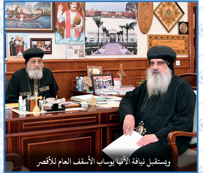
ويستقبل نيافة الأنبا يوسف الأسقف العام للأقصر