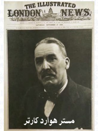
مستر هوارد كارتر

شجاعة مرقس باشا حنا وزير الأشغال الحكومية تنفذ مقبرة توت عنخ آمون من السرقة والضياع، ففي تلغراف رقم "٢٠١"، والذي يرد فيه مرقس باشا على مستر هوارد كارتر مكتشف مقبرة توت عنخ آمون، والذي يتضرر فيه من منعه من الدخول للمقبرة، هو وكامل طاقم العمل معه، رد معالي الوزير عليه بتلغراف أوضح فيه أن التدابير التي اتخذت من الحكومة المصرية جاءت بناء على إغلاق كارتر المدفن وإيقاف أي أعمال تتم به، وهذا يُعتبر إخلالاً بالاتفاق المبرم مع الحكومة المصرية، وتم إعطاء مهلة مدتها ٤٨ ساعة للرد لتلبية مطالب الحكومة بأنكم مستعدون لاستئناف تنفيذ البرنامج المتفق عليه وفقاً لشروط وزارة الأشغال، وإلا يتم إلغاء الترخيص الخاص بأعمال الحفر والتنقيب، بالإضافة إلى تعاون موظفي مصلحة الآثار في حالة استئناف العمل مرة أخرى. (جريدتا مصر والأهرام، ١٩ فبراير ١٩٢٤م).